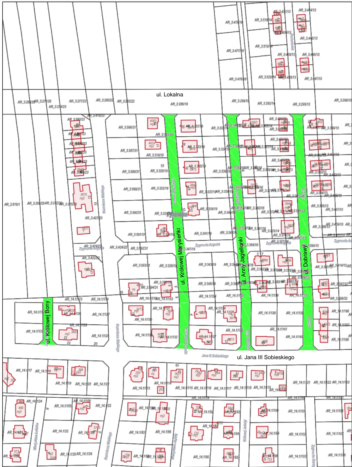
Wydruk w skali 1:2000