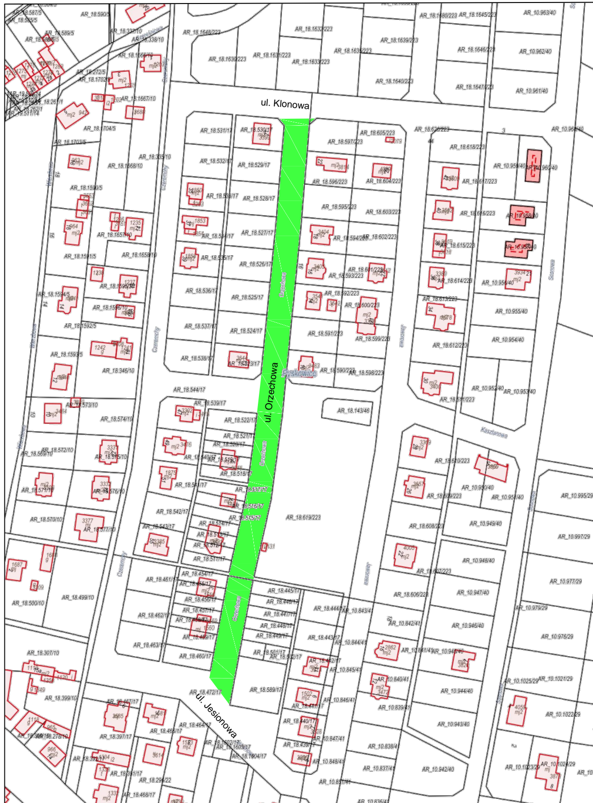
Wydruk w skali 1:2000