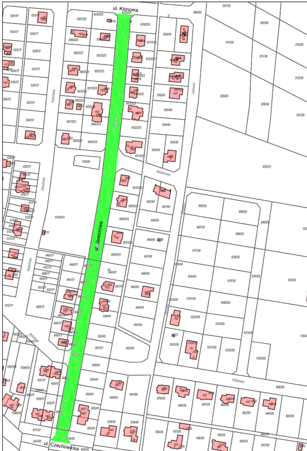
Wydruk w skali 1:2000