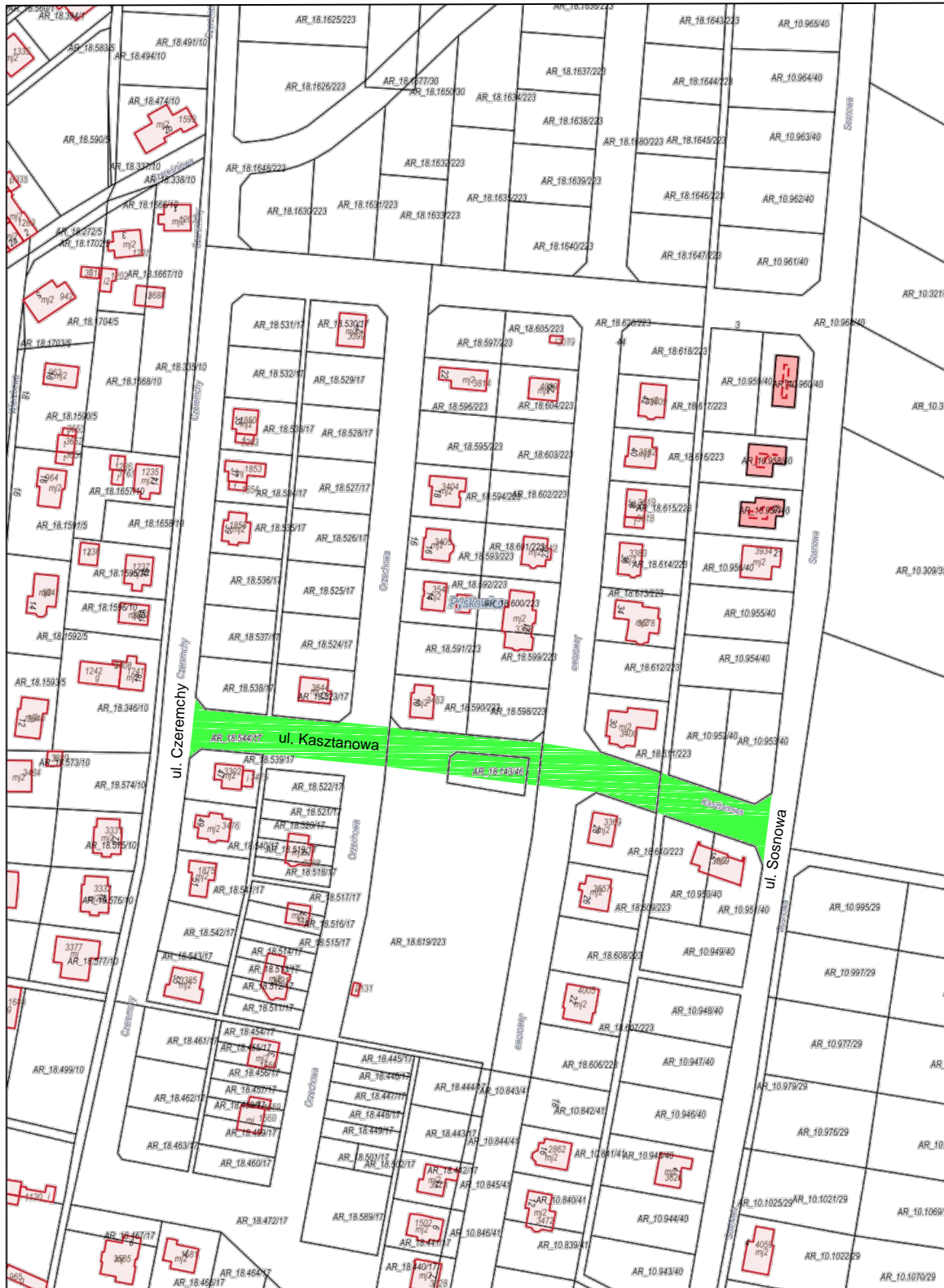
Wydruk w skali 1:2000