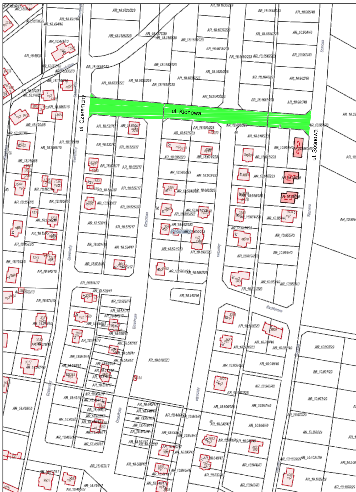
Wydruk w skali 1:2000