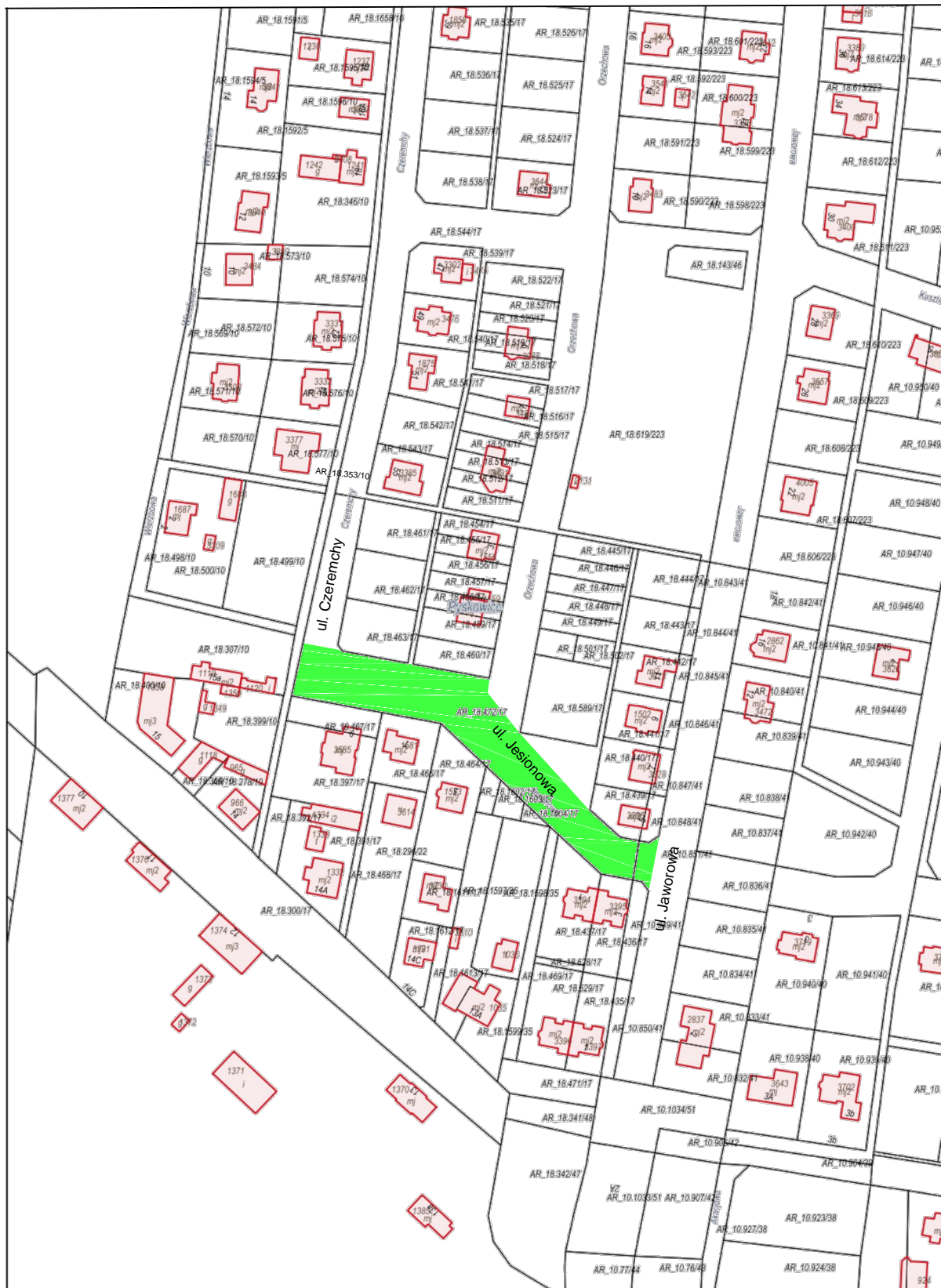
Wydruk w skali 1:2000