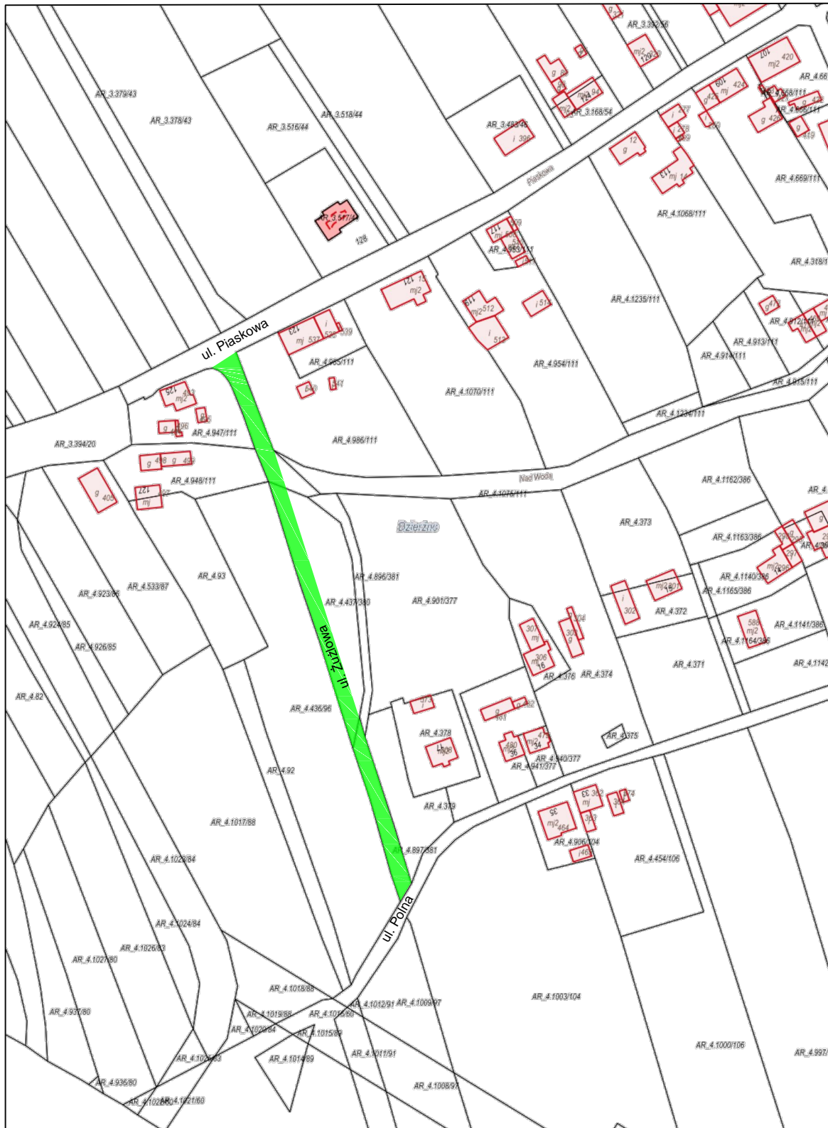
Wydruk w skali 1:2000