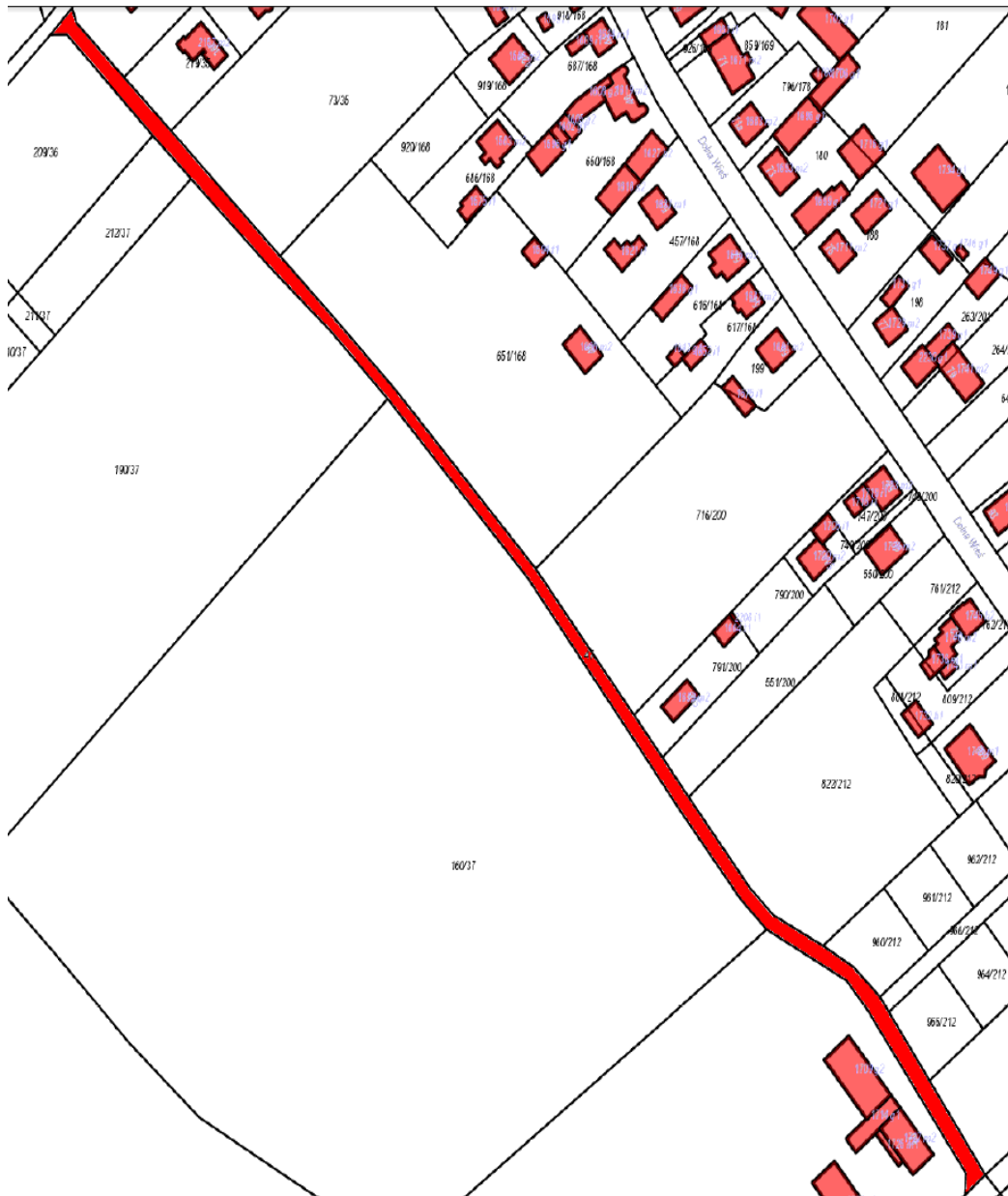
Pilchowice, działka nr 47, km.10