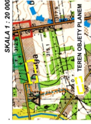
SKALA 1 : 20 000

WYRYS ZE STUDIUM UWARUNKOWAŃ I KIERUNKÓW ZAGOSPODAROWANIA PRZESTRZENNEGO GMI. KONIOPISKA