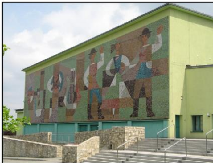
Miejski Ośrodek Kultury, ul. Mariacka 9 – mozaika na elewacji zachodniej – kompozycja z czasów PRL nawiązująca do miejscowego folkloru i historii regionu.

W tej części Radlina skupione są główne funkcje centrotwórcze (administracyjne, usługowe, kulturalne), występuje tu też typowo miejska zabudowa z kamienicami i budynkami użyteczności publicznej (urząd miasta, szkoła, przedszkole). Obecnie centralną ulicą miasta jest ul. Korfantego, przy której koncentruje się zabudowa zarówno mieszkaniowa, usługowa i przemysłowa. W jej bezpośrednim sąsiedztwie zlokalizowano plac z nowopowstałą fontanną, która ze znajdującymi się obok ośrodkiem kultury oraz ośrodkiem sportu i rekreacji (pływalnia) stanowią miejsce spotkań, imprez i odpoczynku mieszkańców.