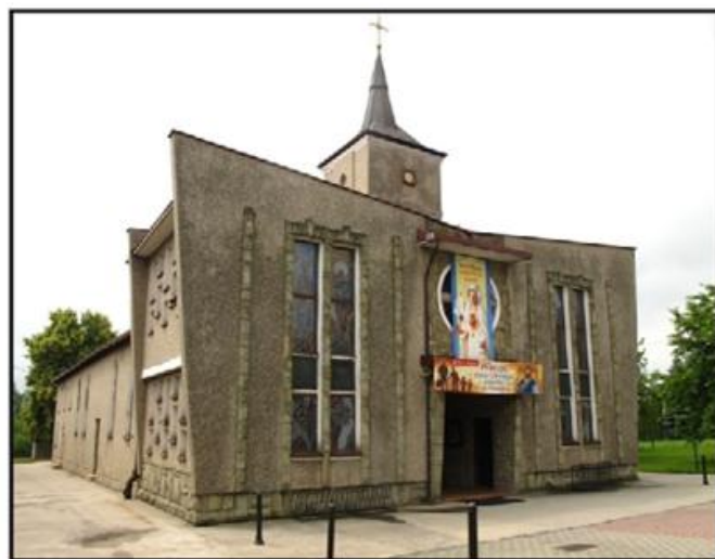
Kościół pw. Niepokalanego Serca Maryi w Radlinie-Głożynach