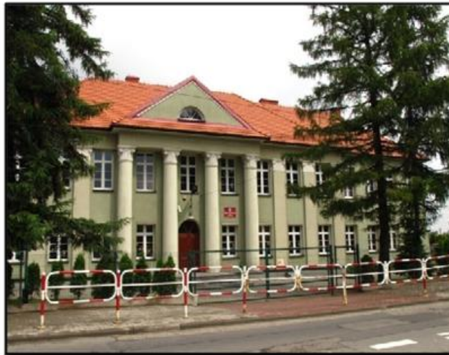
Budynek Szkoły Podstawowej nr 3