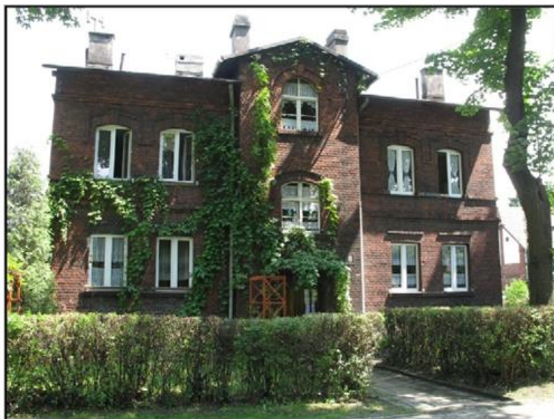
Budynek przy ul. Czecha 8

Osiedle zachowało swój pierwotny układ, zatarty on został jedynie przez likwidację znacznej części budynków gospodarczych. Oprócz budynków mieszkalnych na terenie kolonii znajdował się także duży dom towarowy, kopalniana gospoda, pralnia, łaźnia, piekarnia, zakład fryzjerski, sklep z zakąskami, 3 domy noclegowe, a także pomieszczenia tzw. biblioteki ludowej. Do dziś zachowany został pierwotny układ urbanistyczno-przestrzenny osiedla, jego główne ulice utrzymały swój dawny przebieg, a zabudowa mieszkaniowa i usługowa przetrwała do dziś.