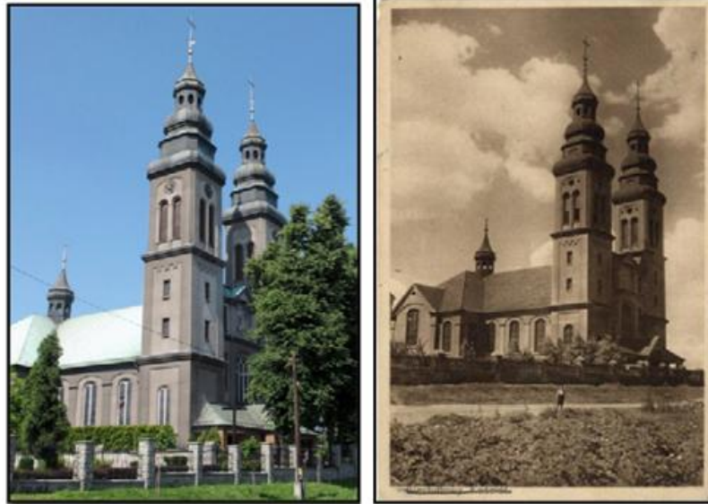
Kościół pw. Wniebowzięcia NMP w Bierdułtowach, dziś w centrum Radlina i na pocztówce z 1941 r.

szczególnie z realizacji architektury kościelnej (był m.in. do 1939 jednym z szefów budowy katedry katowickiej, wybudował w sumie kilkanaście kościołów, głównie na Śląsku). Sama forma kościoła nawiązuje do architektury barokowej, nieobecnej do tej pory na terenie Radlina.