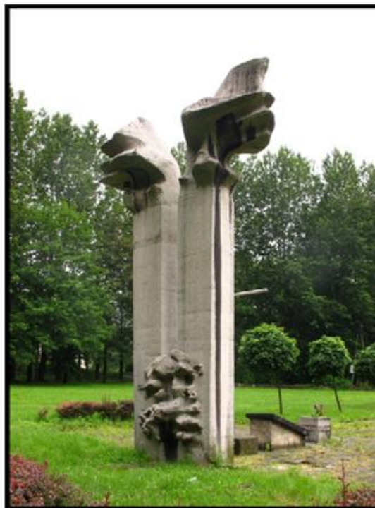
Pomnik Ofiar Szybu Reden z 1973 r.

Po odzyskaniu wolności pod koniec marca 1945 r. w Radlinie po dużych zniszczeniach przystąpiono do odbudowy, uruchamiania administracji państwowej, otwierania szkół. W wyniku reformy administracyjnej w 1954 r. ziemia rybnicko-wodzisławska została podzielona na powiat rybnicki oraz wodzisławski, a połączone wsie Radlin Górny, Radlin Dolny, Biertułtowy, Głożyny i Obszary utworzyły samodzielne miasto Radlin (pow. wodzisławski), które w 1975 r. na skutek kolejnej reformy administracyjnej wraz z Pszowem, Rydułtowami i Markłowicami zostało włączone w granice Wodzisławia Śląskiego. Samodzielnym miastem Radlin stał się na początku 1997 r.