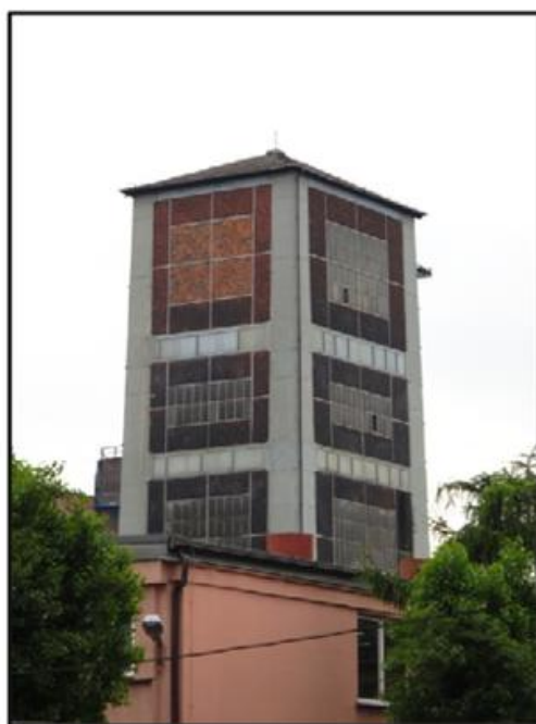
Szyb „Wiktor” na terenie kopalni KWK „Marcel”

Zachowane obiekty kopalni „Emma” tworzą zabytkowy kompleks o ciekawym układzie i zachowanej wartościowej architekturze przemysłowej. Obecne rozplanowanie pochodzi z początków XX w., kiedy w ramach modernizacji zespołu wzniesiono cały kompleks przemysłowo-socjalny. Z tego okresu do naszych czasów dotrwała zabudowa wzdłuż ul. Korfantego, zespół siłowni z kotłownią, warsztaty oraz najcenniejszy obiekt w zespole: wieża szybu „Wiktor”, projektu Hansa Poelziga (1869-1936) z elektrycznym urządzeniem wyciągowym w głowicy. Ponadto z dawnego zespołu zachowały się między innymi budynki administracji, dyrekcji, elektrowni, d. rozdzielni prądu i straży pożarnej.