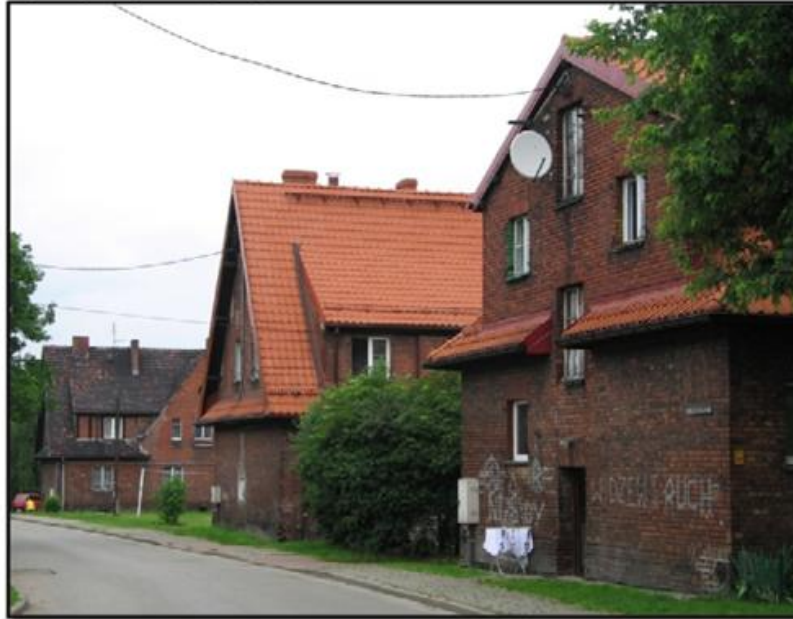
Widok ul. Mielęckiego na zabytkowym osiedlu „Emma” w Radlinie

usługowe. Osiedle zaprojektowano w myśl idei „miasta ogrodu”. O nowatorstwie i dalekowzroczności takiego rozwiązania może świadczyć fakt, że dziś osiedle wymaga jedynie rewitalizacji technicznej i społecznej, nie wymagającej zasadniczych zmian urbanistycznych i planistycznych.