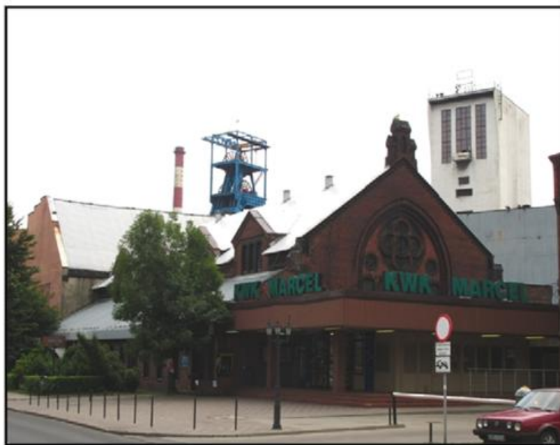
Kopalnia „Marcel” (dawniej „Emma”) w Radlinie

W 1858 r. nadano pola górnicze kopalni „Emma”, która po budowie w latach 1883-1885 rozpoczęła eksploatację węgla kamiennego. Szybki rozwój kopalni przyczynił się do konieczności poszukiwań wysoko wykwalifikowanych robotników oraz zapewnienia im odpowiednich warunków socjalnych. Równoległe powstał zespół osiedla patronackiego, którego obecna forma to efekt rozbudowy w latach 1897 i 1910-1913. Na lata 1909-1911 przypada budowa i uruchomienie koksowni. W 1949 r. nowa władza ludowa zmienia nazwę kopalni na Marcel, na cześć przedwojennego działacza komunistycznego Józefa Kolorza o takim właśnie pseudonimie.