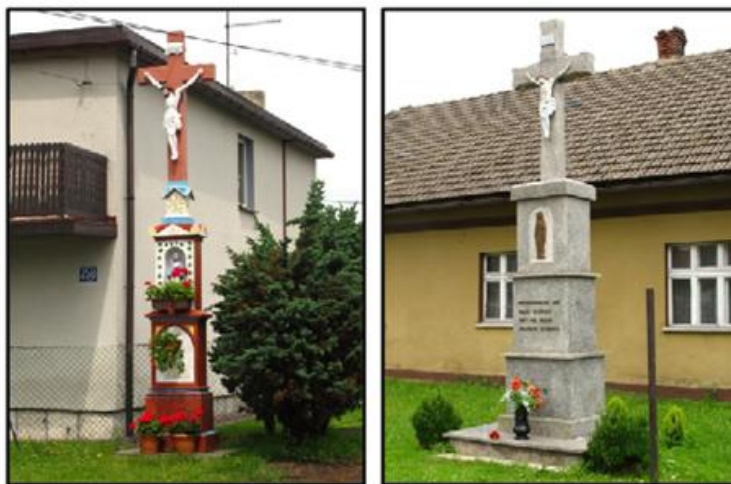
Krzyże kapliczkowe przy ul. Rymera 258 oraz przy ul. Wrzosowej 41

Krajobraz wiejski, kształtowany przez zabudowę o niewielkich gabarytach, występuje w zachodniej części miasta, głównie na terenie dawnej wsi Głóżyń, która była osobną jednostką administracyjną do 1954 r. (w latach 1975-97 dzielnica Wodzisławia). Jest to obecnie obszar o charakterze podmiejskim, rozciągnięty pomiędzy ulicami: Rydułtowska, Rymera, Głóżyńska, Domeyki, Kominka, głównymi szlakami komunikacyjnymi historycznych układów ruralistycznych dawnych wsi „ulicówek”, które w wyniku procesu industrializacji utraciły swoje pierwotne cechy. Jedną z pozostałości po typowo wiejskim krajobrazie są liczne krzyże i kapliczki przydrożne.