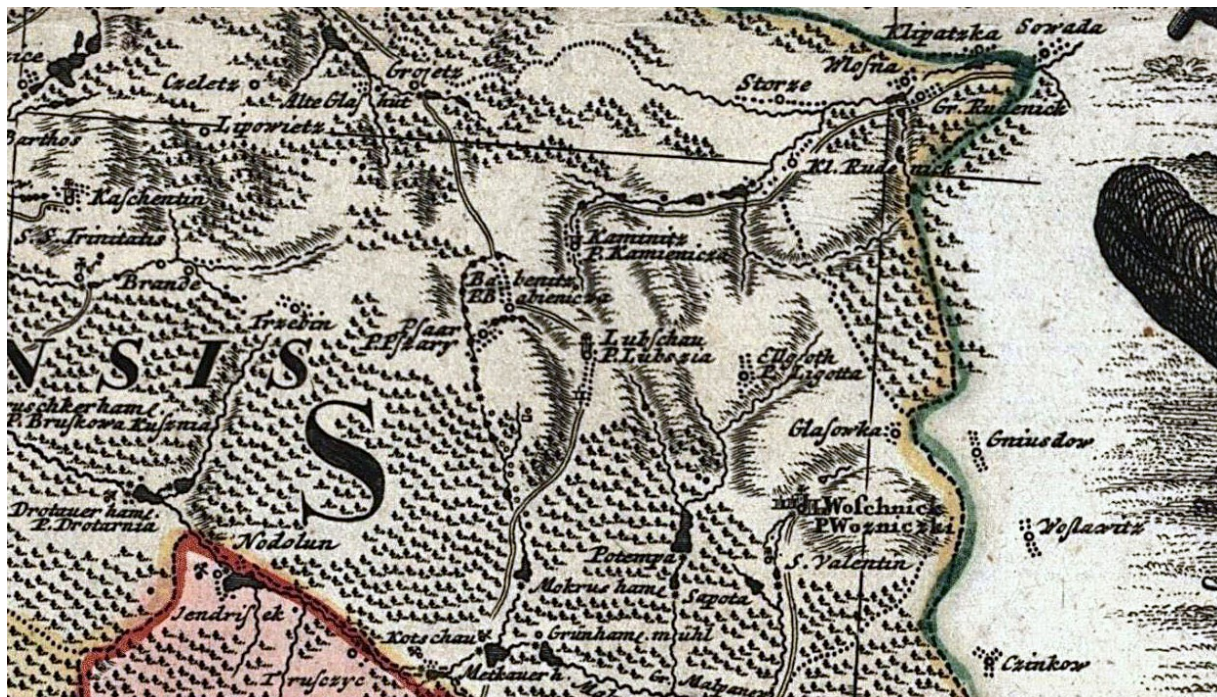
Johann W. Wieland, Homanns Erben "Principatvs Silesiae Oppoliensis ... ", 1736 r.

Wiadomo, że przebiegał tędy szlak handlowy z Wrocławia przez Lubecko, Lubszę, Woźniki, Siewierz w stronę Krakowa. Wiadomo również, że istniała w Woźnikach stacja celna, o czym mówią zapisy z 1310 roku. Warto wspomnieć, że miasto lokowane było