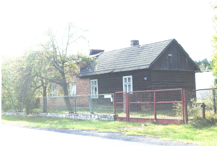
Ostatni drewniany dom w gminie z pocz. XX w., Drogobycza ul. Gliwicka 19

Jedna z opowieści podaje, że nazwa miejscowości pochodzi od potocznego określenia drogi, którą pędzono bydło z Polski przez Śląsk na Węgry. Inna przypisuje nazwę określeniu