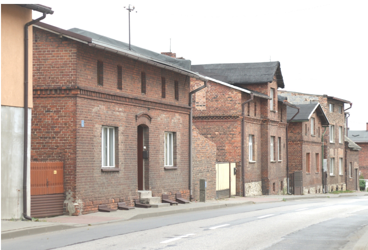
Zespół ceglanych domów w Lubszy, zbudowanych na miejscu drewnianych po pożarze wsi w 1917 r.

Ogromne zniszczenia spowodował pożar w 1917 roku, kiedy to całkowitemu spaleniu uległy 22 całe gospodarstwa oraz pojedyncze zabudowania. W czasie Powstań Śląskich Lubsza wchodziła w skład tzw. Republiki Woźnickiej.