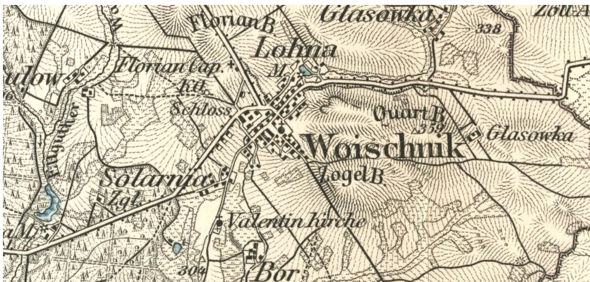
Widok Woźnik na fragmencie mapy "Karte des Deutsches Reiches, nr. 479" z 1893 roku, skala oryginału 1 do 100000.

Woźniki posiadają średniowieczny układ urbanistyczny ukształtowany prawdopodobnie w wyniku lokacji na przełomie XIII i XIV w, ponieważ nie jest znana dokładna data lokacji nowego miasta. Układ przestrzenny, chroniony wpisem do rejestru zabytków. Ze źródeł historycznych wiadomo, że w okresie późnego średniowiecza miasto stanowiło osadą otwartą, nie posiadającą murów, baszt i bram. Jedyne miejsce umocnione było grodzisko, tzw. stare miasto Woźniki. Trudno jednak określić wielkość Woźnik z tego okresu. Miasto, które obejmowało okoliczne wsie, kuźnie, warzelnie soli, pod koniec XVIII wieku ogranicza się prawie wyłącznie do samego miasta. Bezpośrednie zaplecze uległo zawężeniu na skutek wydzielenia nowej jednostki administracyjnej Łany (Lohna). Pod koniec XVIII wieku w wyniku reformy Fryderyka II Wielkiego miasto zostało zdegradowane do osady targowej „marktflecken”. Odzyskanie przywilejów miejskich i ponowny rozwój to dopiero 1858 rok. Wiadomo także, że Woźniki kilkakrotnie ogarnięły pożary, niszcząc drewnianą zabudowę. Pierwsze murowane budynki pojawiają się