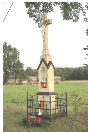
Krzyże kamienne z 1912 roku z Ligoty Woźnickiej i Skrzesówki oraz krzyż z Górali