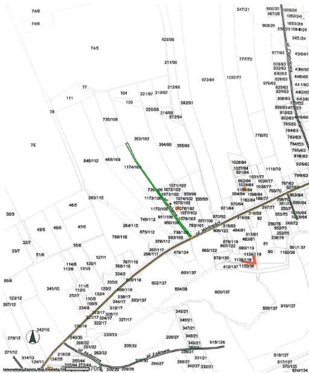
Data : 12.04.2013 Skala 1 : 5000

Załącznik nr 2 do Uchwały Rady Gminy Zbrostawice Nr 365/2013 z dnia 7 sierpnia 2013