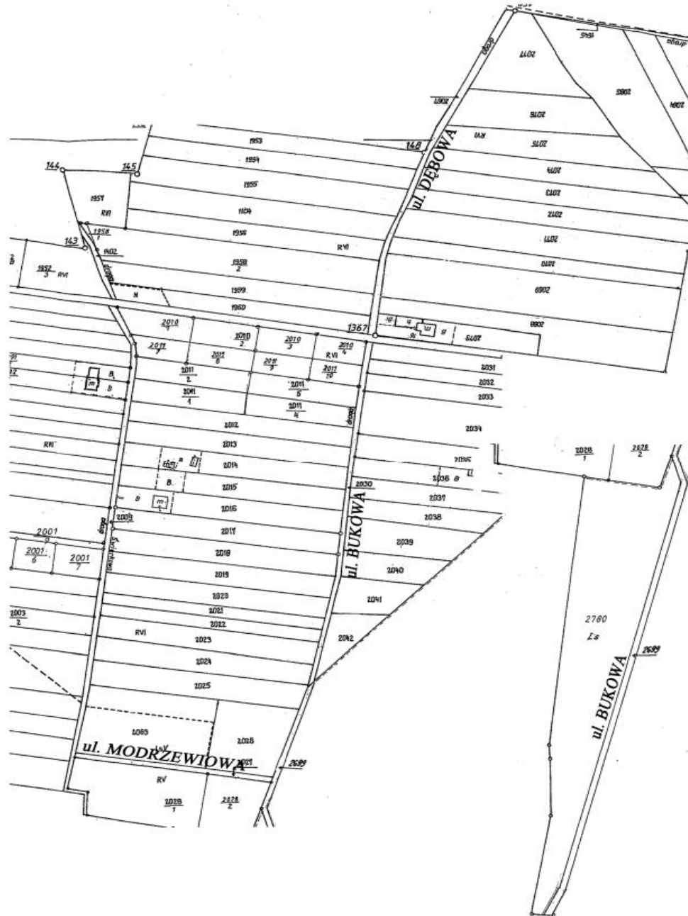
Załącznik graficzny nr 5 do Uchwały Rady Gminy Konopiska Nr147/XX/2012 z dnia 30.05.2012