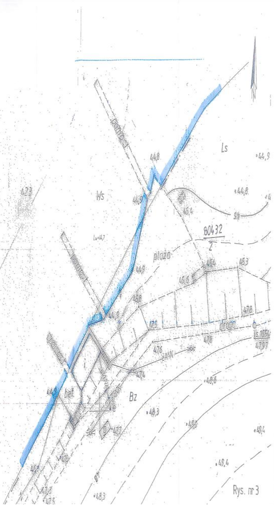
Rys. nr 3

STAROSTA SZANOTULSKI POBIORYTÓR OŚRODKÓW DOKUMENTACJI GEODEZYJNEJ I KARTOGRAFICZNEJ w Szanotulach Wznowienie oszacowania kary... podlegającym w sprawie o karze... dotyczy. Dokumentacja pomiarowa... pomiary (k. strona nr 10-15) kary... 548-74/09 Wznowienie oszacowania kary... dotyczy. Dokumentacja pomiarowa... pomiary (k. strona nr 10-15) kary... 548-74/09 Wznowienie oszacowania kary... dotyczy. Dokumentacja pomiarowa... pomiary (k. strona nr 10-15) kary... 548-74/09 Wznowienie oszacowania kary... dotyczy. Dokumentacja pomiarowa... pomiary (k. strona nr 10-15) kary... 548-74/09