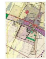
FRAGMENT STUDIUM UWARUNKOWAN I KIERUNKÓW ZAGOSPODAROWANIA PRZESTRZENNEGO GMINY STRZAŁKOWO ——— GRANICA OBSZARU OBJĘTEGO PLANEM