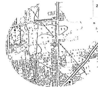
Skala 1:10 000

Załącznik do Uchwały Rady Miejskiej w Koźminie Wielkopolskim Nr XXXV/200/2013 z dnia 27 MARCA 2013r.