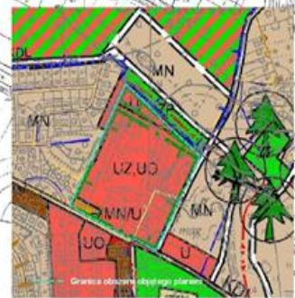
WYRYS ZE STUDIUM UWARUNKOWAŃ I KIERUNKÓW ZAGOSPODAROWANIA PRZESTRZENNEGO GMINY RAWICZ