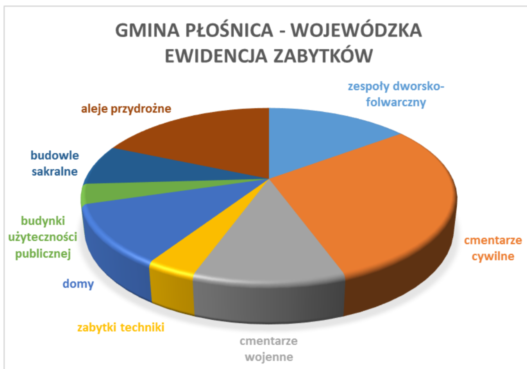
Wykres 3. Gmina Płońsk. Proporcje poszczególnych kategorii funkcjonalnych obiektów zabytkowych ujętych w gminnej ewidencji zabytków, z wyłączeniem obiektów objętych ochroną prawną poprzez wpis do rejestru zabytków województwa warmińsko-mazurskiego.

Ewidencja zabytków gminy Płońsk, poza zabytkami wpisanymi do rejestru zabytków, zgodnie z art. 22 ust. 4 ustawy z dnia 23 lipca 2003 r. ustawy o ochronie zabytków i opiece nad zabytkami (Dz. U. 2018 poz. 2067) obejmuje także obiekty włączone do wojewódzkiej ewidencji zabytków. W przewadze są to zabytkowe cmentarze, cywilne i wojenne z czasów I wojny światowej oraz zespoły dworsko-folwarczne.