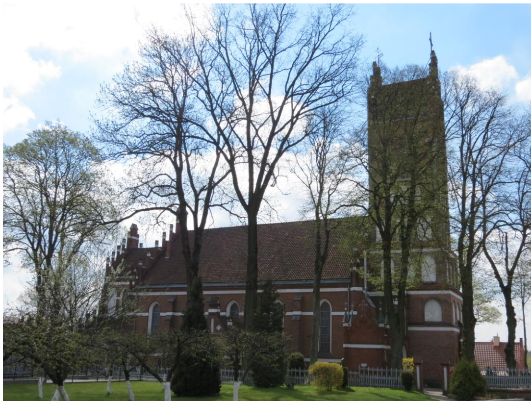
Kościół w Dywitach.

Pierwszą wzmiankę o Dywitach podaje dokument z 15 VII 1354 roku. Lokację Dywity otrzymały 5 X 1366r. z rąk Kapituły Warmińskiej, która równocześnie wyposażyła kościół parafialny. Pierwszy kościół gotycki poświęcony św. Apostołom Szymonowi i Tadeuszowi został wzniesiony prawdopodobnie jeszcze w XIV w. Wieża została postawiona na przełomie wieków XV i XVI. W 1893 rozebrano kościół pozostawiając wieżę. Wybudowano nowy i konsekrowano go 25 X 1897 r. Budowniczym nowego kościoła był ks. Józef Rapierski, który wyposażył także jego wnętrze. Neogotycki ołtarze, figury apostołów, konfesjonał i chór wykonały zakłady sznycerskie z Królewca. Szkoła wrocławska wykonała witraże, a szkoła śląska obrazy drogi krzyżowej i obrazy bocznych ołtarzy.