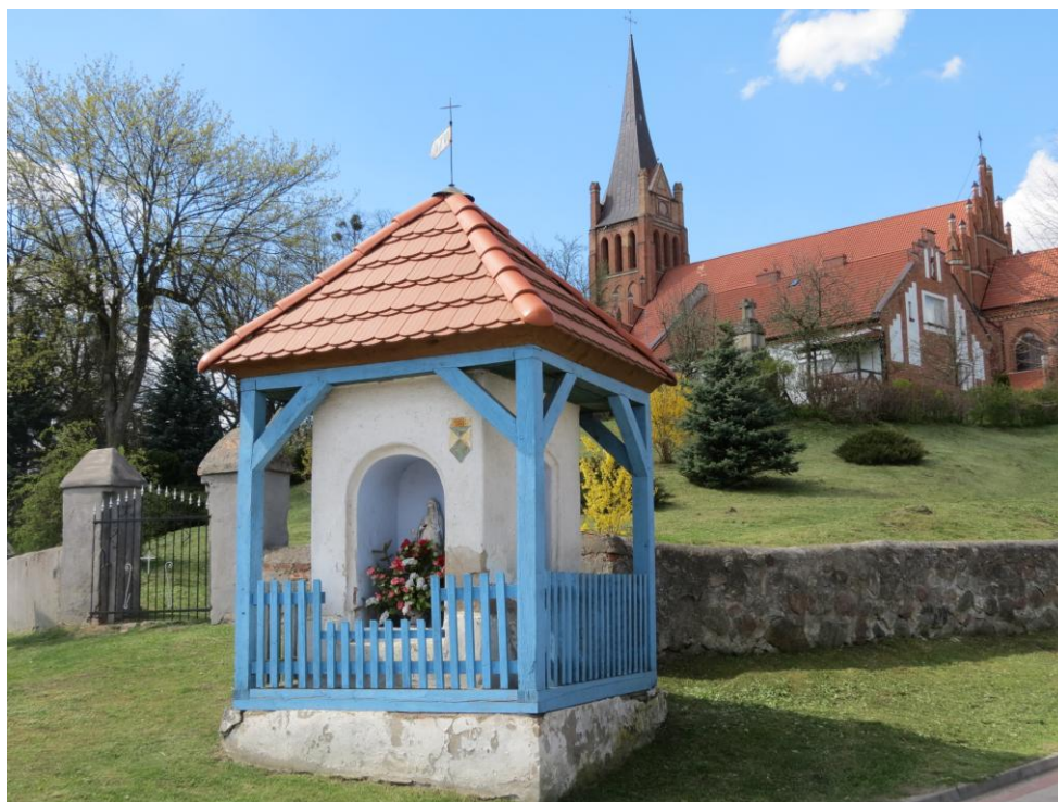
Brąswałd, kapliczka przydrożna z 1786 r.

dla mieszkańców wydarzeniach. Z uwagi na swoją architekturę stanowią niewątpliwe dzieła sztuki, a ludność wiejska nadal otacza je wielkim szacunkiem i opieką. Większość z nich pochodzi z przełomu XIX i XX wieku. Wiele z istniejących kapliczek wpisanych jest na listę zabytków i stanowią wspólne dziedzictwo kulturowe wszystkich mieszkańców Warmii. W ramach programu „Ratujmy warmińskie kapliczki” powstał pomysł, mający na celu, obok zapewnienia pracy dla miejscowej ludności przy renowacji kapliczek, obudzenie wśród Warmiaków przywiązania do miniaturowych obiektów sakralnych. Opieka nad kapliczkami dowodzi szacunku mieszkańców dla historii Warmii oraz wzrastającej świadomości i wrażliwości na dziedzictwo kulturowe.