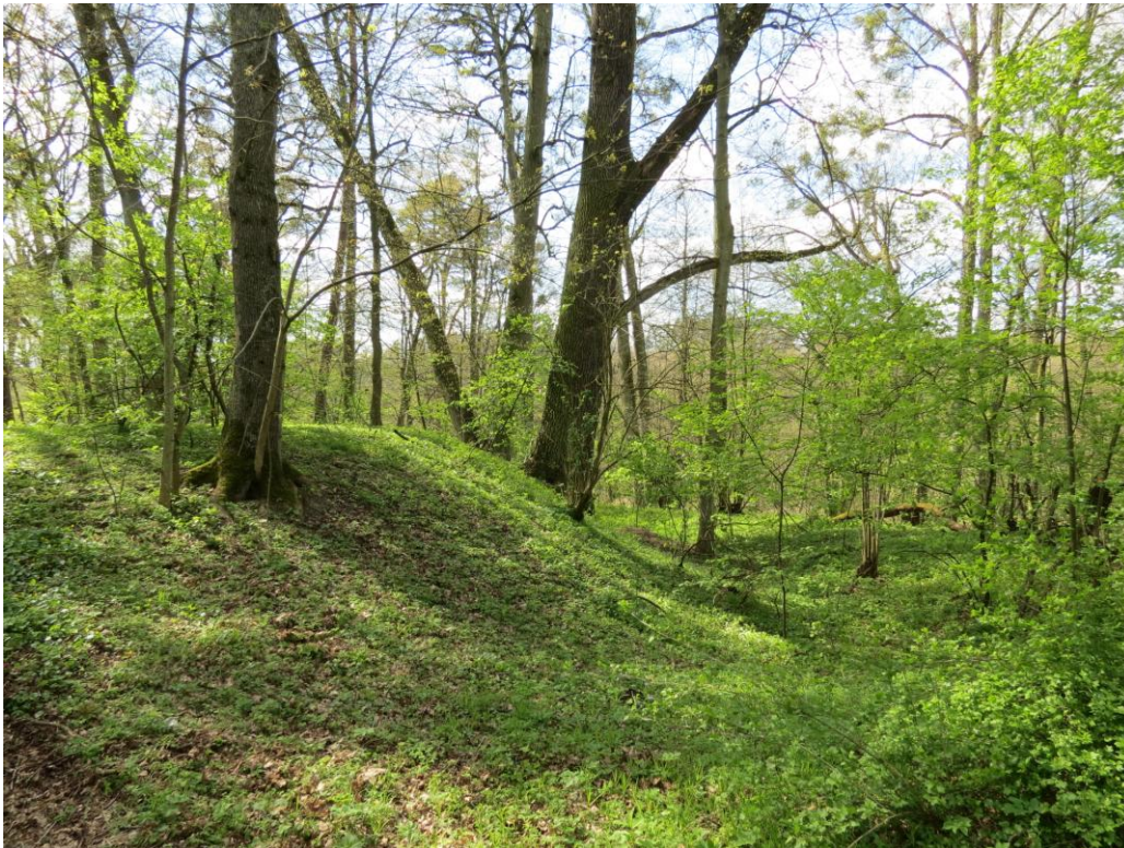
Wał grodziska w Barkwedzie.

działania inwestycyjne związane z budową i rozbudową współczesnej infrastruktury (systematyczne poszerzanie zabudowy zarówno w obrębie przestrzeni miejskich, jak też i wiejskich, budowa i modernizacja dróg, rozwój przemysłu i turystyki); coraz intensywniejszy i zakrojony na szeroką skalę proces poszukiwań amatorskich, często o charakterze komercyjnym i kolekcjonerskim, powodujący w wielu wypadkach całkowite zniszczenia stanowisk do tej pory niezagrożonych; coraz intensywniejsza eksploatacja surowców naturalnych (żwiru, piasku, itp.), w niektórych przypadkach przebiegająca w sposób nielegalny.