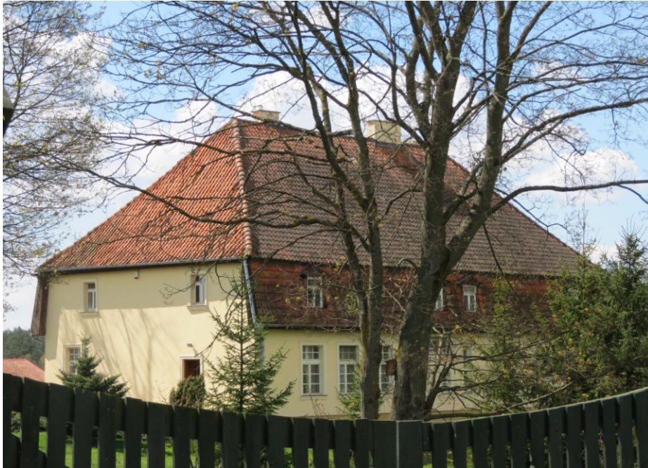
Spręcowo, dwór w zespole dworsko-folwarcznym.