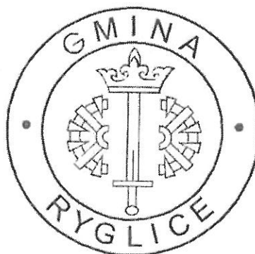
PIECZEĆ GMINY RYGLICE