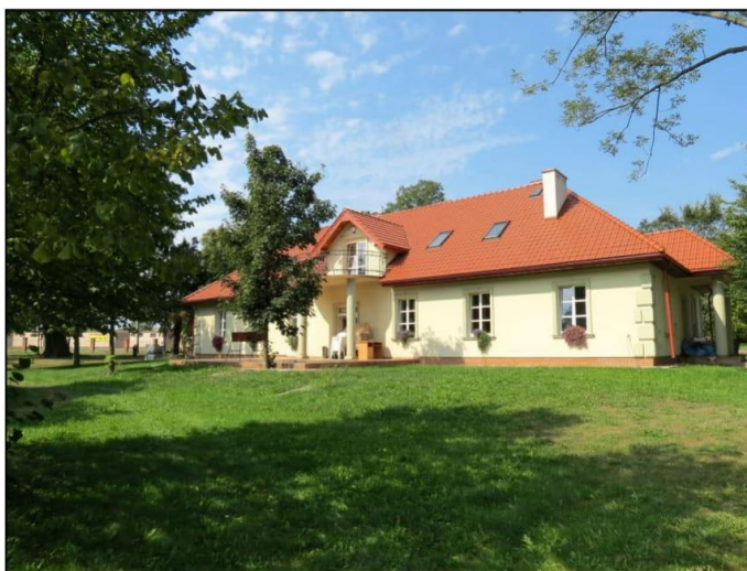
Dwór „Belweder” w Chmielowie

Dwór w Chmielowie zwany "Belwederem", pochodzący z pierwszej poł. XIX w., usytuowany jest w południowo-zachodniej części miejscowości. Wybudowany z cegły palonej, obustronnie otynkowany. Założony na planie wydłużonego prostokąta, dwutraktowy, zwrócony elewacją frontową w kierunku północno-zachodnim. Bryła prostopadłościenna, jednokondygnacyjna, bez podpiwniczenia, nakryta dachem czterospadowym o połaciach dachówkowych.