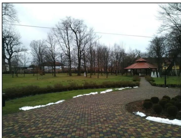
Pozostałości parku przy dworze „Belweder” w Chmielowie

Wokół dworu rozciąga się park o układzie swobodnym, założony w I. poł. XIX w. Do dworu prowadziła aleja dojazdowa, której zakończenia znajdowały się po pn.-wsch. i pd.-zach. granicy. Przed frontem dworu znajdował się kolisty klomb z podjazdem. W parku występowały grupy drzew i krzewów, które w części pn.-zach. zgrupowane były w dwóch skupieniach. Nielicznie naniesione ścieżki w tej części parku miały układ swobodny. Znajdowało się tu również niewielkie zagłębienie wypełnione wodą, która odpływała w kierunku północnym. Część rolniczo-ogrodnicza przylegała do parku od strony pn. i zach. Miała ona zwłaszcza w części pd.-zach. regularny kwaterowy charakter z siecią prostopadle krzyżujących się ścieżek wzdłuż których rosły krzewy.