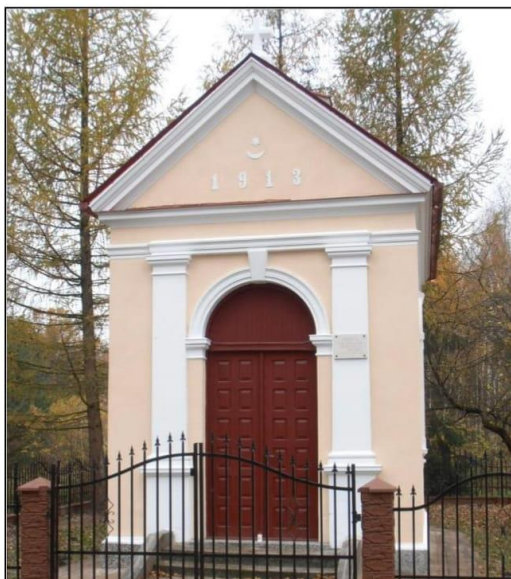
Kapliczka z obrazem św. Rozalii w Rozalinie

Wyróżnikiem jest interesujące opracowanie wejścia, ujętego portalem w postaci półkolistego arkadowego obramienia, flankowanego dwoma pilastrami. W ścianach bocznych okna z dekoracyjnymi obramieniami. Dach dwuspadowy z sygnaturką, w polu trójkątnego frontonu umieszczono herb Tarnowskich - Leliwa oraz datę 1913.