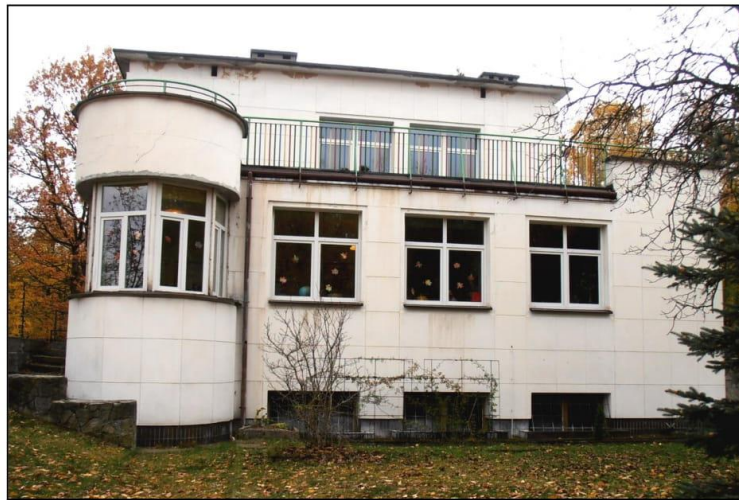
Willa dyrektora wytwórni amunicji nr 3 w Nowej Dębie

Budynki dla kadry kierowniczej i dyrektorskiej charakteryzuje styl architektoniczny art. déco, który cechuje uproszczona forma i geometryczne kształty nawiązujące do tradycji klasycznej. W latach powojennych 1949-1957 na terenie osiedla wybudowano budynki mieszkalne wielorodzinne w stylu socrealistycznym. Powstały 34 budynki mieszkalne w części centralnej o architekturze realizowanej w Polsce w latach 1949-1956 w ramach obowiązującej wówczas doktryny realizmu socjalistycznego, definiowanej w tym czasie jako „socjalistyczna w treści i narodowa w formie”.