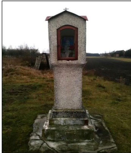
Kapliczka murowana z figurą Matki Bożej Niepokalanej w Cyganach

Niewiele zachowało się na tym terenie zabytkowych krzyży drewnianych. Są one wykonane z różnych gatunków drzew, często z dębu jako materiału najtrwalszego i posiadają z reguły skromne zdobienia oraz wyryte inskrypcje. Na szczególną uwagę wśród nich zasługuje krzyż z drewnianą, ludową rzeźbą Chrystusa Ukrzyżowanego w Chmielowie, usytuowany przy drodze Tarnobrzeg - Rzeszów.