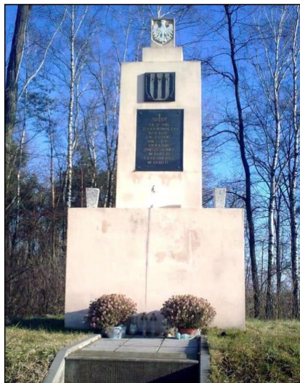
Pomnik grunwaldzki w Chmielowie

Ponownie pomnik został odnowiony w roku 2010 z okazji 600-lecia Bitwy pod Grunwaldem.