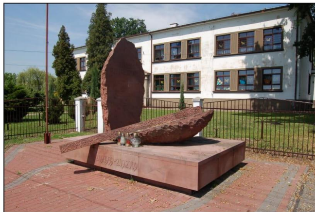
Pomnik ofiar bombardowania w Chmielowie

W roku 2009 został odsłonięty pomnik upamiętniający 70 rocznicę bombardowania Chmielowa, usytuowany w okolicy budynku Szkoły oraz Kościoła. Postument złożony jest z betonowej prostokątnej podstawy obłożonej granitowymi płytami, na której znajduje się motyw leżącego krzyża i stojącego głazu z granitu z napisem „OFIAROM BOMBARDOWANIA”.