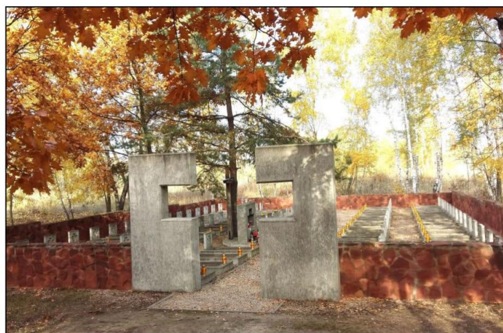
Cmentarz wojenny w Chmielowie

Ponadto, nowe cmentarze założone zostały wraz z powstaniem parafii w Cyganach i Jadachach.