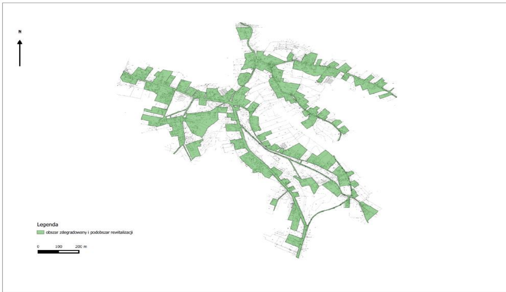
Załącznik nr 2. Obszar zdegradowany i podobszar rewitalizacji Wólka Turebska skala 1:5 000

Załącznik Nr 2 do Uchwały Nr XXVI/323/2017 Rady Gminy w Zaleszanach z dnia 13 lutego 2017 r.