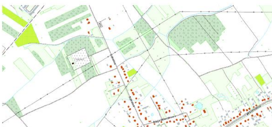
Mapa przedstawiająca lokalizację drogi gminnej (obok Pana Rzeszuta) działka nr ewid. 883 w Woli Baranowskiej