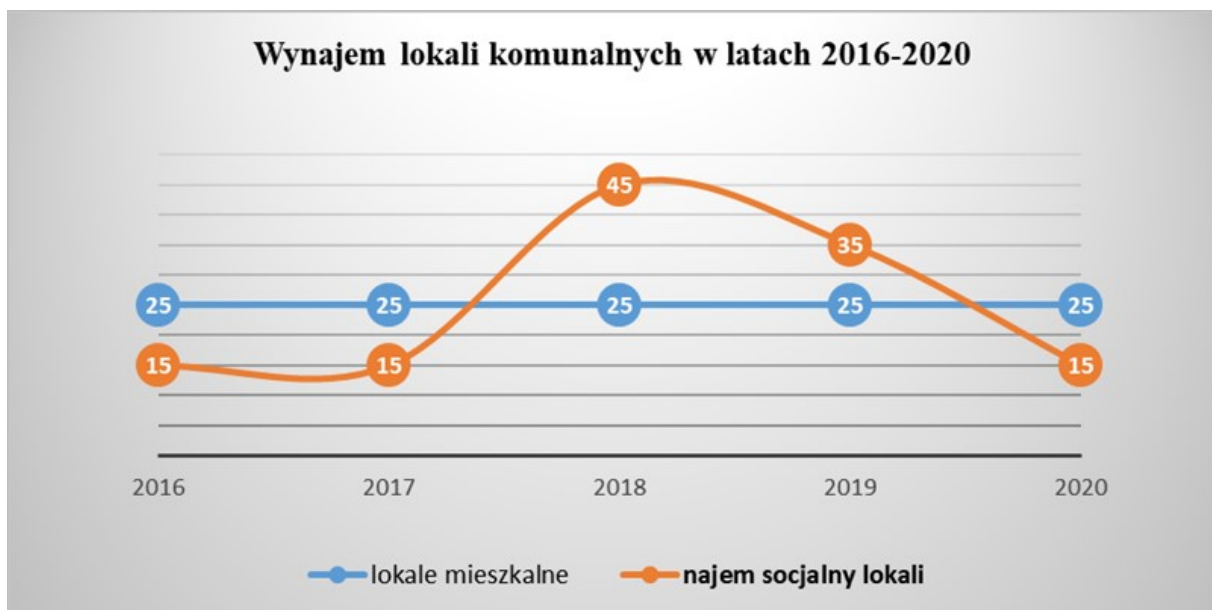
Wykres nr 3

Prognoza dotycząca wielkości mieszkaniowego zasobu Gminy