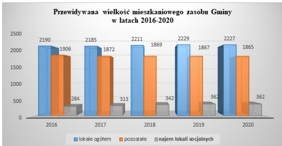
Wykres nr 4

3. Procedura związana z zawieraniem umów najmu lokali przedstawiona w niniejszym programie odbywa się zgodnie z uchwalonymi przez Radę Miejską w Suwałkach zasadami wynajmowania lokali mieszkalnych wchodzących w skład mieszkaniowego zasobu Gminy.