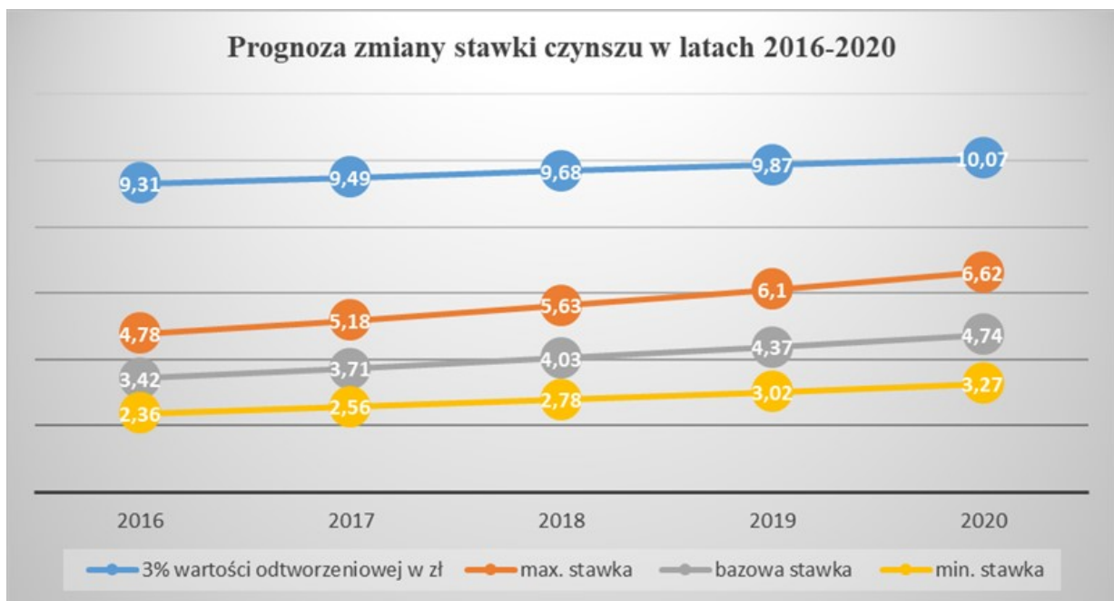
Wykres nr 5

6. Przychody uzyskiwane z czynszów są dalece niewystarczające na pokrycie wszystkich kosztów utrzymania budynków mieszkalnych. W 2015 r. przewiduje się, że jednostkowe wydatki wyniosą średnio około 4,17 zł/m 2 wobec średniego przychodu z czynszu najmu za lokale mieszkalne na poziomie 3,16 zł/m 2 . Przychód ten wystarczy na pokrycie kosztów bieżącej eksploatacji, które wyniosą – bez remontów – około 2,08 zł/m 2 . Ze średniego przychodu czynszowego na potrzeby remontowe pozostaje 1,08 zł/m 2 .