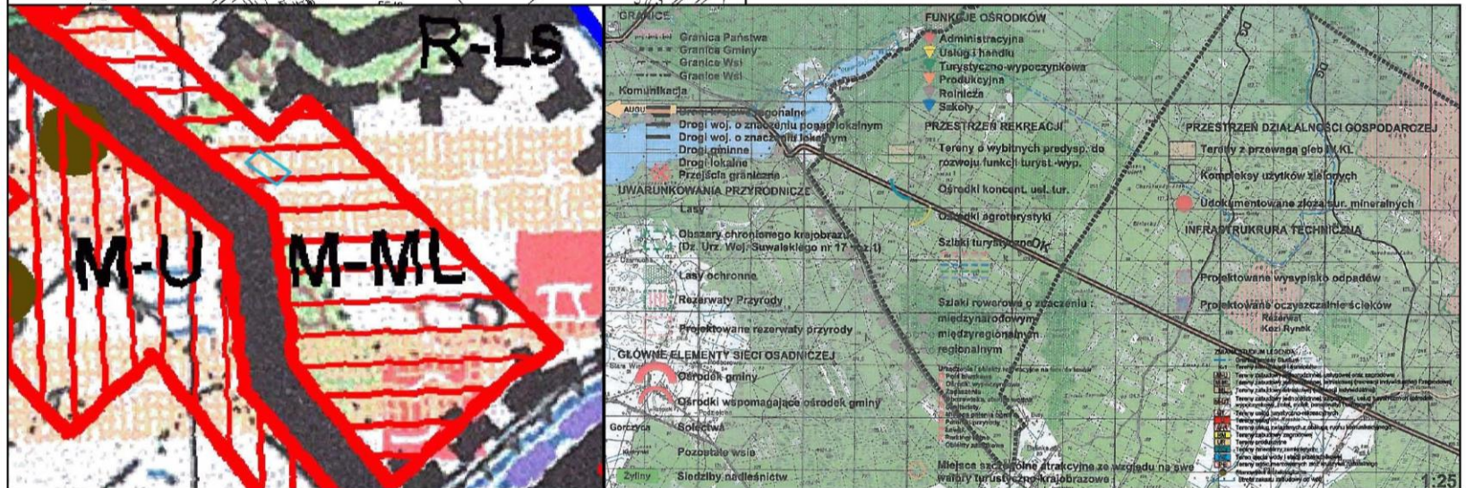
Wyrwy z studium uwarunkowań i kierunków zagospodarowania przestrzennego gminy Plaska