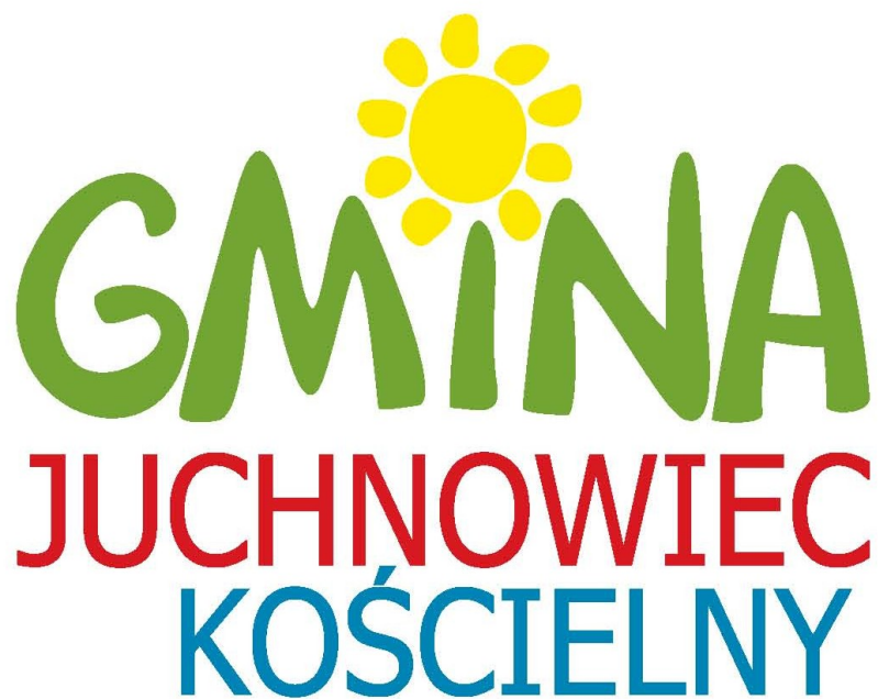
Logo Gminy Juchnowiec Kościelny

Załącznik Nr 1 do uchwały Nr XXV/285/2013 Rady Gminy Juchnowiec Kościelny z dnia 18 kwietnia 2013 r.