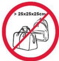
Pudła, torby, plecaki, walizki i inne wszelkie przedmioty większe niż 25 cm x 25 cm x 25 cm