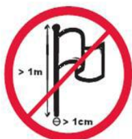
Maszyny flagowe lub banerowe o większej długości niż 1 m. i średnicy niż 1 cm