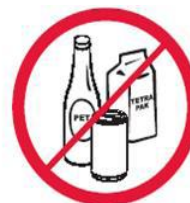
Butełki, puszki, kubki, dzbanki