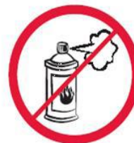
Gaz w aerozolu, substancje żrące, łatwopalne, barwniki