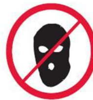
Części ubioru zakrywające twarz, kominiańki