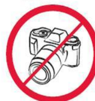
Profesjonalne aparaty fotograficzne, kamery wideo