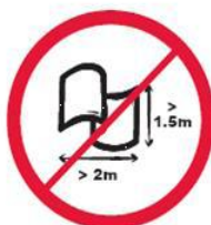
Banery lub flagi o wymiarach większych niż 2.0 m x 1.5 m.