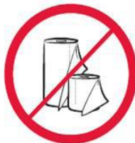
Duże ilości papieru