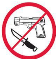
Broń, materiały wybuchowe, noże

Piktogramy odnoszące się do regulacji porządkowych wynikających z regulaminu, które oznaczają zakaz wnoszenia, posiadania i używania niżej oznaczonych przedmiotów na stadionie