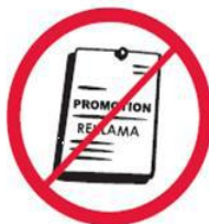
Przedmioty, materiały, ubrania komercyjne i promocyjne