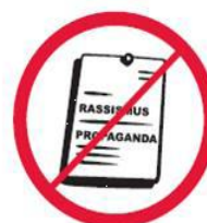
Materiały rasistowskie, ksenofobiczne, polityczne, religijne, propagandowe