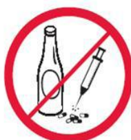
Napoje alkoholowe, narkotyki