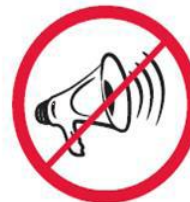
Megafony, syreny, inne urządzenia emitujące dźwięk