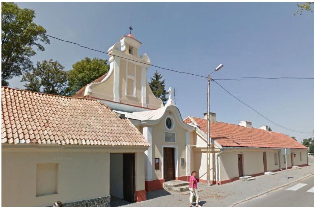
Kaplica cmentarna w Chodczu