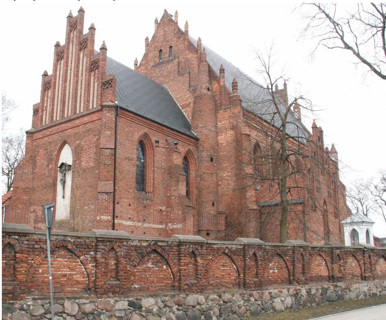
Kościół p.w. św. Stanisława Biskupa w Brześciu Kujawskim