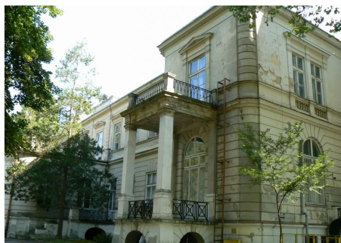
Pałac w Wieńcu - elewacja frontowa