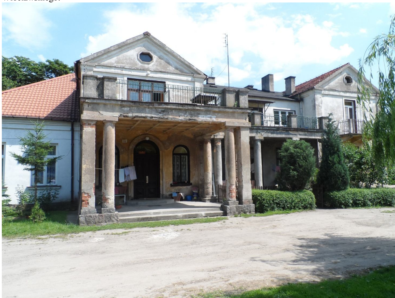
Dwór w Otmianowie

Zabytki będące własnością powiatu włocławskiego i Skarbu Państwa reprezentowanego przez Starostę Włocławskiego: