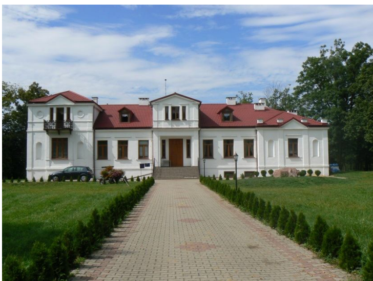
Dwór w Żydowie