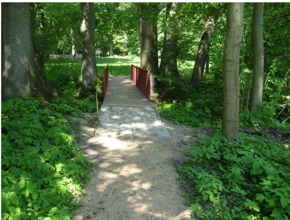
Park podworski w Śmiłowicach