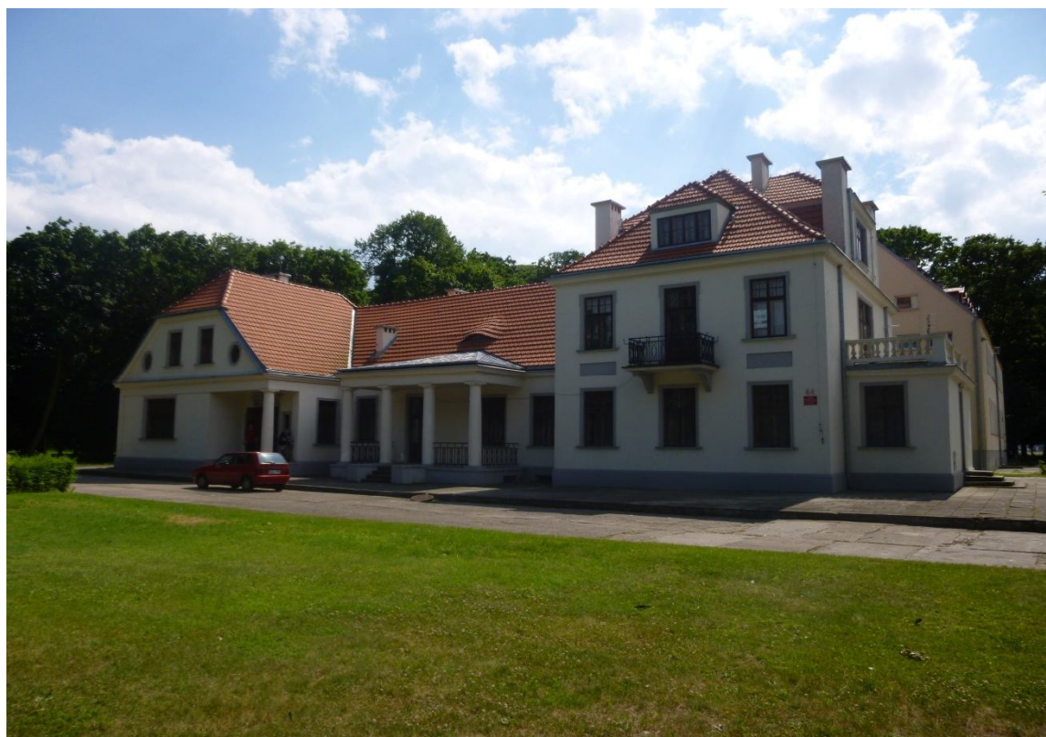
Dwór w Lubieniu Kujawskim