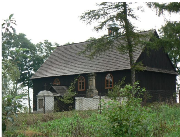
Kaplica w Pustyni