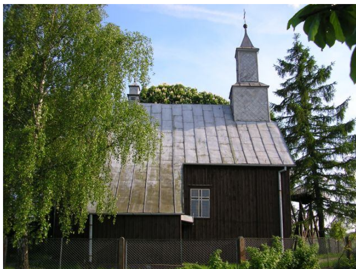
Kaplica w Czarmaninku