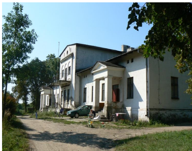
Dwór w Mchówku