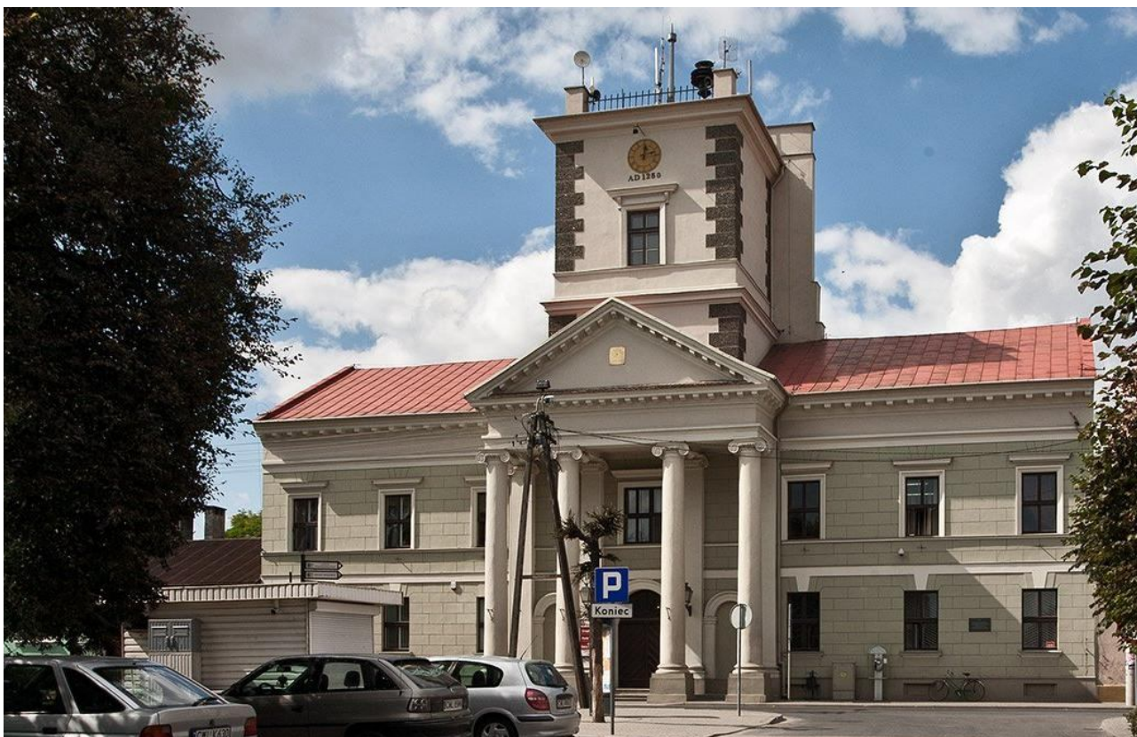
Ratusz w Brześciu Kujawskim