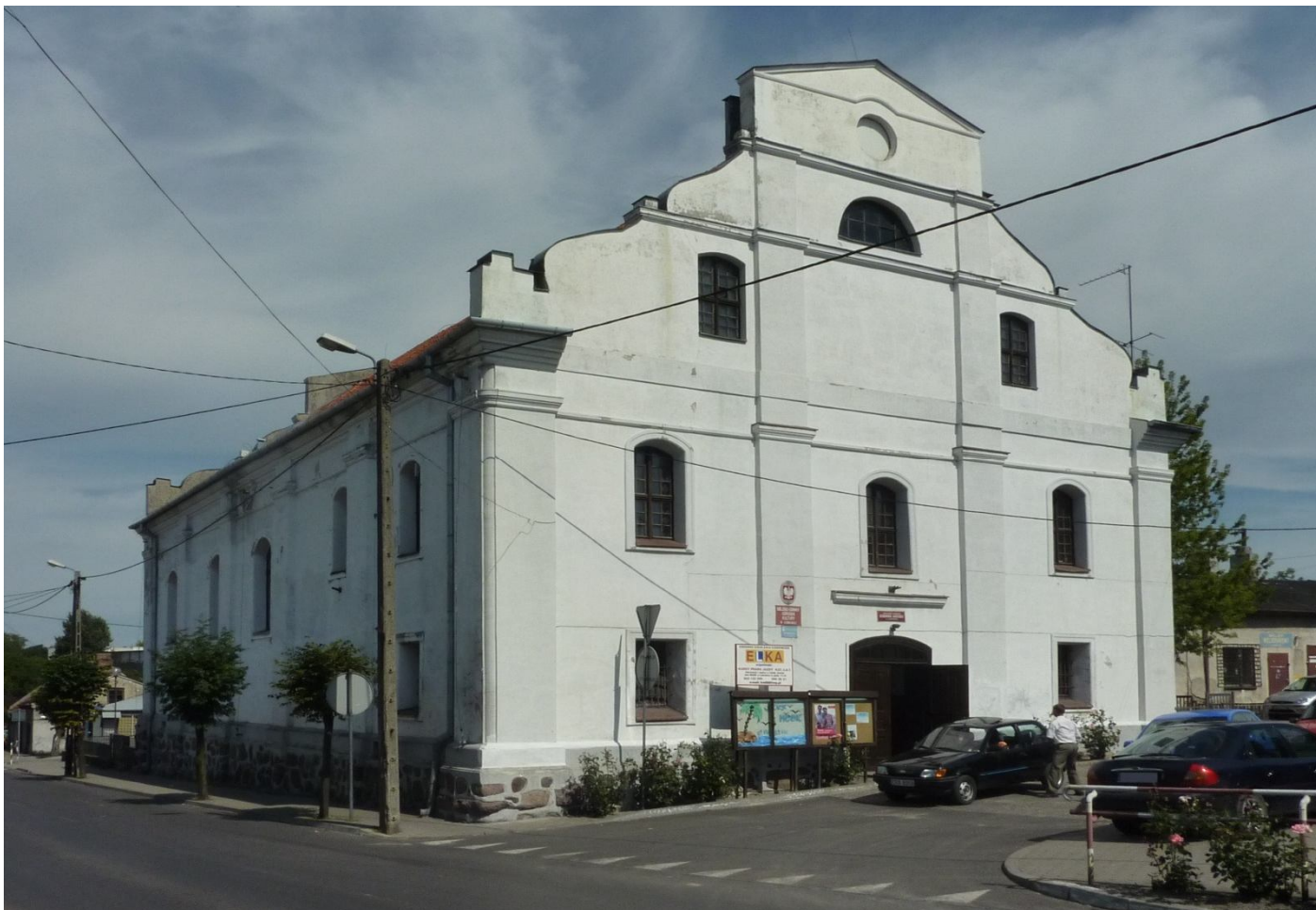
Synagoga w Lubrańcu