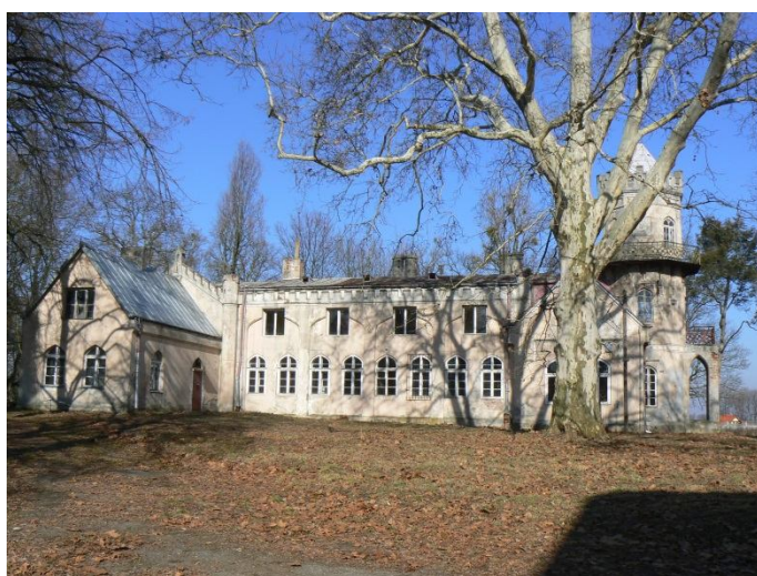
Pałac w Wieńcu