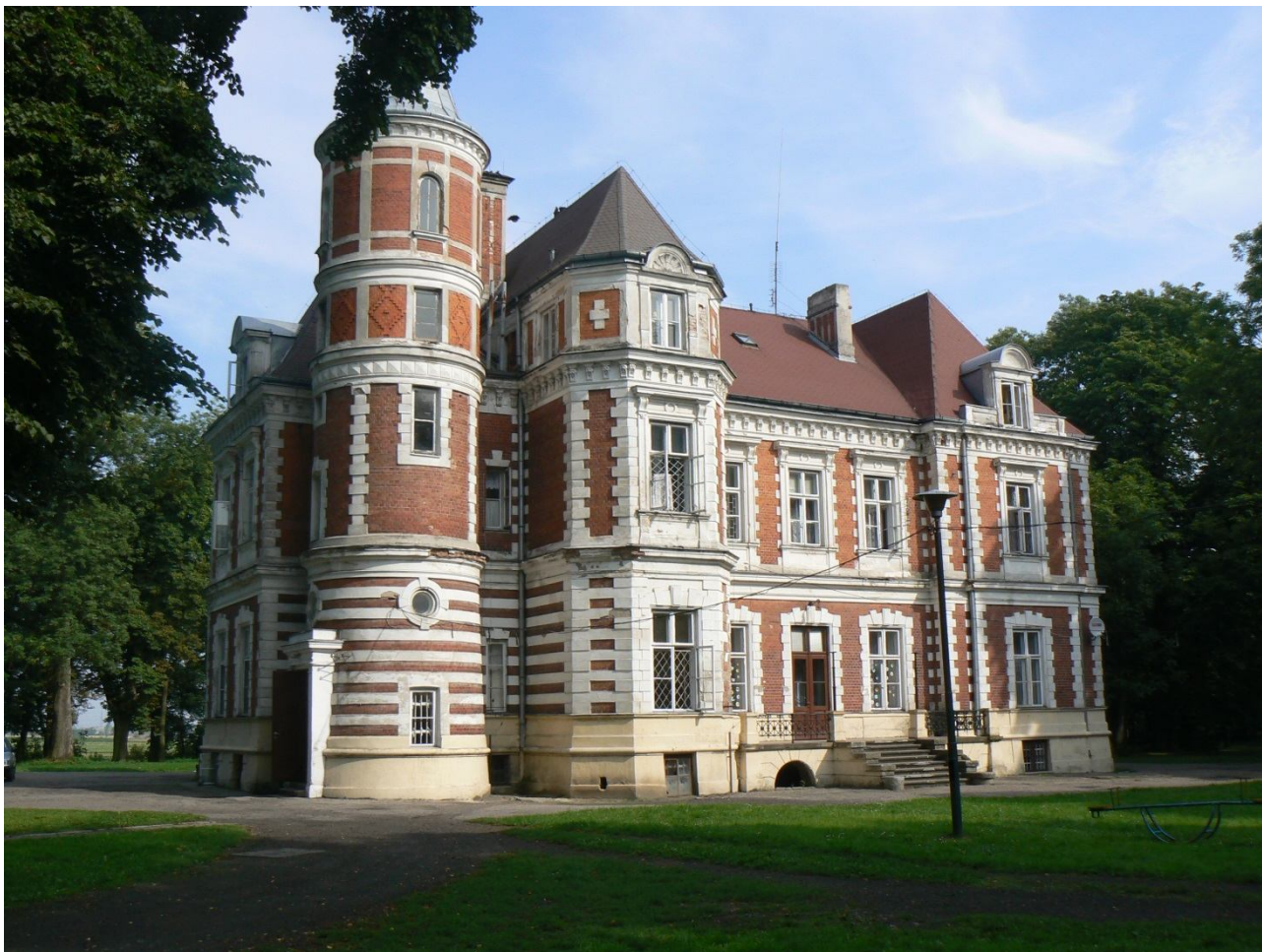
Pałac w Brzeziu