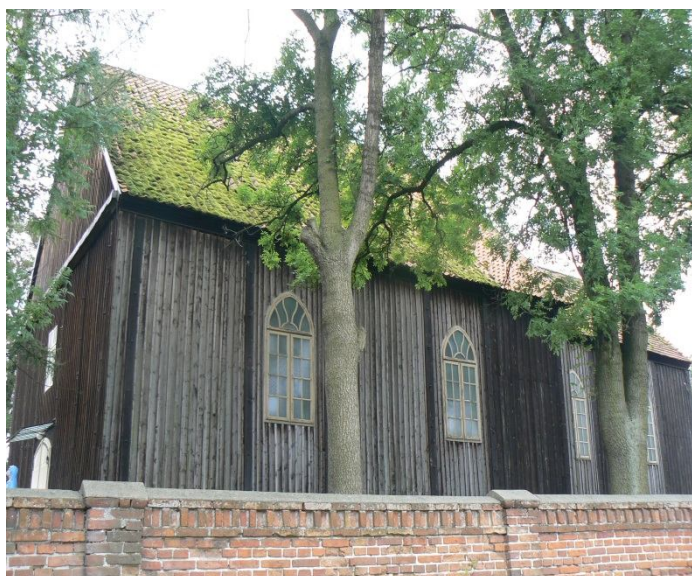
Kościół p.w. Św. Trójcy w Dąbiu Kujawskim