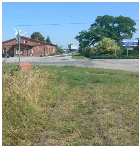
Pozostałości kolejki wąskotorowej w Boniewie