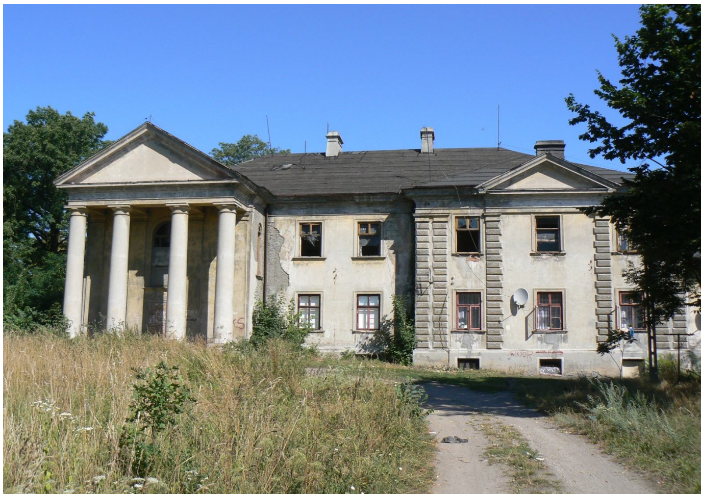
Pałac w Falborzu