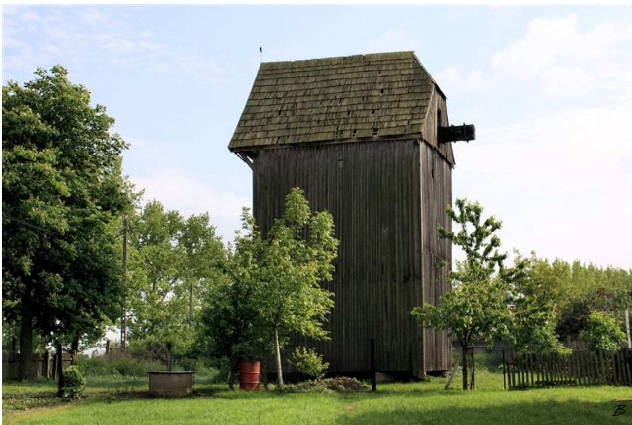
Wiatrak typu "Kozłak" w Chodczu