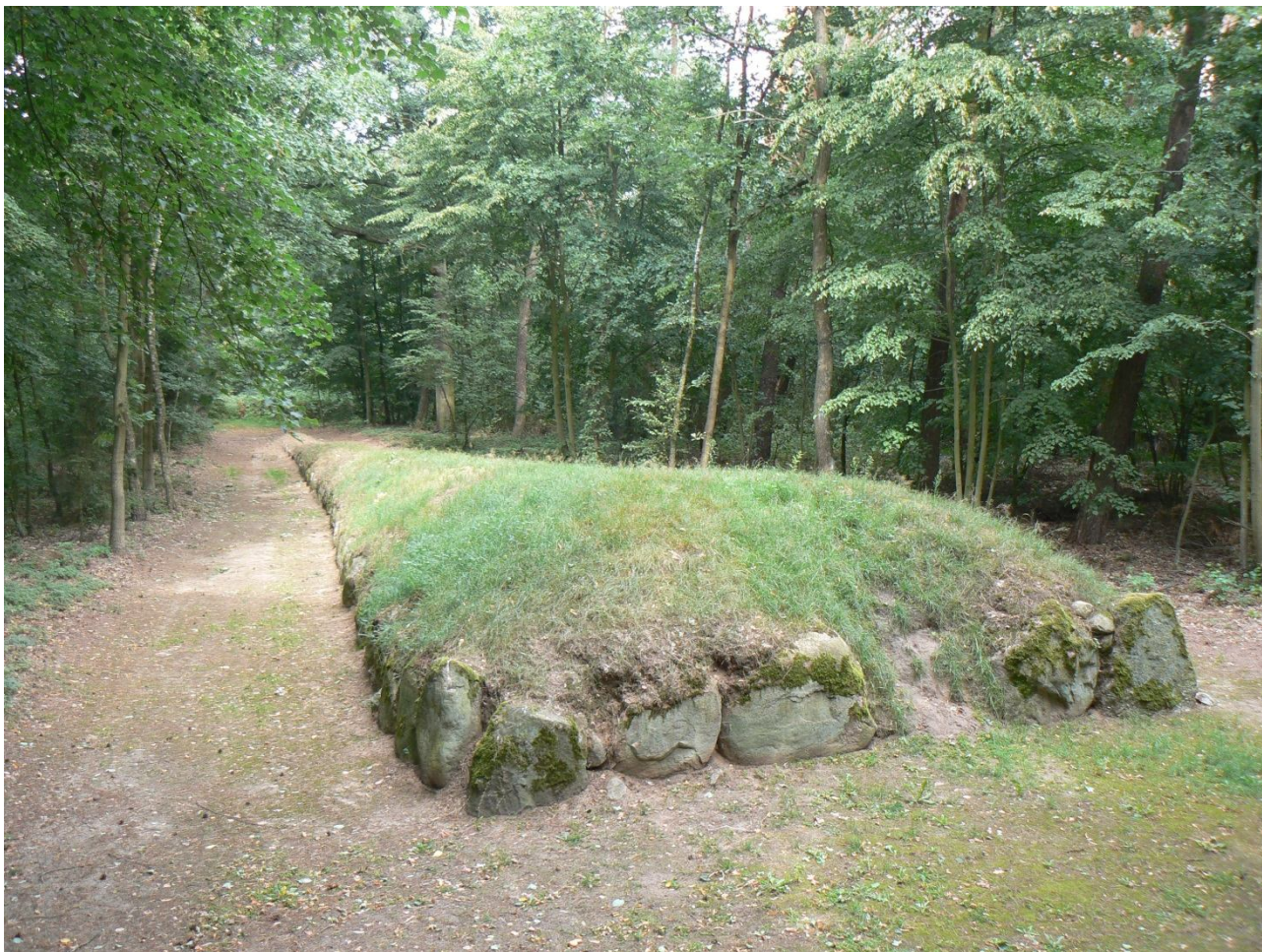
Grobowiec neolityczny w Wietrzychowicach