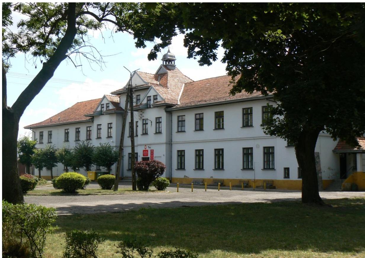
Szkoła rolnicza w Starym Brześciu