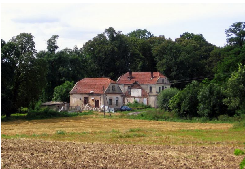
Dwór w Ossowie