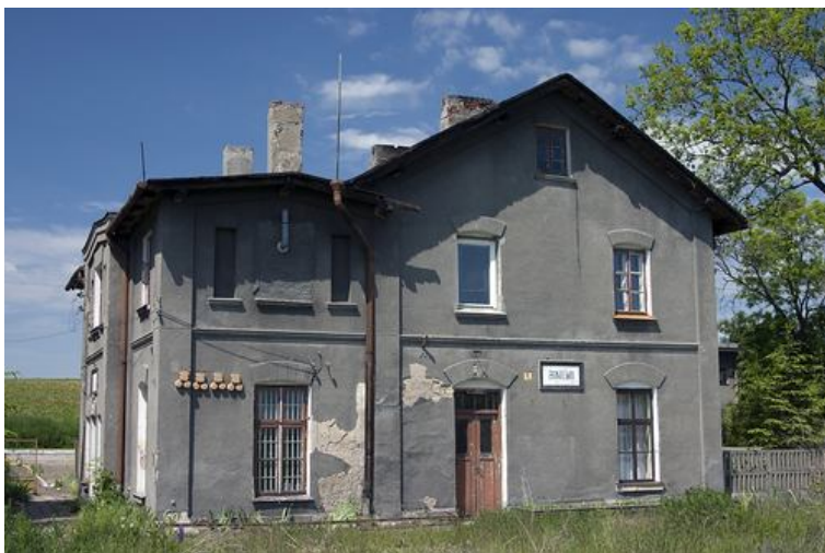
Stacja kolejki wąskotorowej w Boniewie