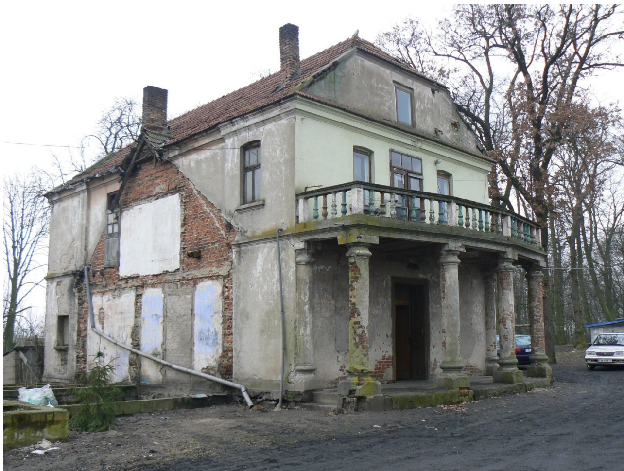
Dwór w Ossowie