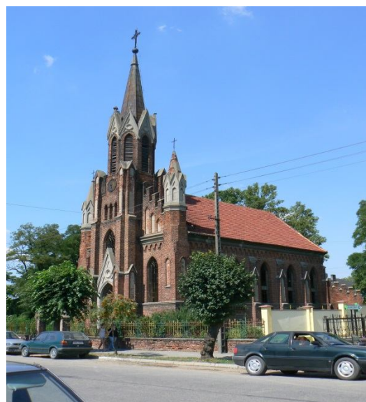
Kościół ewangelicki w Izbicy Kujawskiej