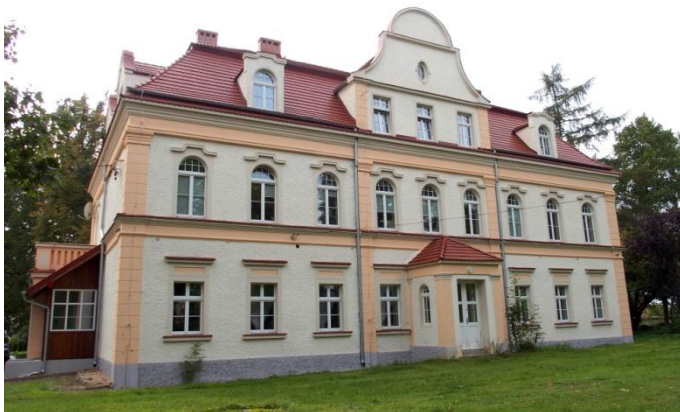
Zdjęcie nr 4. Pałac, nr 1, Bogdańczowice

Zespół usytuowany jest przy drodze Kluczbork - Gorzów Śl. Zachowała dawna siedziba właścicieli majątku Wuttendorrf, czyli dzisiejszych Bogdańczowic. Obiekt wzniesiony jest w stylu klasycystycznym, zbudowany na przełomie XIX i XX w. Aż do 1945 r. był własnością rodu von Kleinschmidt. Po 1945 r., w pałacu znajdowały się biura miejscowego PGR-u, natomiast w dawnym majątku dworskim Szkoła Rolnicza z Kluczborka urządziła edukacyjne gospodarstwo rolne. Pałac odgradzony ogrodzeniem z murowanymi słupkami.