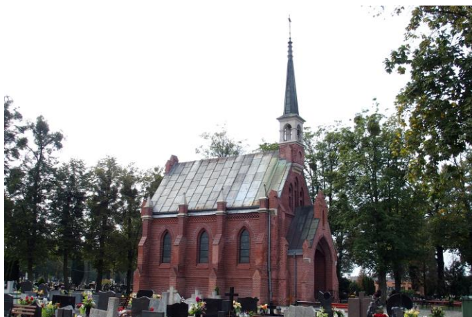
Zdjęcie nr 14. Kaplica cmentarna, ul. Opolska, Kluczbork