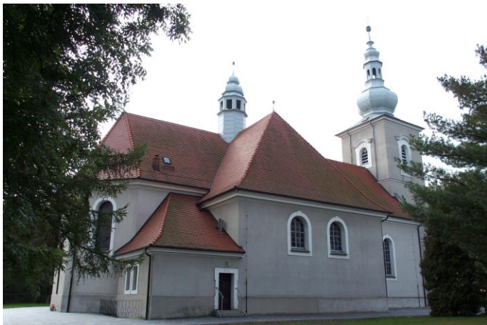
Zdjęcie nr 15. Kościół parafialny pw. św. Stanisława Biskupa i Męczennika, ul. XXX-lecia, Kujakowice Górne

Pierwsze wzmianki o kościele pochodzą z 1318 r. Był to kościół drewniany, który spłonął około 1490 r. Nowy, kamienny został zbudowany w 1494 r. Miał powierzchnię 100m 2 i drewnianą wieżę. W latach późniejszych kościół był wielokrotnie rozbudowywany i przebudowywany, najstarsze elementy jego konstrukcji liczą sobie ponad 500 lat. Tyle samo ma także najstarszy z kościelnych dzwonów. W 1917 r. zostały zdjęte 2 dzwony z wieży kościelnej i przetopione na łuski amunicji w I wojnie światowej. Po raz drugi w 1942 r. zdjęte zostały 3 dzwony z wieży kościelnej. Dwóch dzwonów nie udało się uratować. Tym bardziej cenny jest zachowany dzwon noszący inskrypcję: O König der Glorie komme mit dem Frieden! Anno 1494.