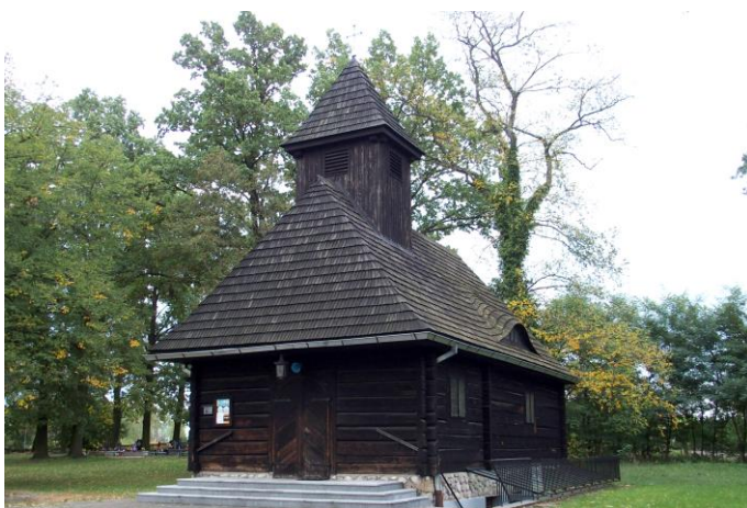
Zdjęcie nr 18. Kaplica cmentarna ewangelicka, ul. Gorzowska, Ligota Górna