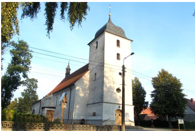
Zdjęcie nr 16. Kościół parafialny pw. św. Jana Chrzciciela, Kuniów

Pierwsza wzmianka o kościele parafialnym datowana jest na 1301 r. Kościół ten należał do Krzyżowców z czerwoną gwiazdą i był duszpastersko przez nich obsługiwany aż do czasów sekularyzacji, czyli do 1810 r. Miał wymiary 15 m x 7,5 m, posiadał przybudowaną drewnianą wieżę na dzwony, a na dachu kościoła znajdowała się wieżyczka na sygnaturkę. Kościół został zburzony, a na jego miejscu postawiono w latach 1799 - 1801 nowy, masywny i murowany. W 1818 r. wybudowano plebanię, użytkowaną do dnia dzisiejszego. W 1932 r. kościół został rozbudowany. Poświęcenie wyremontowanego kościoła nastąpiło 23 maja 1932 r. W grudniu 1934 r. zostały zamontowane nowe organy, w 1935 r. został ozdobiony prospekt organowy. Następny gruntowny remont kościoła, wraz z jego malowaniem, odnowieniem ołtarzy, gruntownym remontem organów został przeprowadzony w latach 1993 - 1995. Całkowicie wymieniono wtedy dachówkę na dachu kościoła, założono miedziane rynny, opierzenia a wieżę i wieżyczkę pokryto blachą miedzianą.