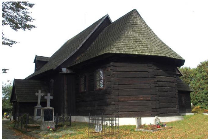
Zdjęcie nr 20. Kościół ewangelicki, nr 35, Maciejów