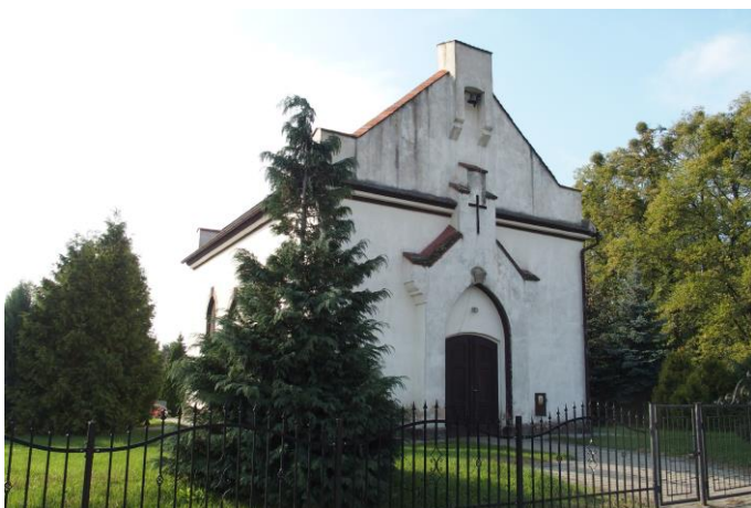
Zdjęcie nr 17. Kaplica cmentarna, ul. Wołczyńska 69, Ligota Dolna