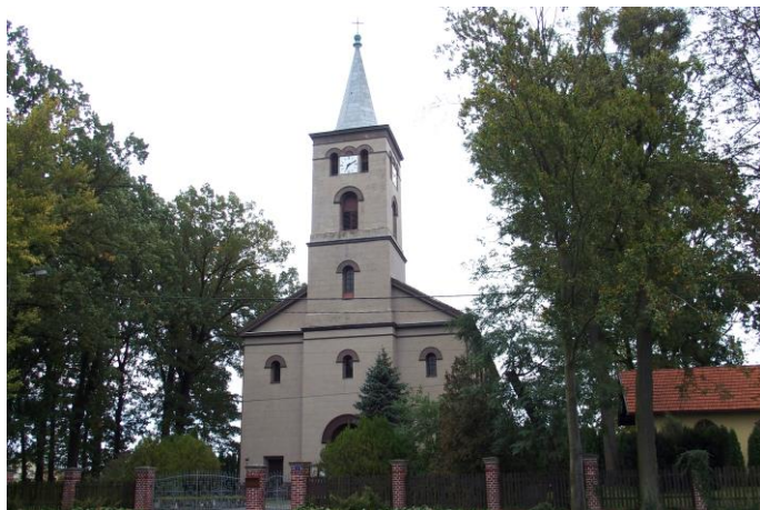
Zdjęcie nr 10. Kościół filialny pw. Świętego Józefa Robotnika, ul. Kozłowska 1, Biadacz

Pierwsza wzmianka o kościele datowana jest na 1541 r. Był to wówczas kościół drewniany, który przetrwał do 1840 r. W 1842 r. staraniem miejscowej ludności, rozpoczęła się budowa nowej, murowanej świątyni. W 1843 r. zakończono budowę kościoła, który początkowo był katolicki, później zaś (do 1945 r.) ewangelicki. Po zakończeniu II wojny światowej wrócił w ręce katolickie. W 2001 r. przeprowadzono remont elewacji całego kościoła.