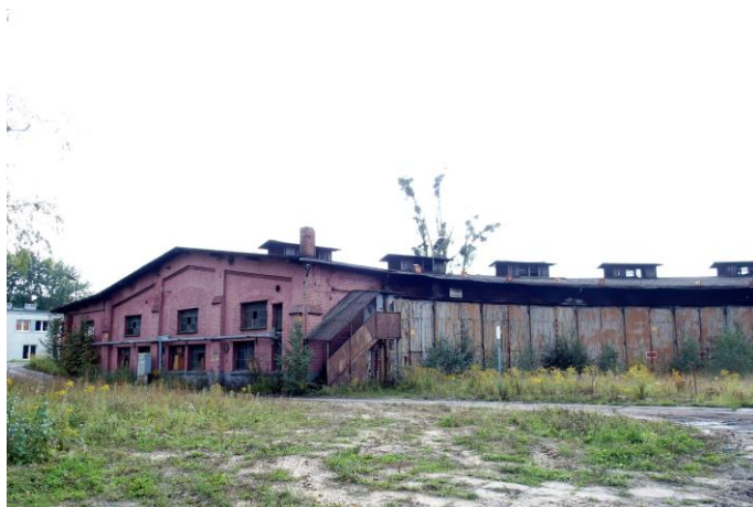
Zdjęcie nr 34. Budynek lokomotywowni wachlarzowej, ul. Sikorskiego, Kluczbork

Z licznych na terenie miasta budynków poprzemysłowych oraz związanych z kolejnictwem warto wymienić budynek parowozowni z warsztatami przy Alei Kolejowej oraz wpisane do rejestru zabytków - dziewiętnastowieczny budynek lokomotywowni wachlarzowej wraz z obrotnicą w zespole stacji kolejowej przy ul. Sikorskiego i budynek administracyjny młyna handlowego z 1907 r. przy ul. Młyńskiej 8.