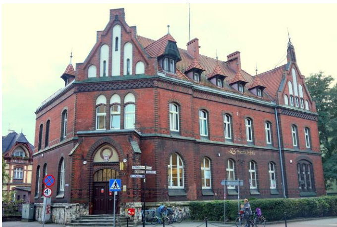
Zdjęcie nr 31. Poczta, ul. Mickiewicza 6, Kluczbork

Długą tradycję posiada poczta w Kluczborku, której neogotycki budynek znajduje się przy ul. Mickiewicza 6.