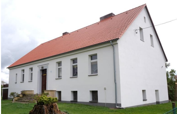
Zdjęcie nr 2. Dwór w zespole, Plac Targowy 5, Bogacica

Budynek dworu został wmurowany na planie prostokąta. Jest on parterowy, z wysokimi piwnicami, nakryty dachem dwuspadowym. Fasada siedmioosiowa z centralnie umieszczonym wejściem z kamiennym obramieniem. W wyniku remontów i przebudów w XX w. elewacje pozbawiono cech stylowych, zachowany został układ wnętrz - dwutraktowy, z sienią na osi. Przy dworze znajdują się zabudowania dawnego folwarku.