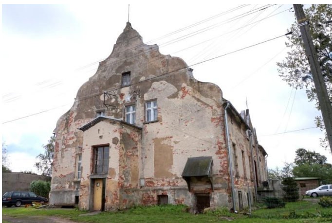
Zdjęcie nr 7, Pałac, ul. Mostowa 3, Smardy Górne