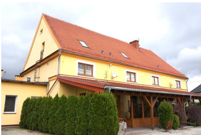
Zdjęcie nr 3. Spichlerz w dawnym zespole folwarcznym, Plac Targowy 2a, Bogacica

Spichlerz wzniesiono w 1 poł. XIX w. Murowany z cegły, otynkowany, prostokątny, dwukondygnacyjny, podpiwniczony, nakryty dachem siodłowym. W ostatnich latach został zmodernizowany podczas adaptacji do funkcji usługowo - mieszkalnych. Między innymi z powodu znacznego powiększenia otworów okiennych, dodania balkonu na elewacji szczytowej oraz daszku