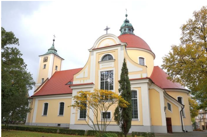
Zdjęcie nr 11. Kościół parafialny pw. św. Trójcy, ul. Wolności, Bogacica