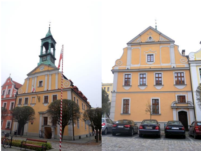
Zdjęcia nr 23, 24. Ratusz, ul. Rynek 1, Kluczbork

Obecnie budynek jest siedzibą kilku instytucji, między innymi Urzędu Stanu Cywilnego.