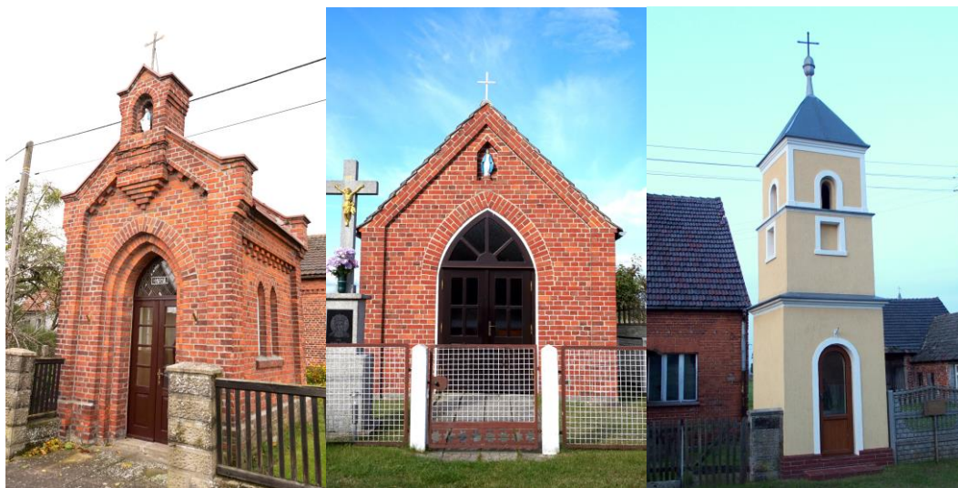
Zdjęcia nr 36, 37, 38. Kapliczka, ul. Wiejska przy 16, kapliczka; kapliczka, Bogacka Szklarnia przy nr 24; kapliczka, ul. Wiejska przy nr 21, Borkowice

Kapliczki przybierają też formę słupową. Częstym elementem pejzażu wiejskiego są kamienne lub drewniane krzyże, często w sąsiedztwie kaplic, czasem usytuowane samodzielnie.