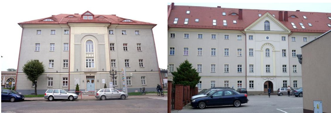
Zdjęcia nr 27, 28. Dawny zakład dla ubogich, ul. Zamkowa 6-Podwale 4a- 4b, Kluczbork

Charakterystycznym dla Kluczborka obiektem jest dawny zakład dla ubogich , przy ul. Zamkowej 6-Podwale 4a-4b, obecnie budynek mieszkalno - usługowy. Wybudowany w 1778 r. w projekcie Karola Gottharda Langhansa. Na miejsce budowy wybrano wówczas plac, na którym wcześniej stał spalony w 1736/1737 r., budynek Komandorii krzyżowców z czerwoną gwiazdą. 23 maja 1779 r. otwarto krajowy Zakład dla Ubogich - mogący pomieścić 500 biednych, inwalidów wojennych, bezdomnych i żebraków. Od 1804 r. czynny był szpital. Po pożarze głównego budynku w 1819 r., zakład został odbudowany z pewnymi zmianami i uproszczeniami architektonicznymi w latach 1820 - 1823. Przejęty następnie przez prowincję śląską, w 1874 r. został przekształcony w szpital dla umysłowo chorych, który był czynny do likwidacji przez władze hitlerowskie w 1936 r. 14 grudnia 1939 r. utworzono tu pierwszy na terenie śląskiego okręgu wojskowego jeniecki obóz oficerski pod nazwą Oflag VIII A Kreuzburg, a wiosną 1943 r. - obóz dla internowanych obywateli państw wrogich III Rzeszy, tzw. Ilag VIII/Z. Kilka razy przebudowywany, po wojnie internat, magazyn.