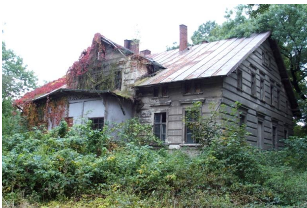
Zdjęcie nr 8. Dwór, nr 2-4, Wrzosey

Dawny zespół dworsko - folwarczny położony jest w przysiółku Wrzosey. Dwór, który obecnie jest w ruinie usytuowany jest w zachodniej części zespołu, otoczony parkiem.