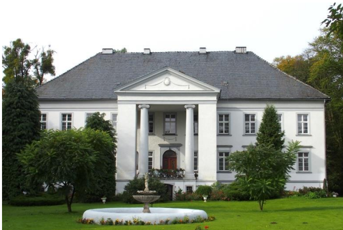
Zdjęcie nr 5, Pałac, nr 43, Maciejów

Pałac wzniesiony w ok. 1790 r. w stylu klasycystycznym, obecnie stanowi własność prywatną. Zaprojektowany przez Carla Gottharda Langhans (twórca Bramy Brandenburskiej). Zwrócony frontem na północny - wschód. Murowany z cegieł, otynkowany, piętrowy i wysoko podpiwniczony. Wzniesiony na rzucie prostokąta z wysuniętym portykiem i podjazdem na osi elewacji frontowej. Nad wejściem do piwnic podjazd i portyk o dwóch kolumnach jońskich, połączonych ażurową balustradą żelazną. Po bokach wysokie arkady, półkoliście zamknięte. Wejście również zamknięte półkoliście, nad nim feston stiukowy. Okna posiadają proste obramowania, a w przyziemiu gzymsiki wsparte na wolutach. Od strony parku elewacja z zaakcentowaną częścią środkową, zwieńczona trójkątnym, spłaszczonym przyczółkiem. W elewacjach bocznych dekoracja stiukowa festonami. Czterospadowy dach, kryty dachówką.