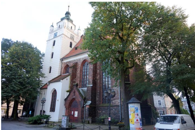
Zdjęcie nr 12. Kościół ewangelicki pw. Chrystusa Zbawiciela, Plac Gdacjusza, Kluczbork

Gotycki kościół został zbudowany w XIV w. na miejscu poprzedniego, pochodzącego z 1298 r. Wybudowana wówczas świątynia składała się z XIII-wiecznego prezbiterium (wykonana we wczesnogotyckim stylu) oraz z XIV-wiecznej wieży. W wyniku częstych pożarów kościół był