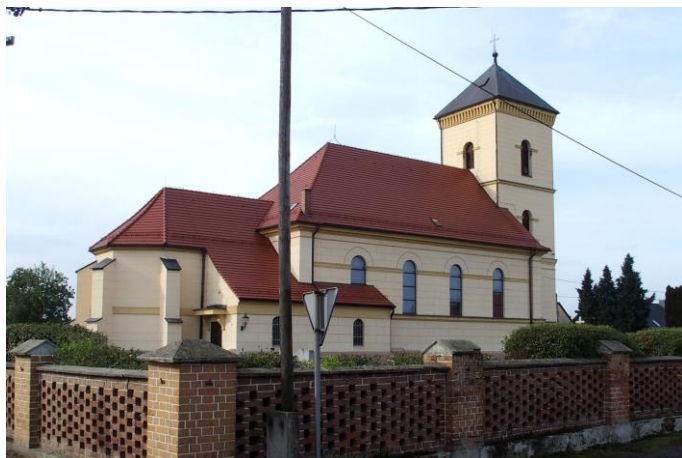
Zdjęcie nr 19. Kościół parafialny pw. Nawiedzenia MB, ul. Księdza Rigola, Łowkowice

Pierwsze informacje o parafii pochodzą z 1253 r., którą założyli Krzyżowcy z Czerwona Gwiazdą z Wrocławia. Oni też prowadzili parafię i duszpasterstwo do 1810 r. W czasie przemian reformacyjnych, parafia w Łowkowicach należała do katolików.