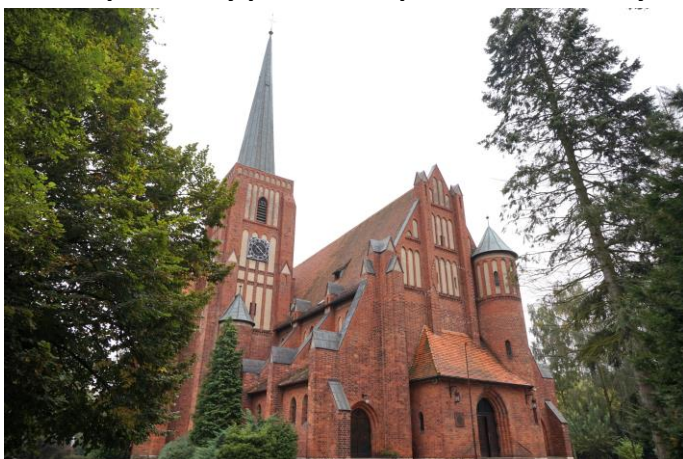
Zdjęcie nr 13. Kościół parafialny pw. MB Wspomożenia Wiernych, ul. Skłodowskiej - Curie, Kluczbork

Najstarszą świątynią w historii Kluczborka był zbudowany w średniowieczu drewniany kościółek pw. św. Trójcy. Zbudowano go poza murami miasta na tzw. Przedmieściu Polskim. W 1558 r. został przejęty przez protestantów, a w 1708 r. wrócił w ręce katolików.