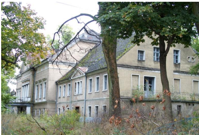
Zdjęcie nr 1. Pałac, ul. Braci Bassy 18-20-22, Bąków

Pałac w Bąkowie wybudowany w 1 poł. XIX w., częściowo zmodernizowany. Środkowe skrzydło z niewielkim ryzalitem poprzedzonym kolumnowym portykiem i zwieńczonym trójkątnym naczółkiem. Skrzydła boczne parterowe, siedmioosiowe. Wnętrze głównego skrzydła zmodernizowane, w skrzydłach bocznych zachowany detal architektoniczny. Na tyłach pałacu rozciąga się rozległy park krajobrazowy z XIX w., ukształtowany w stylu angielskim. Zespół tworzy także rozległy folwark, w skład którego wchodzi m.in. budynki gorzelnia, suszarnia lnu, stodoły, spichlerz, obory, domy mieszkalne dla zarządcy, pracowników folwarcznych. Pałac wymaga