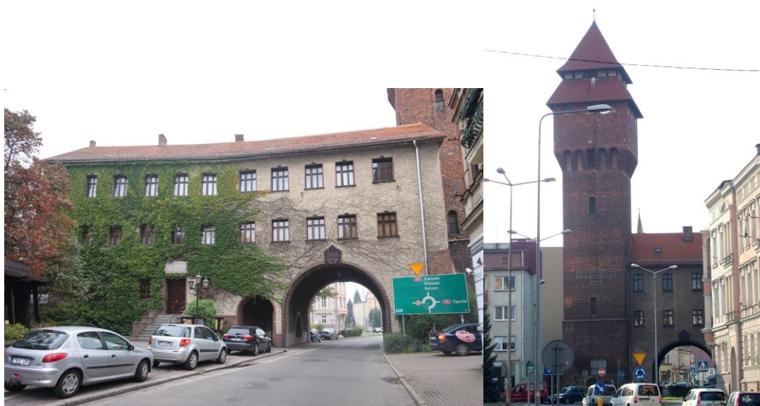
Zdjęcia nr 21, 22. Muzeum im. Jana Dzierżona i wieża baszta bramna, ul Zamkowa 10