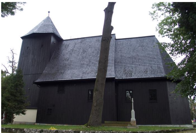
Zdjęcie nr 9. Kościół parafialny pw. Wniebowzięcia NMP, ul. Braci Bassy, Bąków