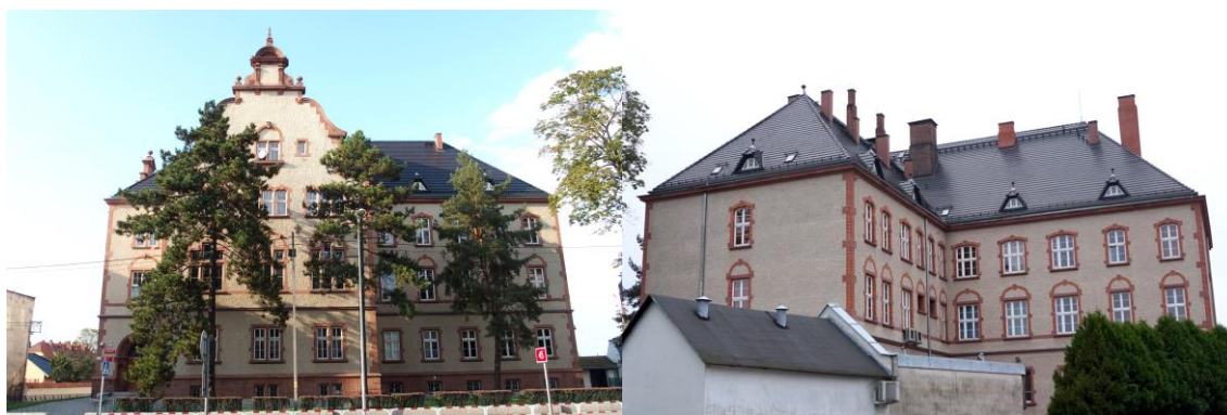
Zdjęcia nr 32, 33. Sąd Rejonowy, ul. Katowicka 2, Kluczbork

Z historią miasta związana jest szkoła miejska im. Gustawa Freytaga, ob. zespół szkół ogólnokształcących , przy ul. Mickiewicza 10 w Kluczborku.