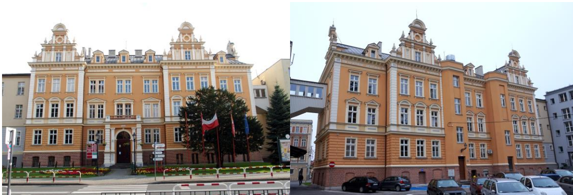
Zdjęcia nr 29, 30. Budynek Starostwa Powiatowego i Urzędu Miejskiego, ul. Katowicka 1, Kluczbork

tylną - analogiczne szczyty, rozdzielone dwoma wielobocznymi ryzalitami mieszczącymi klatki schodowe. Dekoracja elewacji architektoniczna - okna ujęte naczótkami, gzymsami i pilasterkami, narożniki budynku akcentowane pionowymi pasami boniowania, całość zwieńczona wydatnym gzymsem koronującym. Częściowo zachowana drewniana stolarka.