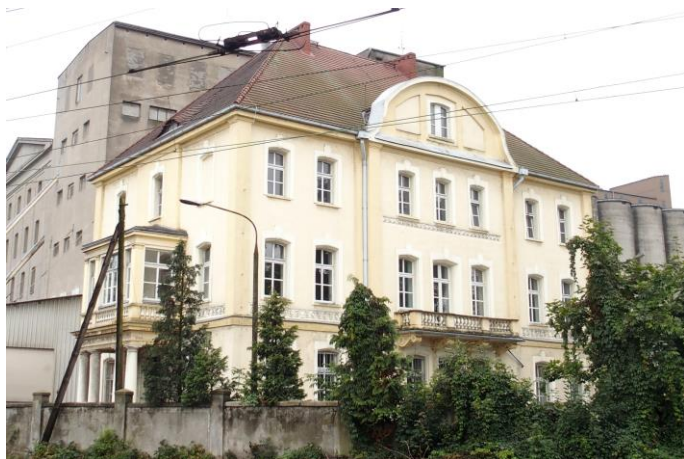
Zdjęcie nr 35. Budynek administracyjny w zespole młyna, ul. Młyńska 8, Kluczbork

ujęte opaskami z kluczem. Wejścia do budynku usytuowano na krótszych bokach; wejście główne na ścianie wsch., zaś boczne na elewacji zachodniej. Elewacja frontowa (wsch.) jest trójosiowa z umieszczonym pośrodku okazałym portykiem wspartym na czterech kolumnach o toskańskich głowicach. Nad portykiem znajduje się podzielony pilastrami ryzalit z oknami o licznych podziałach oraz partią podokienną ozdobioną tralkami. Elewacja pn. jest siedmioosiowa. Jej środkowa, trójosiowa część jest delikatnie zryzalitowana, zwieńczona szczytem o linii falistej i ze skromnym barokowym wystrojem. Osiowość elewacji została dodatkowo podkreślona przez balkon z tralkową balustradą, oparty na wydatnych, wolutowych wspornikach 8 .