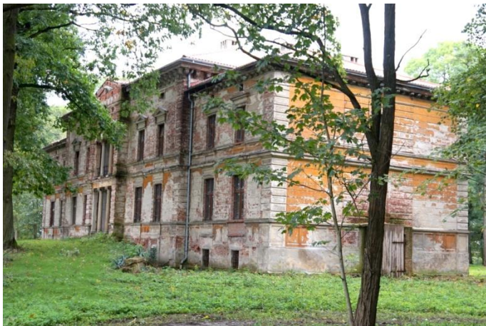
Zdjęcie nr 6. Pałac, ul. Polna 9, Smardy Dolne

Pałac powstał w XIX w. Neoklasycystyczny, murowany z cegły, tynkowany, wzniesiony na planie prostokąta, podpiwniczony, dwukondygnacyjny, nakryty dachami o niewielkim spadku. Pałac składa się z wyższej części środkowej i dwóch niższych skrzydeł po bokach. Dziewięćosiowa fasada z centralnym ryzalitem, portykiem i loggią na piętrze, zwieńczona jest trójkątnym naczółkiem. Elewacje zdobione boniowaniem. Układ wnętrz dwutraktowy z sienią na osi oraz salą balową oraz salą bankietową na parterze. Do pałacu przylega park krajobrazowy o powierzchni 5,5 ha z licznie zachowanym starodrzewiem, przy budynku znajduje się staw obsadzony dębami.