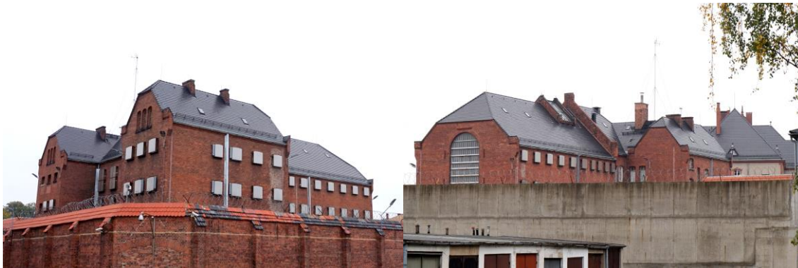
Zdjęcia nr 25, 26. Więzienie, ul. Katowicka 4, Kluczbork

ryzalitem 3-osiowym. Elewacja wschodnia jest w formie podobna do elewacji zachodniej lecz zamknięta ryzalitem 4-osiowym. Elewacja północna (szczytowa) jest symetryczna, 1-osiowa 7 .