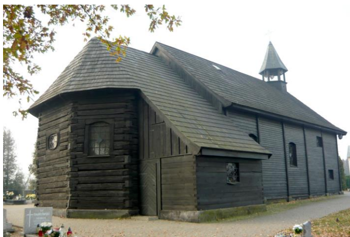
Zdjęcie nr 4. Kościół, obecnie cmentarny, pw. św. Andrzeja w Popielowie, ul. Dworcowa

W 1292 r. wymieniany był kapłan w Popielowie. Do końca wojny trzydziestoletniej wieś stanowiła osobną parafię pw. św. Jana Chrzciciela i św. Andrzeja, następnie znajdująca się tu świątynia stała się filią parafii w Siołkowicach. Kościół wzniesiono prawdopodobnie już w średniowieczu. W 1654 r. wzniesiono nową, drewnianą świątynię, którą wyposażono w bogaty barokowy wystrój. Rozwój wsi sprawił, że w 1883 r. utworzono w Popielowie osobną parafię. W 1884 r. cieśla Frach ze Starych Kolni rozebrał drewniany kościół i przeniósł go na cmentarz przy ul. Dworcowej. W 1887 r. przystąpiono do budowy nowej świątyni w stylu neogotyckim, którą