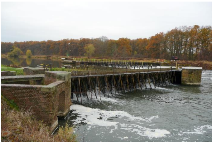
Zdjęcie nr 18. Jaz kozłowo - iglicowy, ul. Odrzańska, dz. nr 510/6, Rybna

Stopień wody Ujście Nysy do Odry w Rybnej, został zbudowany w latach 1892 - 1896, w ramach realizowanego programu modernizacji Odry. Był jednym z trzynastu tego typu obiektów na Odrze. Obejmuje on między innymi jaz kozłowo - iglicowy systemu Poirée, początkowo z małą śluzą