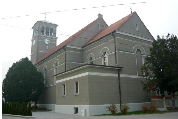
Zdjęcie nr 6. Kościół parafialny pw. św. Michała Archanioła, ul. Michała, Stare Siołkowice

Kościół zbudowany został w 1830 r., jako trzecia świątynia w tym miejscu, dwa poprzednie kościoły spłonęły. W 1933 r. kościół został rozbudowany, między innymi dobudowano po obu stronach prezbiterium zakrystie, w kolejnych latach został powiększony, podwyższono wieżę i zbudowano nowe prezbiterium. Przed przebudową kościoła pomnik z I wojny światowej z kapliczką św. Michała nie był przy ścianie kościoła, tylko był wolnostojący na granicy działki. W 2011 r. rozpoczęto prace zmierzające do odtworzenia oryginalnego wystroju kościoła. Kościół zachował oryginalną bryłę i formę, a także historyczną dyspozycję wnętrza.