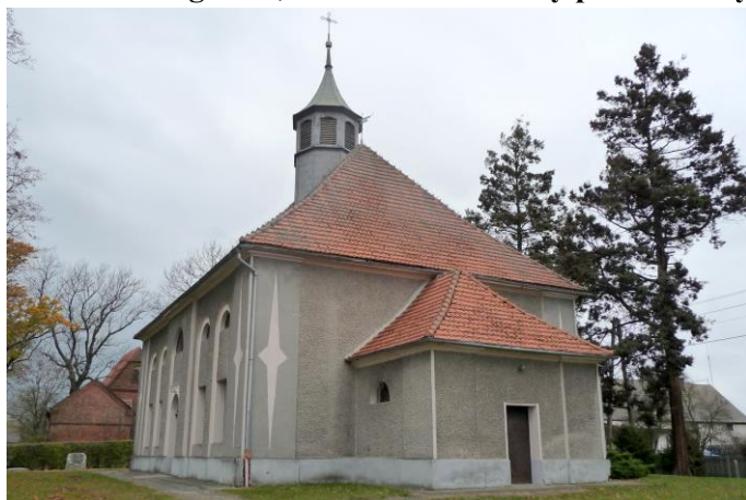
Zdjęcie nr 2. Kościół ewangelicki, ob. katolicki filialny pw. św. Judy Tadeusza w Kurzniach, ul. Mickiewicza

Wzniesiony w 1813 r. jako zbór ewangelicki. Klasycystyczny, remontowany w 1885 r. W latach 60-tych XX w. założono na elewacjach istniejący tynk cyklinowany oraz wykonano malarski wystrój wnętrza. Usytuowany w centrum wsi, po płd. stronie ul. Mickiewicza.