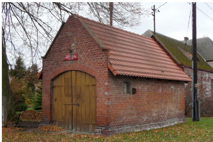
Zdjęcie nr 21. Remiza strażacka, ul. Wiejska, dz. nr 443, Lubienia

W każdej wsi na terenie gminy powstała kiedyś remiza strażacka - czyli budynek na pomieszczenie wozu strażackiego i innego sprzętu przeciwpożarowego. Największy zespół zabudowań tego rodzaju powstał w Starych Siolkowicach - zlokalizowany w centrum wsi, który utracił walory zabytkowe. Najefektowniej przedstawia się remiza w Popielowie. Usytuowana jest w centrum wsi, w pobliżu kościoła. Jest ona większa od innych, posiada drewnianą, kwadratową wieżę. W pozostałych wsiach są to jednoprzestrzenne budyneczki przykryte dachem dwuspadowym, z wrotami w ścianie szczytowej. Taką formę mają remizy w Stobrawie, Lubieni i Popielowskiej Kolonii. Remiza w Lubieni znajduje się w złym stanie technicznym.