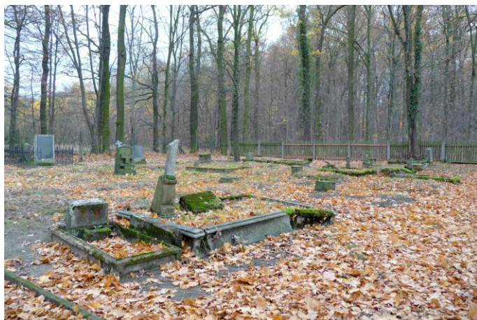
Zdjęcie nr 12. Cmentarz ewangelicki, ul. Odrzańska, Popielowska Kolonia