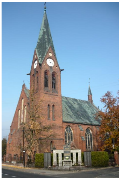
Zdjęcie nr 5. Kościół parafialny pw. Najświętszej Marii Panny Królowej Aniołów, ul. Kościuszki, Popielów

Kościół usytuowany jest w centrum wsi, po wsch. stronie ul. Kościuszki, na prostokątnej parceli, ograniczonej od frontu, który pochodzi z czasu budowy kościoła, ażurowym ogrodzeniem rozpiętym między murowanymi z cegły słupkami.