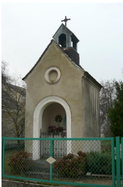
Zdjęcie nr 11. Kapliczka, ul. Powolnego 11, Popielów