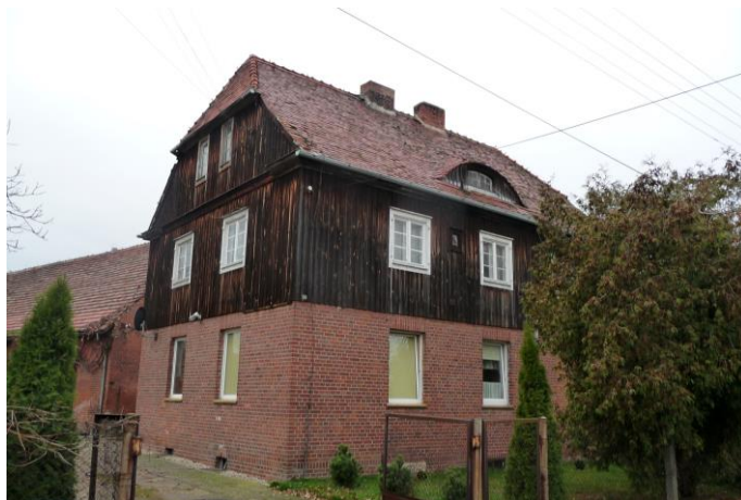
Zdjęcie nr 22. Dawna leśniczówka, ul. Kani 17, Stobrawa