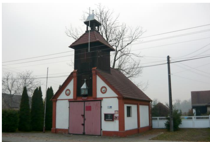
Zdjęcie nr 20. Remiza strażacka, ul. Kościuszki 17, Popielów