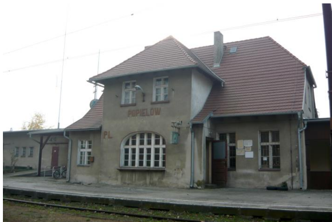
Zdjęcie nr 19. Budynek stacji PKP, ul. Dworcowa 69, Popielów

Na początku XX w. poprowadzono prawobrzeżną nitkę kolejową łączącą Wrocław z Opolem. Linia przebiega przez cztery wsie na terenie Gminy - Stare i Nowe Siołkowice, Popielów i Karłowice. Stacje powstały w Popielowie i Karłowicach. Towarzyszą im zabudowania związane z infrastrukturą kolejową oraz budynki mieszkalne dla osób zajmujących się jej obsługą - w większości wzniesiono je w 1 ćw. XX w. Stacja w Popielowie w formie nawiązuje do typowego budynku stacyjnego. Stacji towarzyszy szalec wzniesiony w konstrukcji szkieletowej oraz dwa domy kolejarzy. Do jej zespołu można zaliczyć również budynek kolejowy położony już na terenie Starych Siołkowic (Kłapacz 131) oraz towarzyszącą mu nastawnię. Budynek stacji w Karłowicach był utrzymany w podobnym stylu. Został zniszczony w 1945 r. W jego sąsiedztwie zachowała się natomiast kolonia trzech domków kolejarskich z 1 ćw. XX w. W zespole stacji, po drugiej stronie torów kolejowych stoi zabytkowa wieża ciśnieniowa i towarzysząca jej trafostacja. Na terenie Karłowic znajduje się ponadto nastawnia kolejowa przy ul. Brzeskiej oraz dwa domy dróżnika - jeden stojący w połowie drogi do Kurzni, przy ul. Kolejowej 15, obecnie opuszczony, drugi przy drodze do d. przys. Olszak, za mostem. Stan zachowania obiektów jest średni.