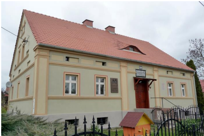
Zdjęcie nr 17. Dom Jana Dzierżona, ul. Kościelna 7, Karłowice

Zgodnie z inskrypcją umieszczoną w elewacji frontowej budynek zbudowany w 1864 r. Przez wiele lat zamieszkiwany przez ks. Jana Dzierżona, o czym informują tablice - niemiecka z 1925, a także późniejsze z 1956 r. i 2011 r. w języku polskim. Budynek usytuowany w centrum wsi, w pobliżu kościoła, po płn. stronie ul. Kościelnej. Murowany z cegły, obustronnie otynkowany, posyty dachówką karpiońską.