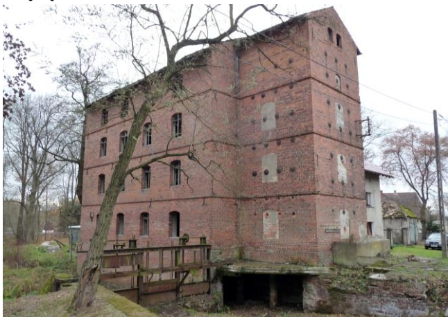
Zdjęcie nr 25. Dawny młyn, ul. Młyńska 9, Karłowice