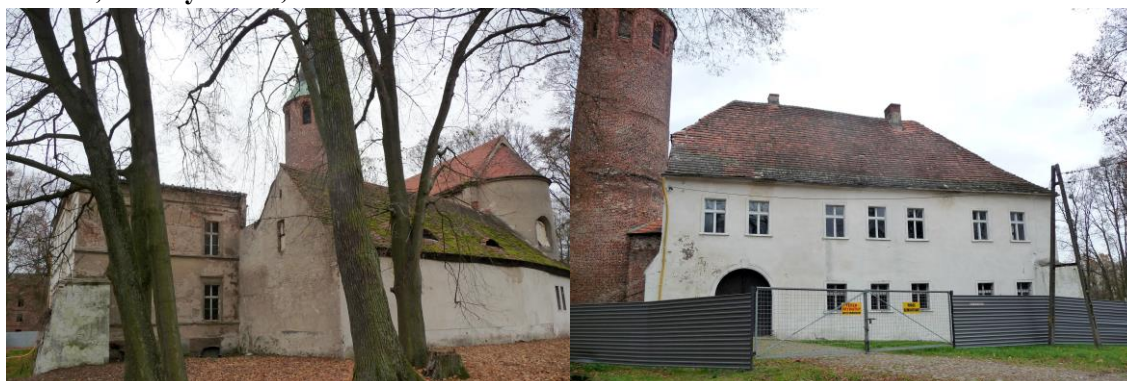
Zdjęcia nr 14, 15. Zamek, ul. Młyńska 7, Karłowice