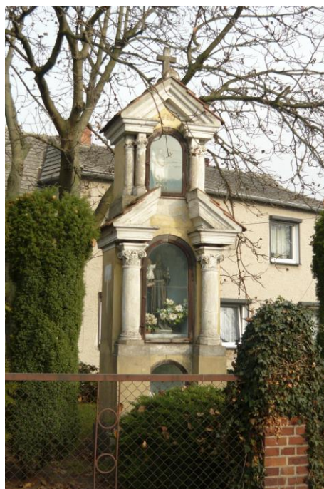
Zdjęcie nr 7. Kapliczka, ul. Wiejska 35, Nowe Siołkowice Zdjęcie nr 8. Kapliczka, ul. Opolska 7, Popielów

Najstarszą kapliczką słupową jest kapliczka usytuowana w Nowych Siołkowicach przy ul. Wiejskiej 35 pochodząca z 1 ćw. XIX w. - dwukondygnacyjna, o bryle prostopadłościennego słupa krytego dwuspadowym daszkiem, we wnętrzu figura św. Jana Nepomucena. Pod koniec XIX w. w Starych Siołkowicach upowszechnił się specyficzny typ kapliczki słupowej, której formę można uznać za rodzaj regionalizmu. Cechą tych kapliczek jest ekspozycja ceglano-budulca, styl neogotycki, układ dwukondygnacyjny oraz charakterystyczne symetryczne wcięcie (przewężenie) między kondygnacjami. Za najstarszy przykład tej formy można chyba uznać kapliczkę w Starych Siołkowicach przy rondzie, datowaną na 1890 r. We wnętrzu znajduje się drewniana figura św. Jana Nepomucena, o cechach późnobarokowych pierwowzorów. Najbardziej charakterystyczne kapliczki noszące wyżej opisane cechy powstawały około 1900 r. i na pocz. XX w., aż po około 1920 r.