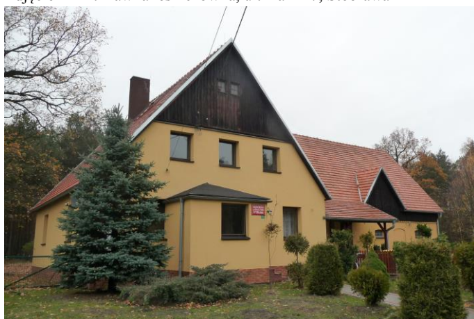
Zdjęcie nr 23. Leśniczówka, ul. Leśna 2, Stobrawa