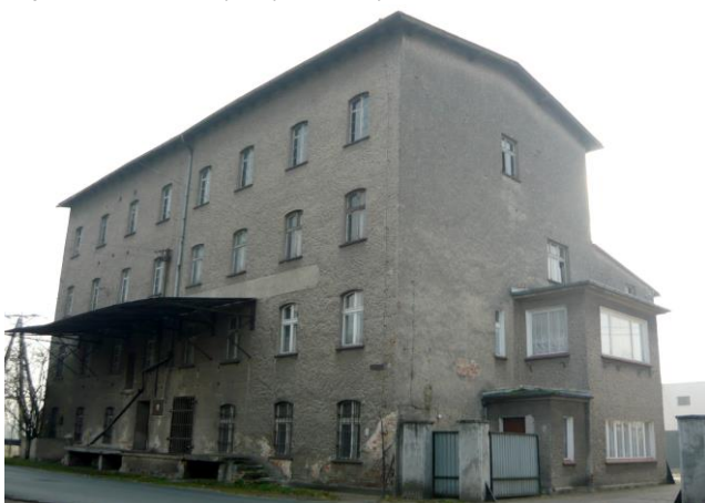
Zdjęcie nr 26. Dawny młyn, ul. Opolska 36, Popielów

Młynarstwo było jedną z najbardziej intratnych profesji. Dawniej młyny wodne funkcjonowały w Popielowie, Starych Siołkowicach, Karłowicach (przy zamku i na Olszaku), w Kuźnicy Katowskiej, w Starych Kolniach i Stobrawie. O istnieniu młynów w Popielowie, Siołkowicach wspominają dokumenty z XIV w. Do napędu młynów wykorzystywano nurty lokalnych rzek Brynicy i Stobrawy. Obiekty te funkcjonowały nieprzerwanie od średniowiecza, aż po czasy nam najbliższe. Były wielokrotnie przebudowywane, modernizowane, niszczone i budowane na nowo.