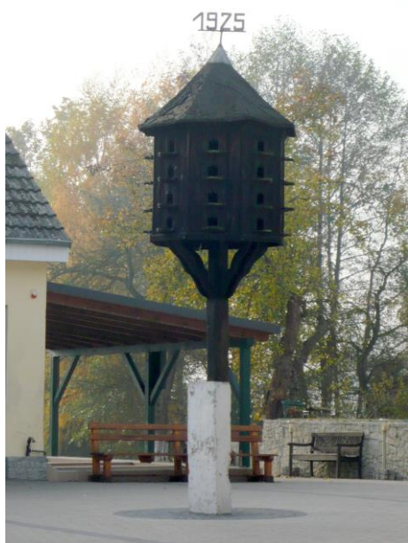
Zdjęcie nr 24. Gołębnik, ul. Opolska 3, Popielów

Te niewielkie obiekty gospodarcze dawniej znajdowały się niemal w każdej zagrodzie. Budowano je z drewna w formie niewielkiego „budyneczku” umieszczonego na wysokim słupie. Do dnia dzisiejszego zachowały się jedynie dwa gołębniki tego rodzaju, oba znajdują się w Popielowie: przy ul. Opolskiej 30 i Opolskiej 2, powstałe w 1925 r.