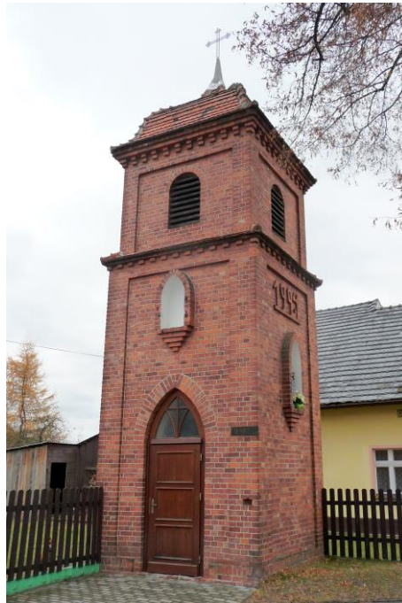
Zdjęcie nr 9. Kapliczka-dzwonnica, ul. Wiejska przy nr 36a, dz. nr 231/2, Nowe Siołkowice