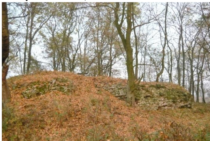
Zdjęcie nr 16. Relikty zamku Kolno, Stare Kolnie

Gotycki zamek Kolno wzniesiony prawdopodobnie u schyłku XIII w. jako strażnica - komora celna strzegąca wsch. granicy księstwa wrocławskiego, później brzeskiego. W 1317 r. książę brzeski Bolesław III przeniósł komorę do Brzegu, a sam zamek odsprzedał w ręce prywatne. W 1443 r. właścicielem została rycerska rodzina von Beess. Dwa tygodnie przed nabyciem zamku od księżnej brzesko - legnickiej zamek został zniszczony przez wojska koalicji ks. ziębicko - opawskiego Wilhelma i biskupstwa wrocławskiego.