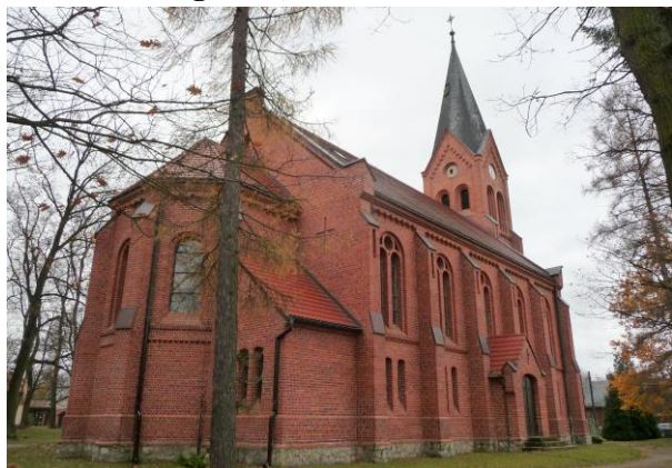
Zdjęcie nr 3. Kościół ewangelicki, Lubienia