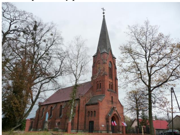
Zdjęcie nr 1. Kościół parafialny pw. św. Michała Archanioła w Karłowicach, ul. Kościelna

Wzmiankowany w 1500 r., od 1534 r. w posiadaniu ewangelików. Obecny zbudowany jako ewangelicki u schyłku XIX w. w stylu neogotyckim, w miejscu kościoła poprzedniego. Po 1945 r. przejęty przez katolików. Usytuowany w centrum wsi, po płn. stronie ul. Kościelnej. Wokół teren rozplantowany, obsiany trawą, na płn. od kościoła pozostałości cmentarza ewangelickiego. Zbudowany