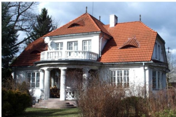
Zdjęcie nr 2. Willa „Uroczą”, ul. Słowackiego 16

Willa wybudowana w ok. 1910 r., własność rodziny Trapszów - znanych aktorów teatralnych. Parterowy budynek murowany z użytkowym poddaszem, nakryty naczółkowym dachem. Na osi fasady półokrągły ganek czterokolumnowy, dźwigający balkon, poprzedzony schodami. W połaci frontowej trójosiowa facjata nakryta trójspadowo, po bokach - okna powiekowe.