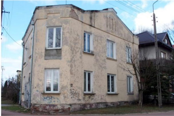
Zdjęcie nr 9. Kamieniczka, ul. Orszagha 2