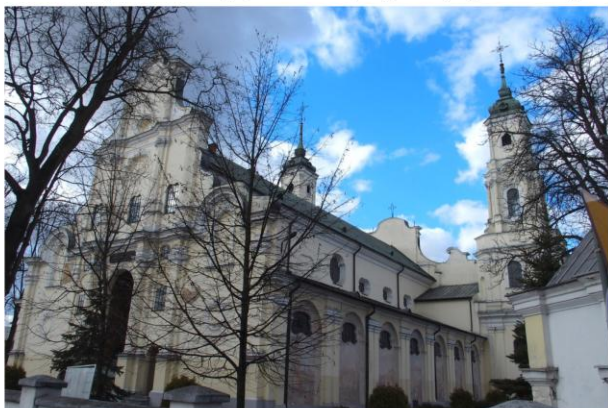
Zdjęcie nr 1. Kościół parafialny pw. Świętej Trójcy, widok kościoła od strony prezbiterium