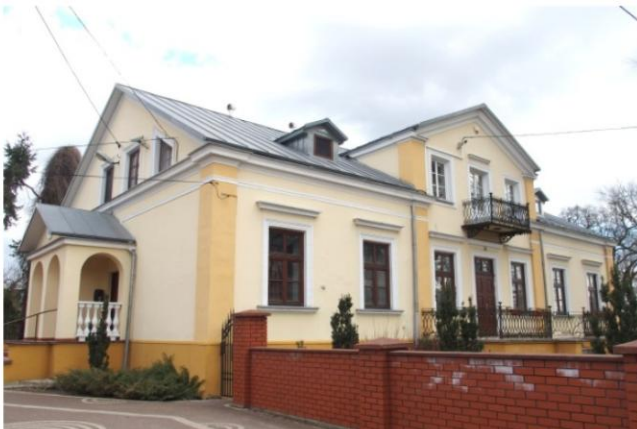
Zdjęcie nr 8. Plebania, ul. Kościelna 2a