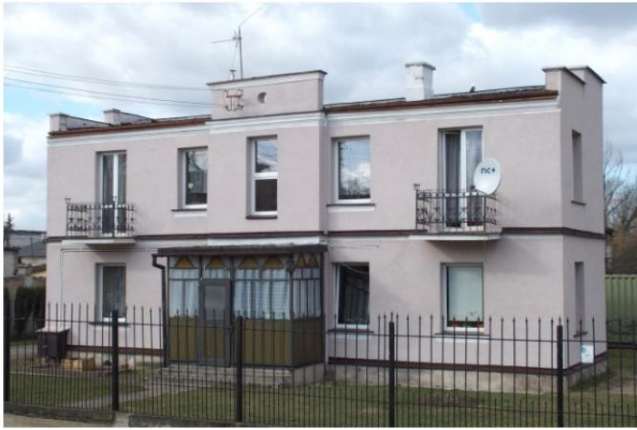
Zdjęcie nr 6. Willa ul. Żymirskiego nr 57

Willa pochodzi z 1937 r. Jednotraktowy, dwukondygnacyjny budynek na rzucie wąskiego prostokąta z płytkim ryzalitem na osi fasady, zwieńczonym attyką. Elewacja skomponowana funkcjonalnie, w przyziemiu ryzalitu drewniany ganek.