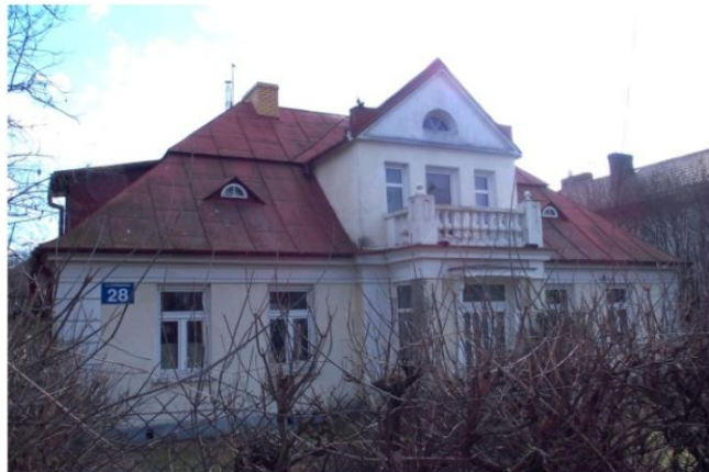
Zdjęcie nr 4. Willa, ul. Żymirskiego 28

Willa pochodzi z ok. 1910 r. Murowany budynek na rzucie prostokąta, parterowy z użytkowym poddaszem, nakryty wysokim dachem łamanym, rozczłonkowanym facjatami. W fasadzie i w elewacji bocznej - prostokątne aneksy, w elewacji ogrodowej - pięcioboczny taras. Pseudoboniowanie naroży ścian oraz gzymsy: cokołowy i wieńczący poprzedzony szerokim fryzem - wypracowane w tynku. Wnętrze dwutraktowe.