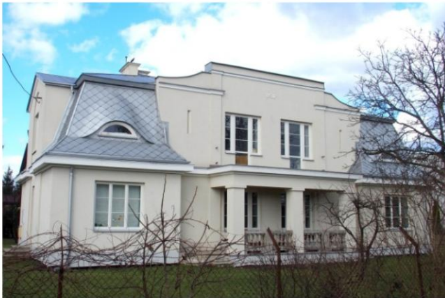
Zdjęcie nr 7. Willa, ul. Kościuszki nr 8

Willa pochodzi z 1930 r., modernizm z elementem malowniczości.