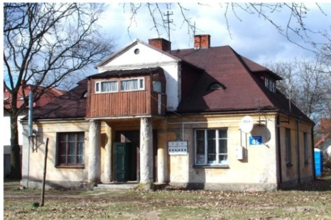
Zdjęcie nr 5. Willa, ul. Żymirskiego nr 45

Willa pochodzi z ok. 1915 r. Murowany, parterowy budynek nakryty wysokim dachem czterospadowym, rozczłonkowanym facjatami. W fasadzie dwukolumnowy portyk z balkonem zabudowanym drewnem.