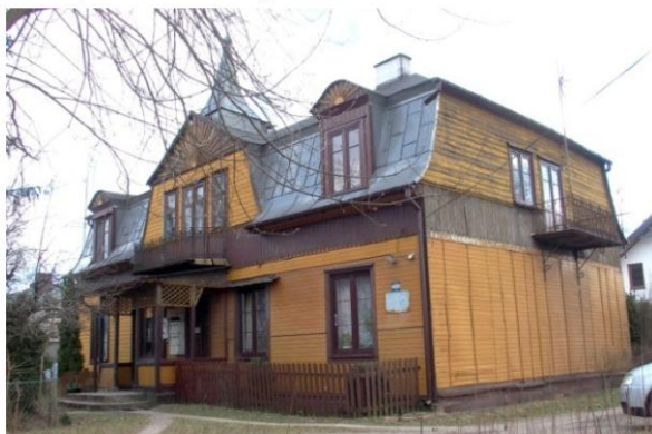
Zdjęcie nr 3. Willa, ul. Załuskiego 102