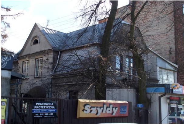
Zdjęcie nr 10. Willa, ul. Warszawska nr 8