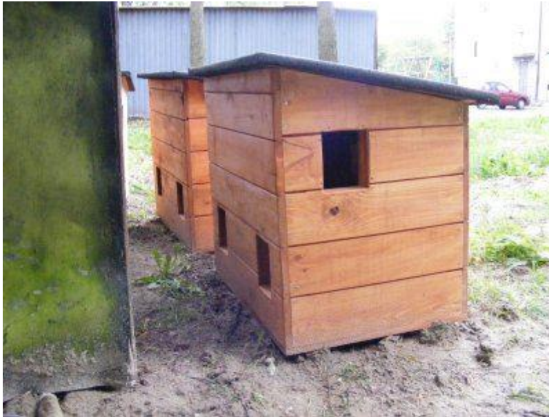
Przykładowe zdjęcie budki dla kotów

§ 17. Odłowione zwierzęta bezdomne będą podlegały obowiązkowej sterylizacji i kastracji którą wykonuje Schronisko dla bezdomnych zwierząt prowadzące działalność gospodarczą pod nazwą Przedsiębiorstwo Gospodarki Mieszkaniowej sp. z o. o., z którym Urząd Gminy zawarł stosowną umowę.