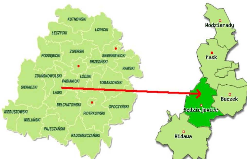
Rysunek 1. Położenie Gminy na tle województwa i powiatu