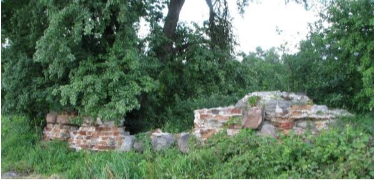
Rysunek 7. Relikt dworu w Woli Węzykowej