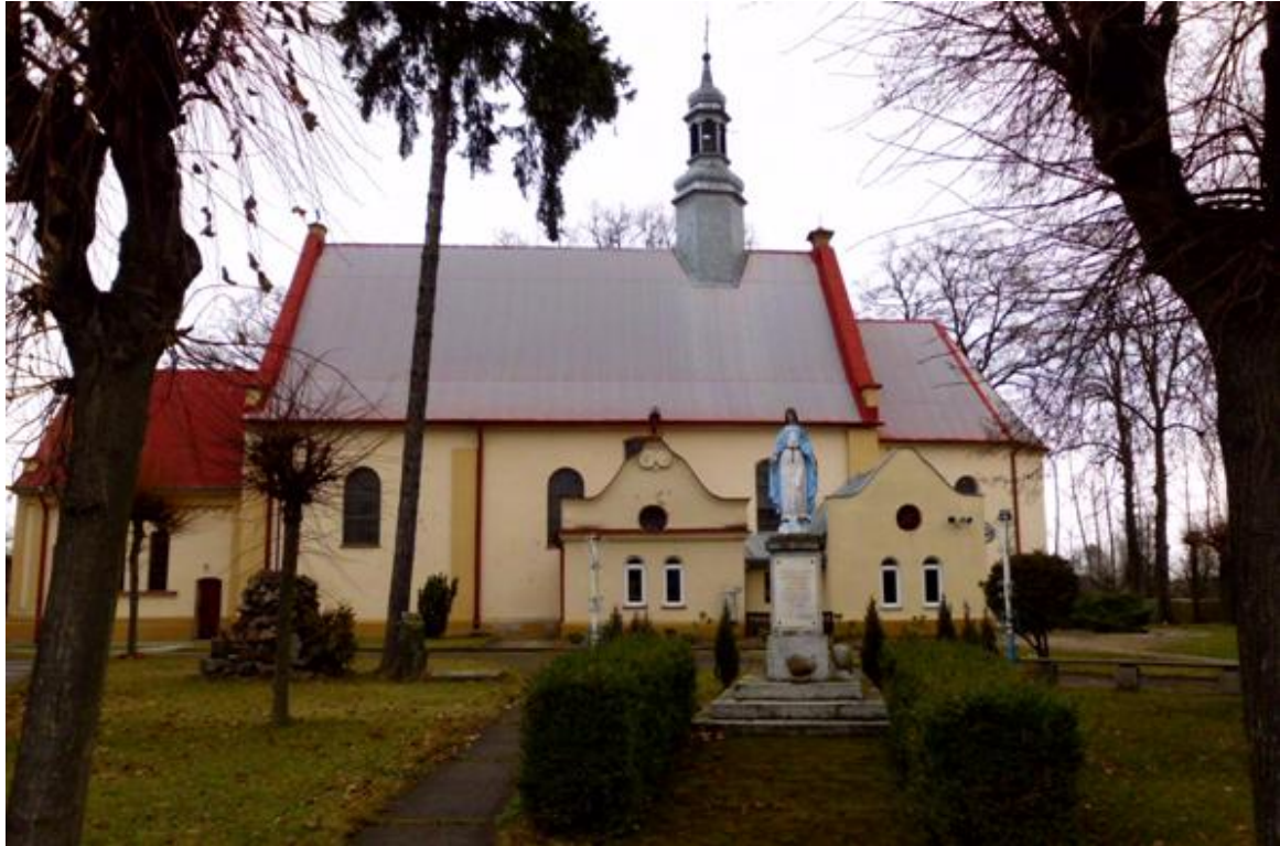
Rysunek 3. Kościół parafialny p.w. Wniebowzięcia NMP w Marzeninie