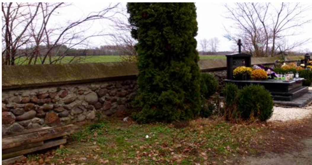
Rysunek 8. Ogrodzenie cmentarza w Sędziejowicach