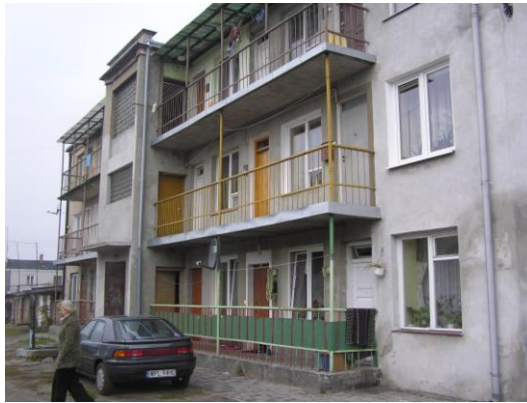
Fot. 17. d. młyn przy ul. Młyńskiej 7