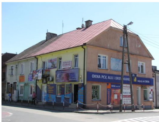
Fot. 18. ul. Narutowicza 1

- zmiana lub likwidacja detalu i kompozycji,