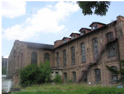
Fot. 1. Hala A w Żychlinie

Kolejną grupą zabytków pod względem liczebności są obiekty budownictwa przemysłowego, świadczące o tradycjach przemysłowych tych terenów (głównie przemysłu cukrowniczego). Do grupy zabytków przemysłowych zalicza się między innymi hale produkcyjne w zespołach fabrycznych i poza tymi zespołami, warsztaty, obiekty towarzyszące, kotłownie, młyny i wiatraki. Większość tych zabytków usytuowana jest w cennych zespołach przemysłowych b. cukrowni Walentynów w Żychlinie oraz cukrowni „Dobrzelin” w Dobrzelinie. Przykładem budownictwa przemysłowego występującym poza zespołami są młyny (1 w Grabowie i 3 w Żychlinie).