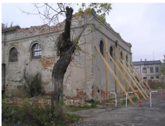
Fot. 16. Bożnica w Żychlinie