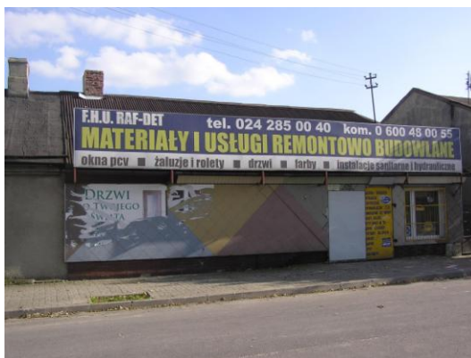
Fot. 11. Pl. Wolności 16