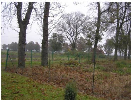
Fot. 14. Park w Drzewoszkach