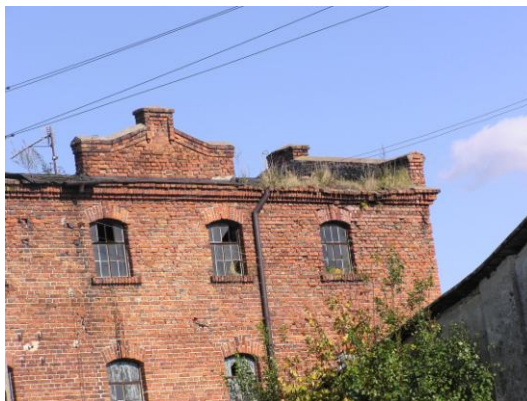
Fot. 13. Młyn motorowy w Żychlinie