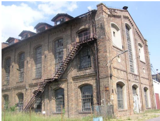
Fot. 12. Hala produkcyjna A w Żychlinie