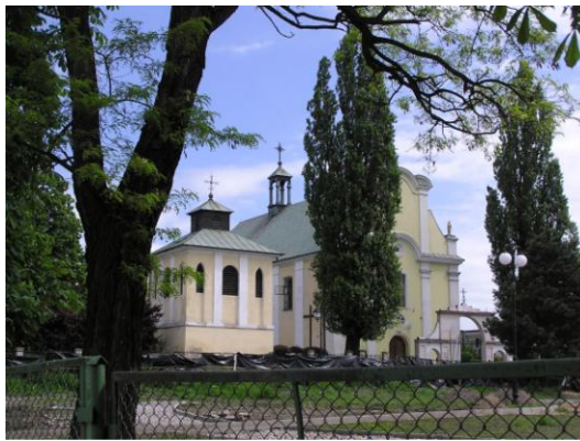
Fot. 5. Kościół pw. św. Apostołów Piotra i Pawła w Żychlinie

Prawie wszystkie wymienione wcześniej dwory stanowią elementy zespołów dworsko-parkowych (w Dobrzelinie, Śleszynie, Śleszynku, Zarębowie) z zachowanymi w różnym stopniu założeniami parkowymi. Zupełnie nieczytelne jest już obecnie założenie parku w Drzewoszkach. W stanie szczątkowym znajduje się park podworski w Sędkach - Kaczkowiznie, pozbawiony obiektu mieszkalnego.