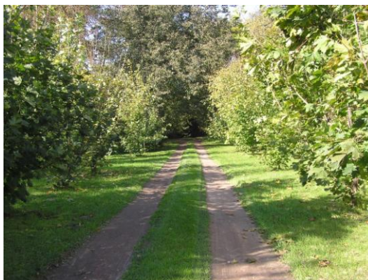
Fot. 15. Park dworski w Zarębowie