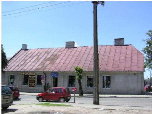
Fot. 7. Budynek d. apteki, Żychlin, ul. Narutowicza 20

zajazdy, a obecnie budynki mieszkalne przy ulicy Narutowicza 1 i Łukasińskiego 1, budynek straży pożarnej przy Placu Wolności oraz dwa najcenniejsze obiekty: budynek dawnej poczty przy ul. Kilińskiego 9 i dawna apteka obecnie obiekt handlowy przy ul. Narutowicza 20.