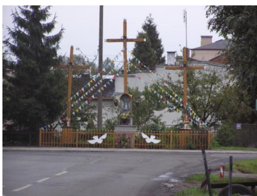
Fot. 6. Kapliczki w: Śleszynie, Żychlinie, Dobrzelinie, 3 krzyże w Dobrzelinie

Budynki użyteczności publicznej, do których zalicza się siedziby władz administracyjnych, szkoły i internaty, banki, poczty, hotele, dworce, kina, szpitale. Do zabytków tego typu w Żychlinie należą dawne