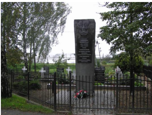
Fot. 10. Cmentarz grzebalny parafii rzym.-kat. pw. św. Piotra i Pawła w Żychlinie, epidemiologiczny w Żychlinie, z I-szej wojny światowej w Kaczkowiźnie, cmentarz wojenny z 1939 roku w Dobrzelinie