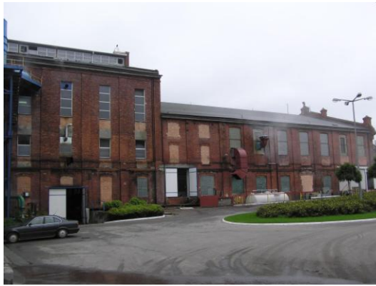
Fot. 2. Hala produkcyjna Dobrzelin