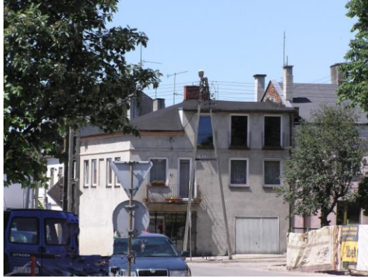
Fot. 20. Kamienica, pl. 29 Listopada 12 w Żychlinie