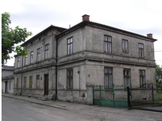
Fot. 8. Budynek d. poczty, Żychlin, ul. Kilińskiego 9