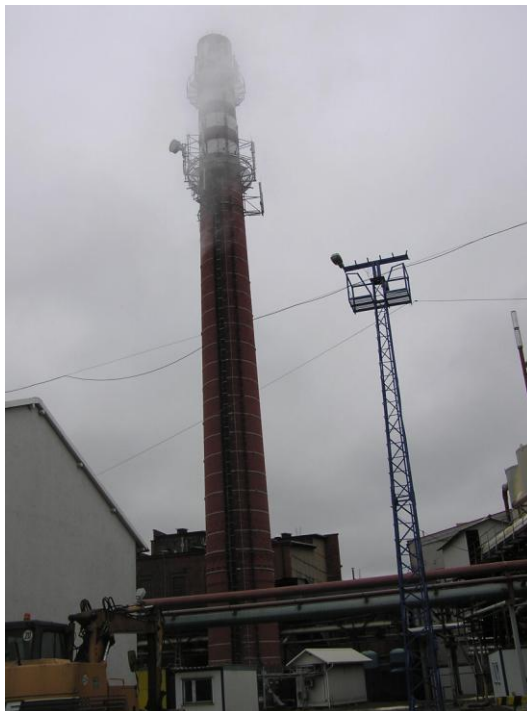
Fot. 3. Komin w Dobrzelinie