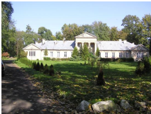
Fot. 4. Pałac w Śleszynie

Na terenie gminy Żychlin dosyć licznie występują założenia dworskie. Obecnie na terenie gminy występuje 5 dworów (w Dobrzelinie, Śleszynie, Śleszynku, Żarębowie, Żabikowie), z których tylko dwór w Żabikowie nie jest objęty formą prawnej ochrony poprzez wpis do rejestru zabytków. Pomimo objęcia ochroną,