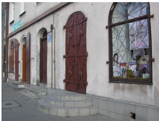
Fot. 9. Żychlin, pl. 29 Listopada 27