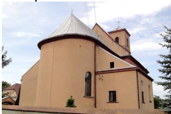
Zdjęcie nr 5. Kościół pw. św. Michała Archanioła we Wszemirowie

Pierwotnie drewniany kościół wzmiankowany jest w 1300 r., obecny barokowy, wzniesiony w 1780 r., restaurowany w XIX w. i 1972 r.