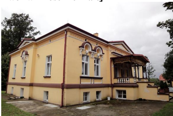
Zdjęcie nr 9. Dwór w Krościnie Małej

Dwór o formie palladiańskiej willi – eklektyczny z elementami neorenesanu – ok. 1880 r. Dwór założony na rzucie prostokąta zbliżonego do kwadratu, podpiwniczony, parterowy, z użytkowym poddaszem, nakryty dachem czterospadowym o niewielkim kącie nachylenia połaci. Fasada siedmioosiowa z centralnym trzyosiowym ryzalitem mieszczącym główne wejście, ryzalit zwieńczony trójkątnym przyczółkiem, poprzedzony jest gankiem ze schodami. W elewacji tylnej i bocznej elewacji wsch. – płytkie ryzalitty. Elewacje bogate w detale architektoniczne: wieńczący gzyms kostkowy, fryz, nad oknami półkoliste naczółki z dekoracją sztukatorską, płyciny podokienne, profilowane opaski okien w części obramień zastąpione pilastrami z kompozytowymi głowicami. Dach tarasu wsparty na drewnianych słupach z dekoracją ciesielską o motywach roślinnych,