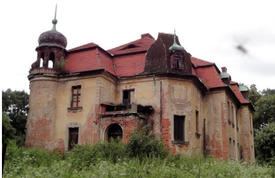
Zdjęcie nr 11. Pałac w Ligocie Strupińskiej