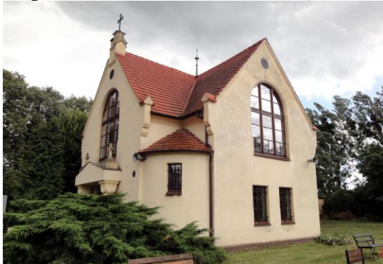
Zdjęcie nr 7. Kaplica cmentarna w Prusicach, ul. Żmigrodzka

Kaplica cmentarna, murowana, na rzucie krzyża, powstała w 1914 r. Przed wejściem dwie przysadziste kolumny wspierające trójkątny naczółek, na bokach zwieńczony kamiennymi krzyżami. W narożnikach znajdują się sterczyny. Górne okna zamknięte półkoliście, nad nimi oculusy. Frontowy szczyt kaplicy zakończony uskokową sterczyną, na której znajduje się metalowy krzyż o trójkoliście zakończonych ramionach, pod obdaszkiem.