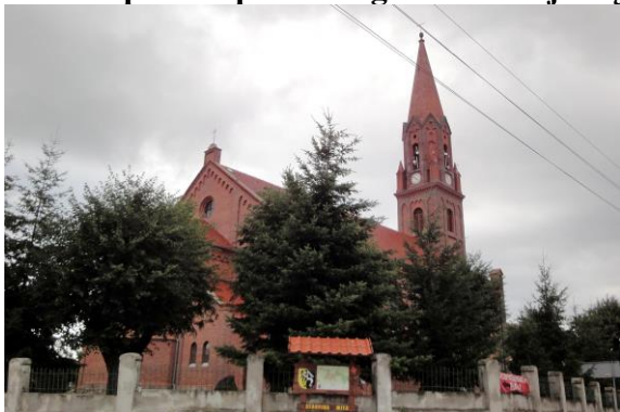
Zdjęcie nr 3. Kościół pw. Niepokalanego Serca Najświętszej Marii Panny w Strupinie

Pierwotny kościół ewangelicki, zniszczony przez husytów na pocz. XV w., po odbudowie został przejęty przez protestantów. Kolejna odbudowa nastąpiła po zniszczeniach wojny trzydziestoletniej, w 1663 r. dodano barokową drewnianą dzwonnice – wieżę. Na przełomie XVII/XVIII w. kościół zyskał bogaty wystrój. W 1828 r. z powodu złego stanu technicznego budowlę rozebrano i zbudowano od nowa w latach 1878-1880 według projektu mistrza budowlanego Krause ze Strupiny.