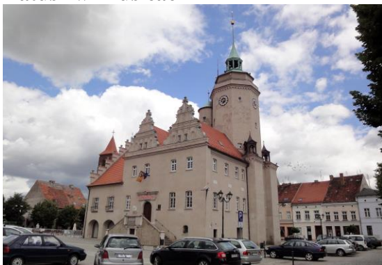
Zdjęcie nr 14. Ratusz w Prusicach

Ratusz wzmiankowany w 1512 r., spalony w 1529 r., odbudowany w latach 1529-1553 wg projektu Jakuba Paara, w stylu renesansowym; w 1742 r. – od płn. dobudowano zbór ewangelicki. W 1831 r. budynek przebudowany, obecną formę uzyskał w latach 1932-1938 (projekt Ericha Graua), kiedy rozebrano zbór i wzniesiono nowy budynek z podcieniami, zabudowanymi w 1982 r. Jest to budynek renesansowy z elementami gotyckimi. Poddany rewaloryzacji w latach 2010-2012.