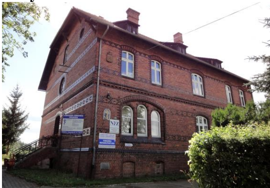
Zdjęcie nr 15. Budynek Ośrodka Zdrowia w Prusicach, ul. Żmigrodzka 22

Wzniesiony w miejscu Na miejscu obecnego Ośrodka Zdrowia w 1312 r. istniała kaplica pw. Nawiedzenia NMP (wzmiankowany w 1312 r., przebudowana ok. poł. XVI w.) i cmentarz dla ubogich i szpitalników. Zlikwidowana ok. 1803 r., cmentarz funkcjonował do poł. XIX w. W 1900 r. w miejscu kaplicy i cmentarza powstał budynek opieki dla ubogich z kaplicą modlitewną. W 1947 r. uruchomiono tu Ośrodek Zdrowia.