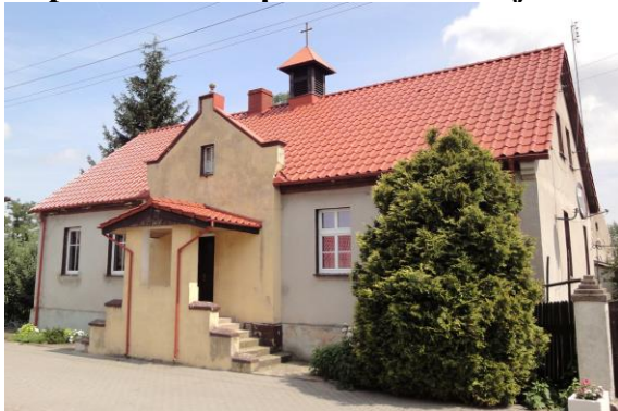
Zdjęcie nr 6. Kaplica mszalna pw. MB Królowej Polski, Kaszyce Wielkie nr 28

Kaplica powstała w 1872 r. Budynek przypomina dom mieszkalny, w kalenicy – sygnaturka. Do 1933 r. była tu katolicka kaplica pw. św. Józefa.