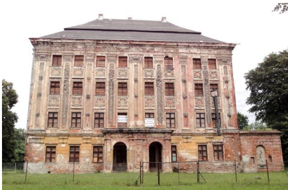
Zdjęcie nr 12. Pałac w Piotrkowicach

Barokowy pałac został wzniesiony w 1693 r. dla rodziny von Maltzan, w 2 poł. XIX w. został odnowiony. Niszczący od 1969 r., w 1985 r. poddany pracom zabezpieczającym, obecnie stanowi własność prywatną.