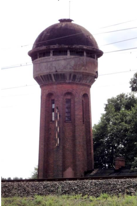
Zdjęcie nr 18. Wieża ciśnień, Skokowa

Wieża ciśnień pochodzi z ok. 1915 r. Na rzucie koła, murowana, ceglana. Nadwieszony zbiornik tynkowany fakturalnie z dekoracją z gładkiego tynku. Poniżej głęboko wcięte lizeny u góry połączone arkadowo.