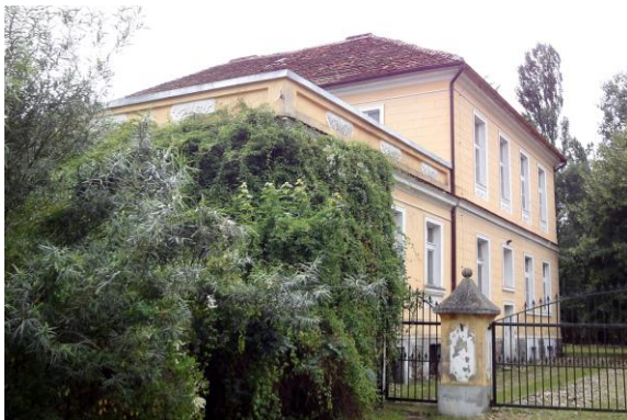
Zdjęcie nr 10. Dwór w Raszowicach

Dwór wzmiankowany w 1830 r., w obecnej formie klasycystyczny z 1860 r. i 1900 r. Murowany z cegły, tynkowany, założony na rzucie prostokąta, z parterową przybudówką zwieńczoną tarasem – od wsch. Podpiwniczony, dwukondygnacyjny nakryty dachem czterospadowym. Elewacje zdobione boniowaniem pasowym, prostokątne okna w profilowanych opaskach, część z płycinami podokiennymi z dekoracją sztukatorską.