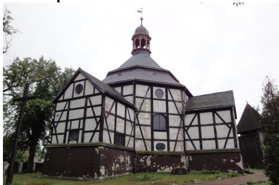
Zdjęcie nr 4. Kościół pw. św. Piotra i Pawła w Pawłowie Trzebnickim

W średniowieczu we wsi istniała kaplica, w latach ok. 1550-1554 znajdująca się w rękach ewangelików, w latach 1554-1708 ponownie w rękach katolików. W latach 1708-1709 wzniesiono obecny barokowy kościół ewangelicki, który początkowo był dwuwyznaniowy. Restaurowany w 1972 r.