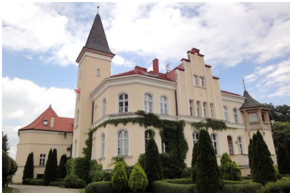
Zdjęcie nr 8. Pałac w Brzeźnie

Rezydencja wzmiankowana 1787 r. i 1830 r., obecna budowla z 1830 r., przebudowana w 1913 r. Budynek o znacznie rozczłonkowanej bryle, murowany, tynkowany, założony na planie zbliżonym do prostokąta, z różnorodnymi ryzalitami, gankiem i wydatnym wielobocznym aneksem z werandą na piętrze – w narożniku płn.-wsch., balkonem oraz z kwadratową wieżą. Podpiwniczony, dwukondygnacyjny, z częściowo użytkowym poddaszem, nakryty dachem wielospadowym z lukarnami. Ściany gładko tynkowane, podziały poziome w formie gzymśów podokiennych, międzykondygnacyjnego fryzu ujętego w gzymśy i fryzu z gzymsem – w zwieńczeniu. W szczycie – podziały lizenowe. Okna prostokątne i zamknięte łukiem tudora, w profilowanych opaskach.