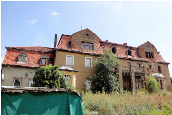
Zdjęcie nr 13. Pałac w Górowie

Zbudowany ok. 1800 r., przebudowany w 1871 r. wg projektu Wassermanna. Budynek na rzucie wydłużonego prostokąta, podpiwniczony, dwukondygnacyjny, z użytkowym poddaszem, z dwoma węższymi skrzydłami. Dach główny mansardowy z facjatkami zwieńczonymi szczytami wykrojonymi w spływy wolutowe i lukarnami, skrzydła przykryte dachami mansardowo-naczółkowymi. Na osi fasady trójosiowy podcień kolumnowy dźwigający taras, na osi elewacji ogrodowej – podcień filarowy, w skrajnych osiach elewacji ogrodowej – jednokondygnacyjne ryzalitty: na rzucie trapezu i na rzucie odcinka koła. Wnętrze dwutraktowe z sienią na rzucie litery K. Elewacje na cokole zaznaczonym uskokiem, dzielone pionowymi ramiakami ujmującymi poszczególne osie okienne. Okna w opaskach z górnymi uszakami, w strefie międzyokiennej każdej osi – prostokątna płycina z wgłębny owalem. Detal architektoniczny wypracowany w tynku.