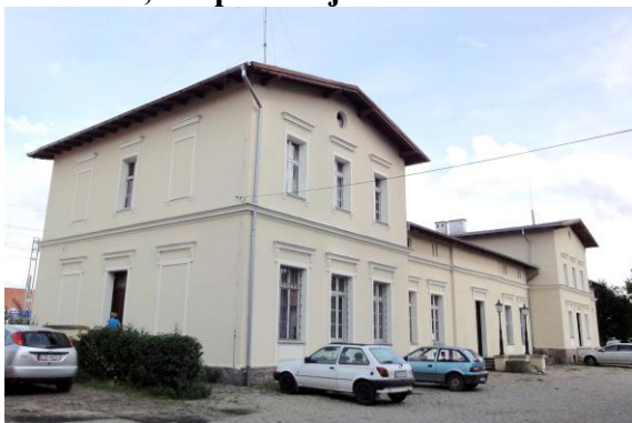
Zdjęcie nr 17. Budynek stacyjny, Skokowa

Zespół pochodzi z ok. 1880 r. Budynek stacyjny na rzucie „L” z przybudówką od płd. Parterowy z poddaszem, czteroskrzydłowy, skrzydła poprzeczne dwukondygnacyjne, wysunięte ryzalitowo. Murowany, dachy dwuspadowe z okapami wspartymi na ozdobnie wyciętych końcówkach krokwi. Elewacje tynkowane ujęte gzymsem kordonowym. W szczytach elewacji bocznych skrzydeł oculusy – od ulicy i medaliony – od peronu: w jednym postać kobieca z modelem stacji i rozwiniętym pergaminem, w drugim – postać kobieca trzymająca młot i obcęgi.