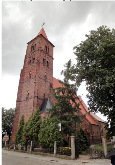
Zdjęcie nr 1. Kościół parafialny pw. św. Jakuba Apostoła w Prusicach

Kościół wzmiankowany w 1335 r., obecny wzniesiony w 1 poł. XV w. (prezbiterium z zakrystią, korpus, kaplica pld. przy korpusie), odbudowany po zniszczeniach husyckich wraz z kaplicą Kurzbachów w latach 1491-1492 (nowy strop, wieża), empory – pocz. XVII w., w 2 poł. XVII w. rozbudowany o kaplicę Hatzfeldów, 1681 r. – loża kolatorska (tzw. oratorium Hatzfeldów), 1833 r. – podwyższenie wieży o 1 kondygnację (Otto Goedsche), 2 ćw. XIX w. – budowa kruchty.