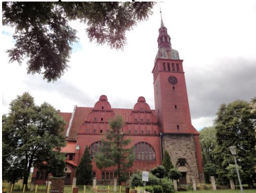
Zdjęcie nr 2. Kościół pomocniczy św. Józefa Oblubieńca w Prusicach, ul. Powstańców Śląskich 8

Kościół zbudowany w latach 1910-1911, jako ewangelicki. W 1956 r. przekazany kościołowi rzymskokatolickiemu, ponownie oddany do użytku w 1986 r. Stylowo stanowi połączenie modernizmu z elementami stylów historycznych, z zacytowaniem formy szczytów ratusza w Prusicach. Jest to projekt wrocławskiej spółki architektonicznej R. Gaze & Büttcher.