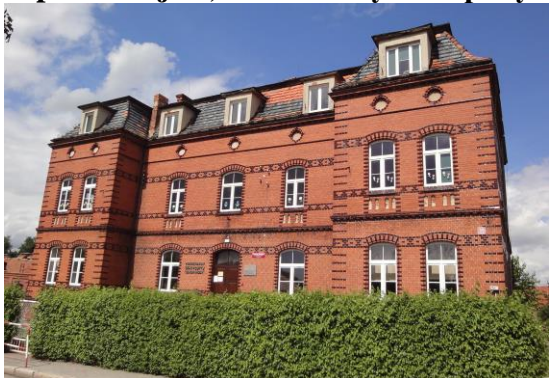
Zdjęcie nr 16. Szpital Miejski, ob. Dzienny dom pobytu „Senior Wigor” w Prusicach, ul. Żmigrodzka 39

Wzniesiony w 1904 r. wg projektu architekta Goedtsche. W zespole szpitala znajduje się budynek stołówki (1920 r.), ob. mieszkalny i budynek gospodarczy z 1904 r. W latach 1957-1974 znajdował się tu Dom Dziecka, internat, następnie do 2005 r. szkoła, aktualnie przedszkole niepubliczne.