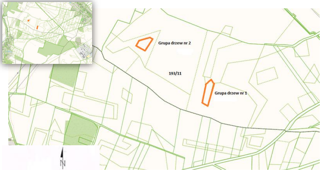
Rys. 1. Lokalizacja pomnika przyrody.

Położenie pomnika przyrody „Zadrzewienia śródpolne Komorniki – Trzebcz”.