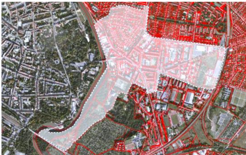
Rys. 1. Obszar rewitalizacji, źródło: Lokalny Program Rewitalizacji Miasta Zgorzelec na lata 2016 - 2025

Wyznaczony obszar rewitalizacji: Śródmieście - obszar centralny osiedla, powierzchnia - 101,0 ha (6,36% powierzchni ogółem).