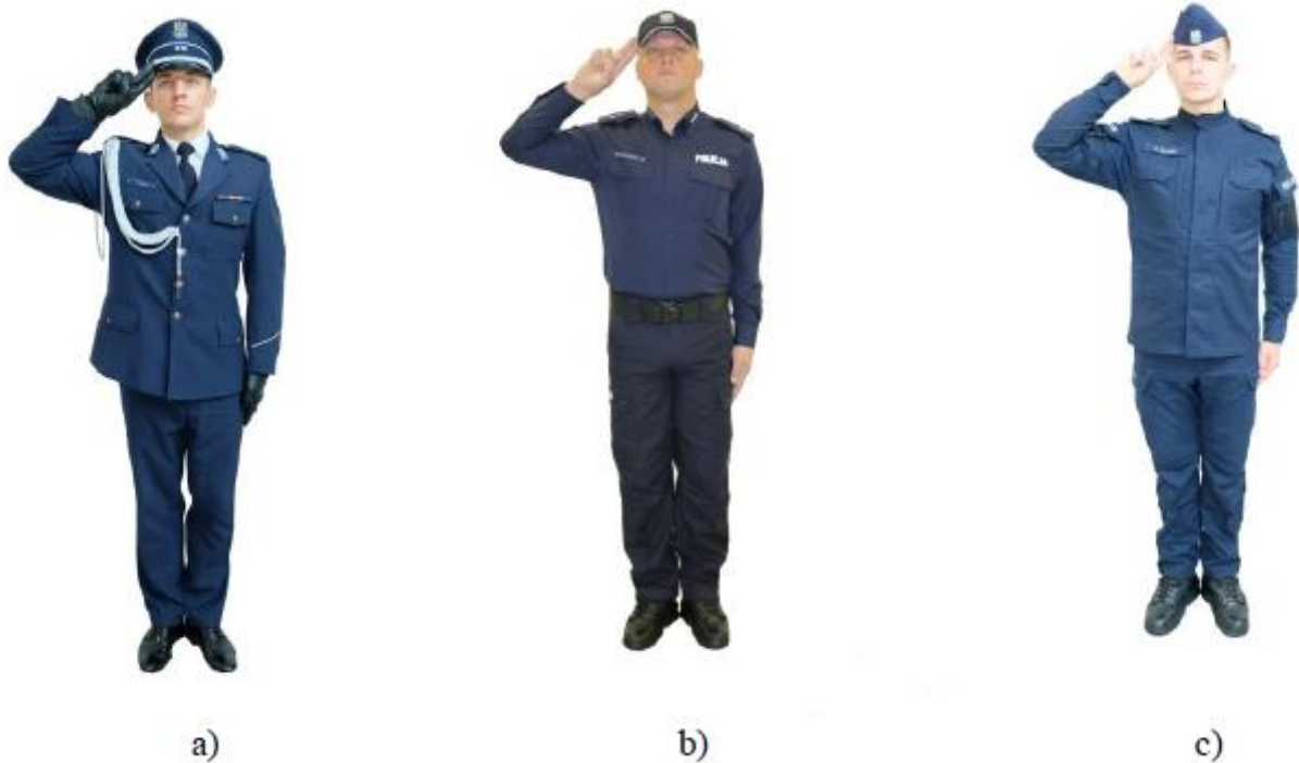
Fot. 1. Policjant salutujący w miejscu bez broni: