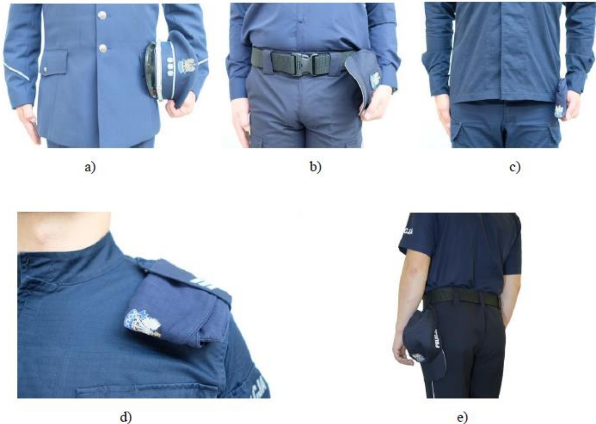
Fot. 15. Sposób trzymania i przenoszenia zdjętego nakrycia głowy, umundurowania: