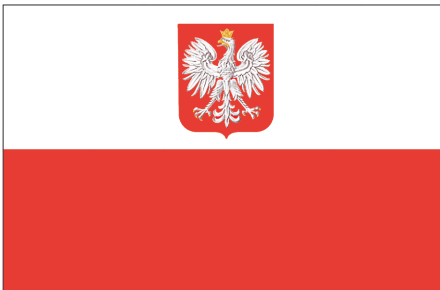
FLAGA PAŃSTWOWA RZECZYPOSPOLITEJ POLSKIEJ

Stosunek wysokości godła do szerokości flagi – wynosi 2:5