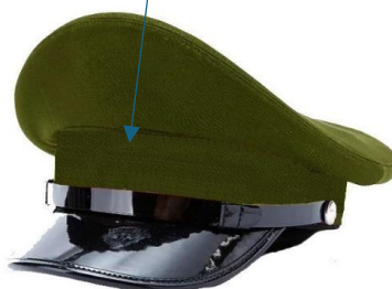
czapka okrągła typu garnizonowego