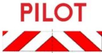
Rys. 1 Wzór oznakowania przedniej maski pojazdu