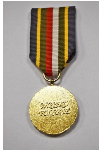
strona odwrotna medalu