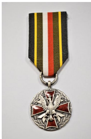
strona licowa medalu