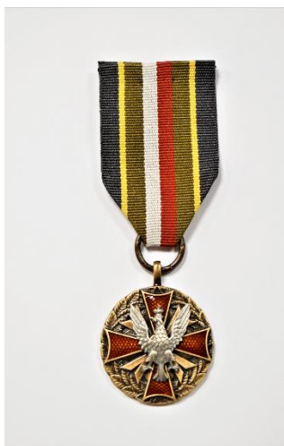
strona licowa medalu