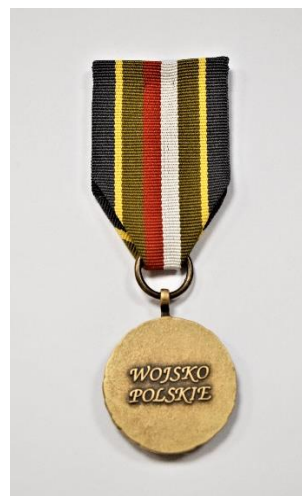
strona odwrotna medalu