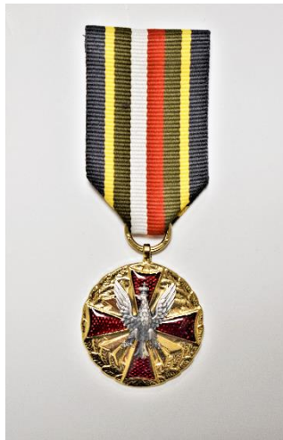
strona licowa medalu