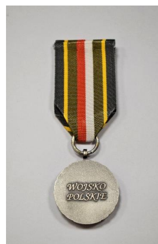
strona odwrotna medalu