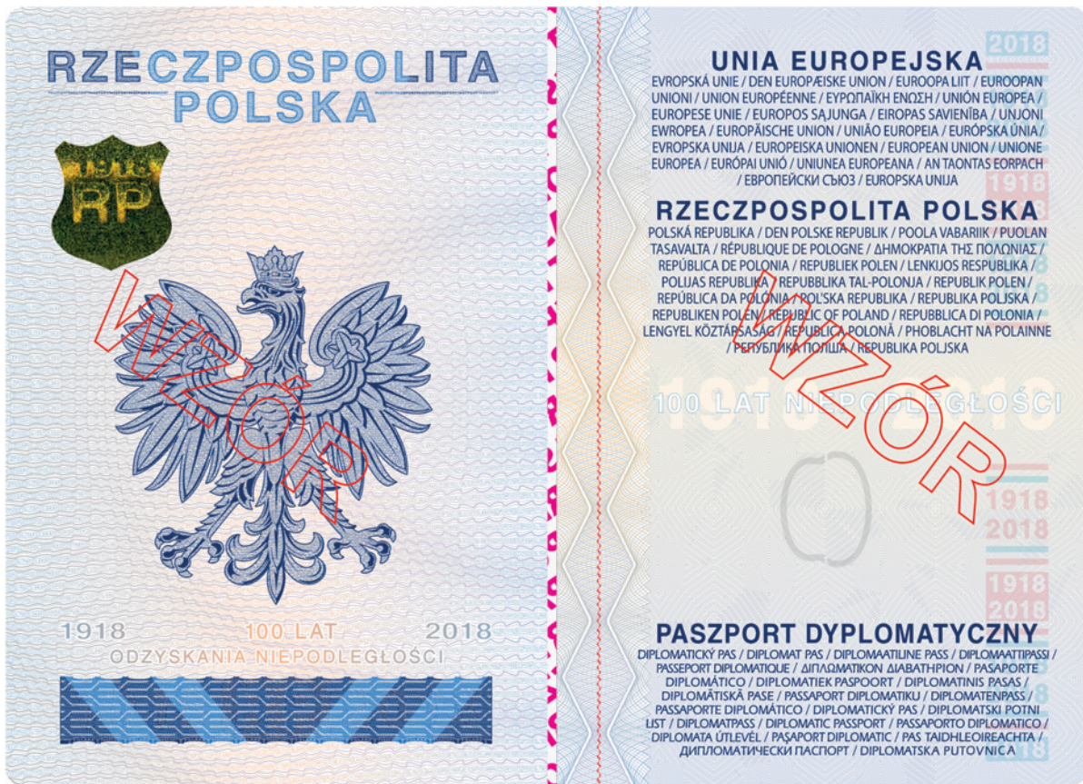
Strona 2 okładki (wewnętrzna)