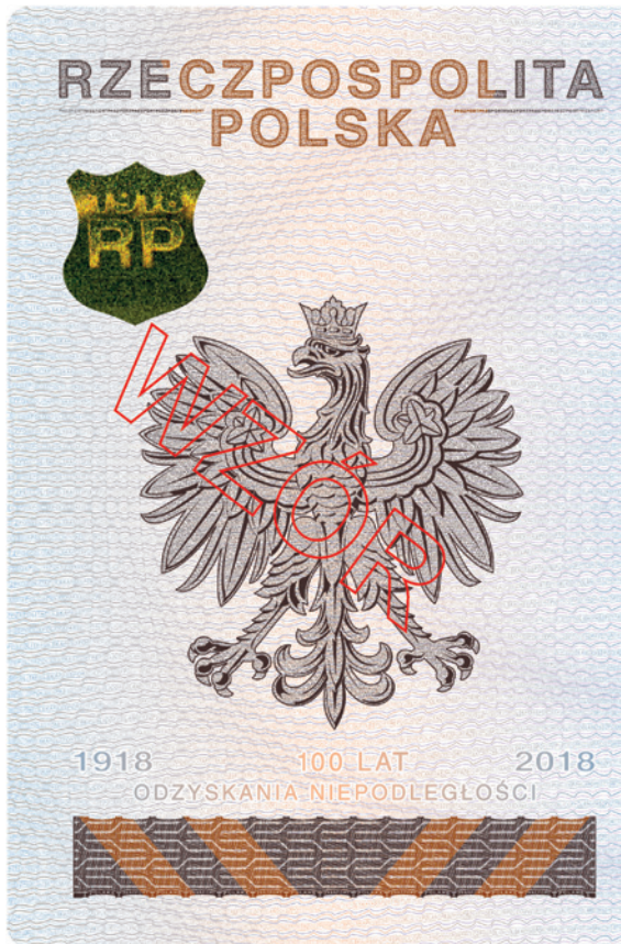
Strona 2 okładki (wewnętrzna)