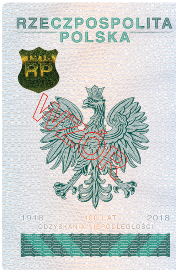
Strona 2 okładki (wewnętrzna)