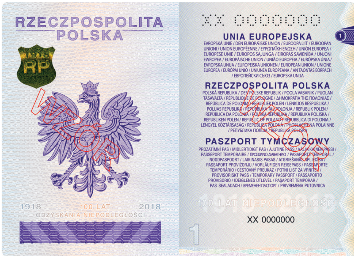
Strona 2 okładki (wewnętrzna)