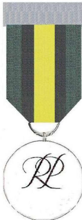
STRONA ODWROTNA Skala 1:1