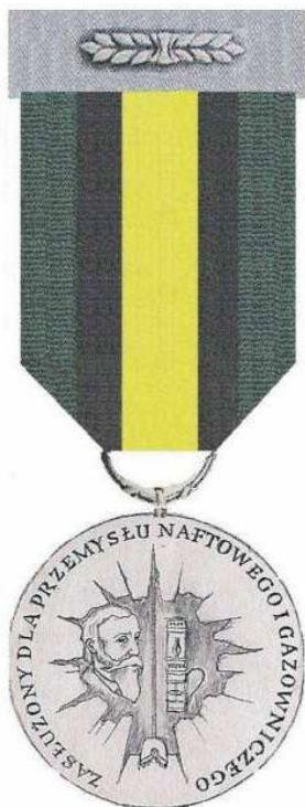
STRONA LICOWA Skala 1:1