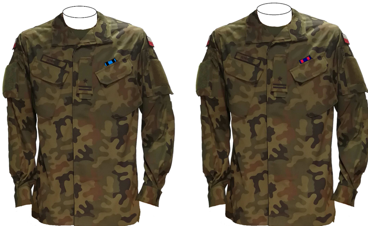
Rys. 9. 7) Sposób noszenia baretek Orderu Wojennego Virtuti Militari i Orderu Krzyża Wojskowego na bluzie munduru polowego.