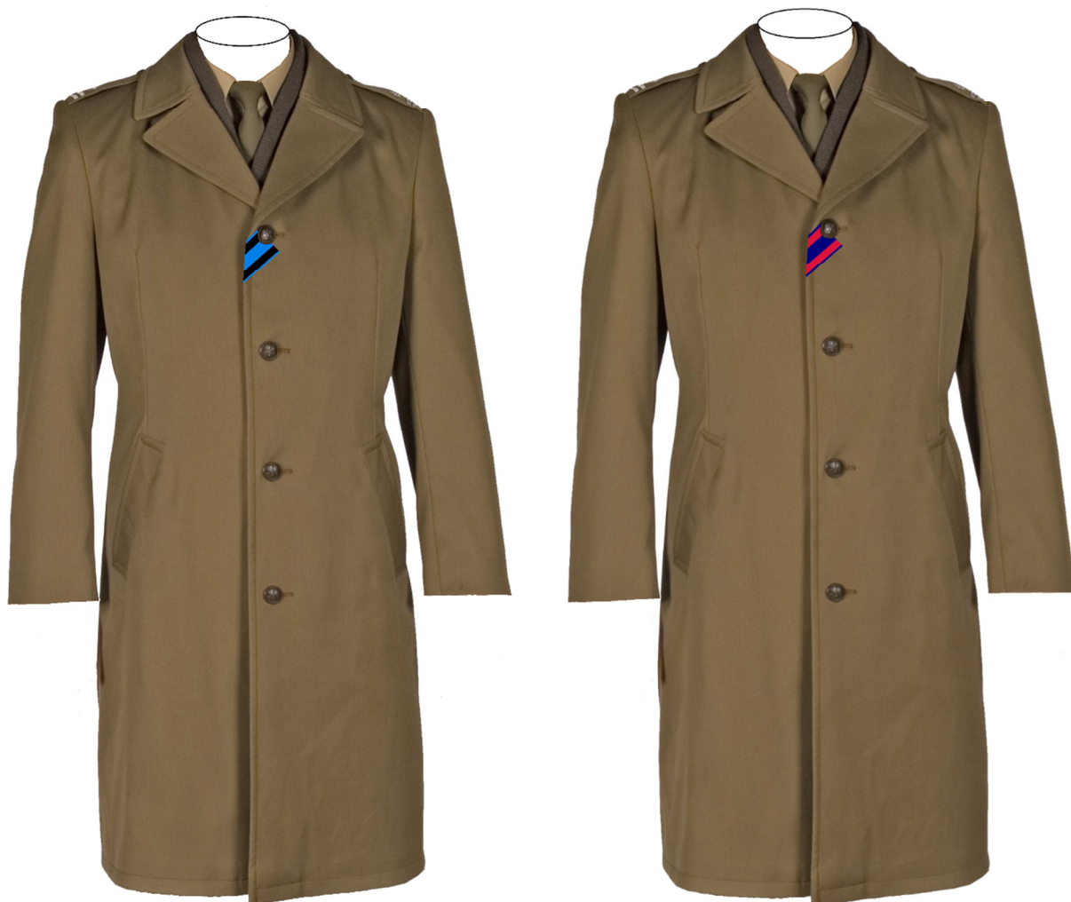
Rys. 11. 7) Sposób noszenia taśmy Orderu Wojennego Virtuti Militari i Orderu Krzyża Wojskowego na płaszczach.