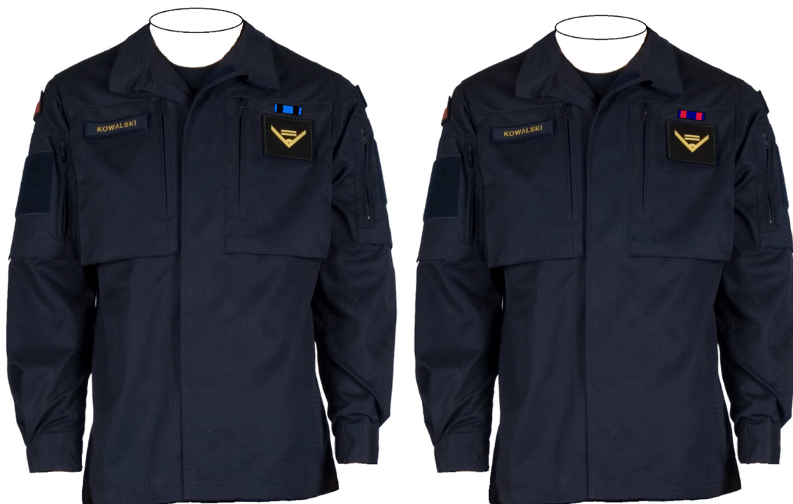
Rys. 10. 7) Sposób noszenia baretek Orderu Wojennego Virtuti Militari i Orderu Krzyża Wojskowego na bluzie munduru ćwiczebnego.