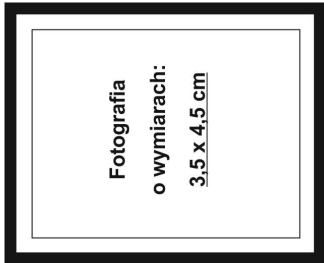
(nie wykraczać poza ramkę wewnętrzną)