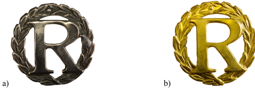
Rys. 1. Wzór oznaki identyfikacyjnej: