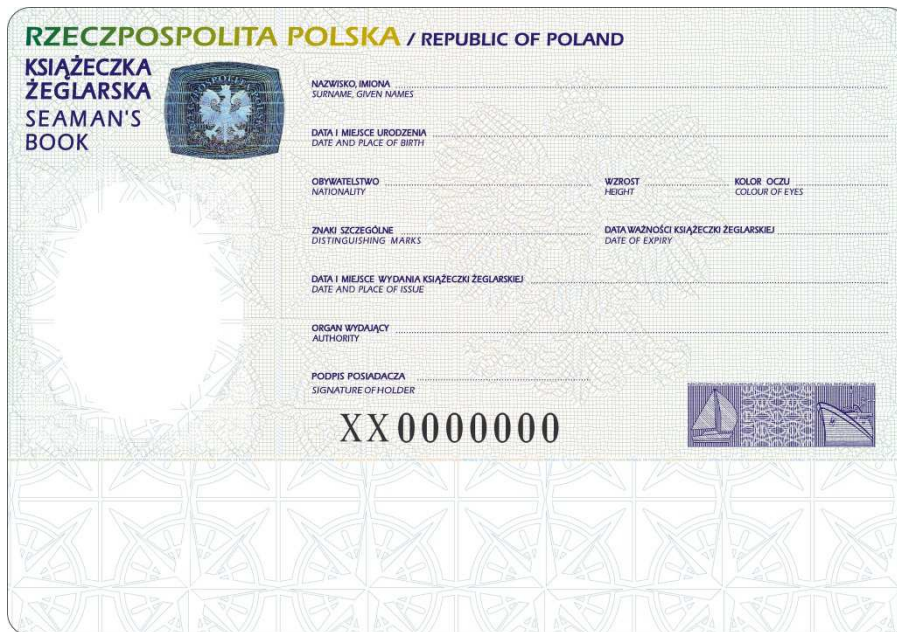
Naklejka personalizacyjna do książeczki żeglarskiej