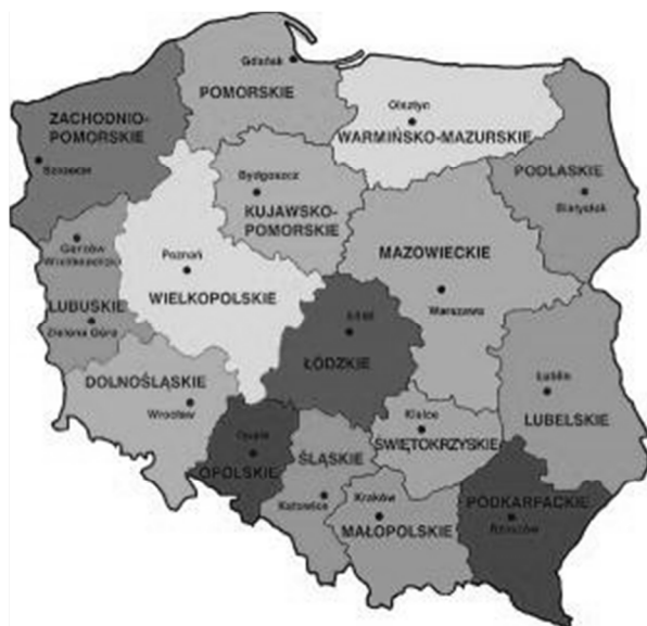
Rysunek 3. Podział administracyjny Rzeczypospolitej Polskiej na województwa

Program będzie realizowany na terytorium Rzeczypospolitej Polskiej. Podział administracyjny przedstawia rysunek 3