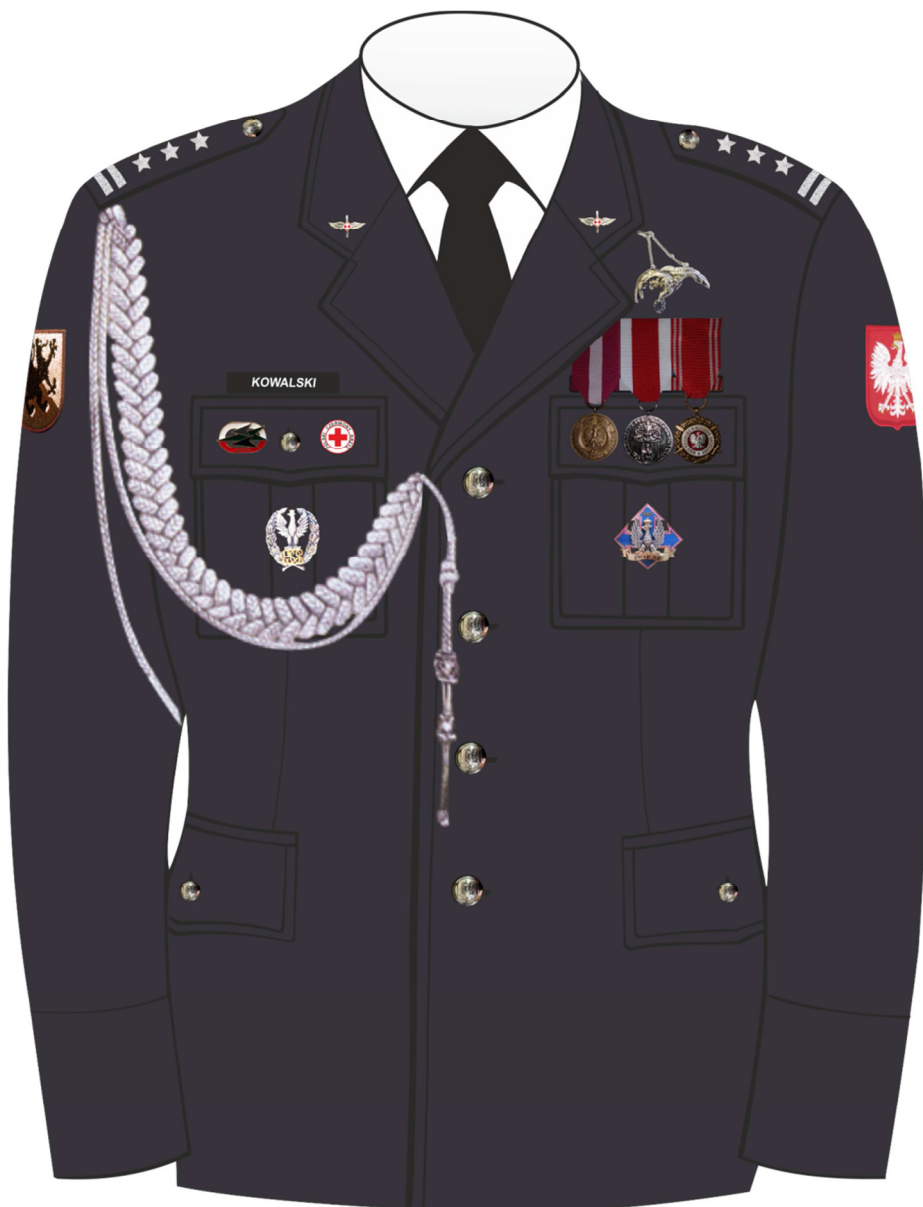
Rys. 3. Sposób noszenia odznak orderów, odznaczeń i odznak na kurtce munduru galowego Sił Powietrznych.