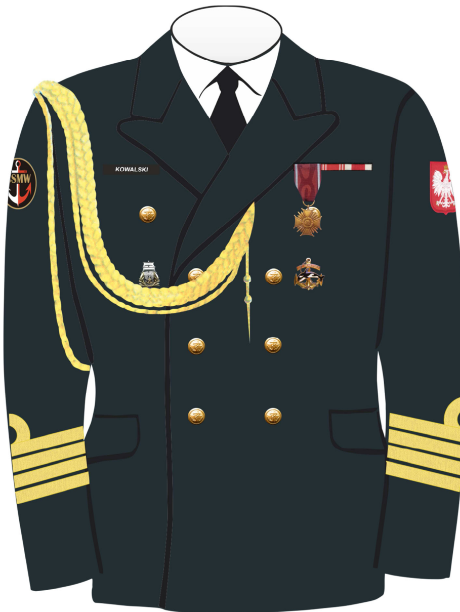
Rys. 4. Sposób noszenia odznak orderów, odznaczeń i odznak na kurtce munduru galowego Marynarki Wojennej.