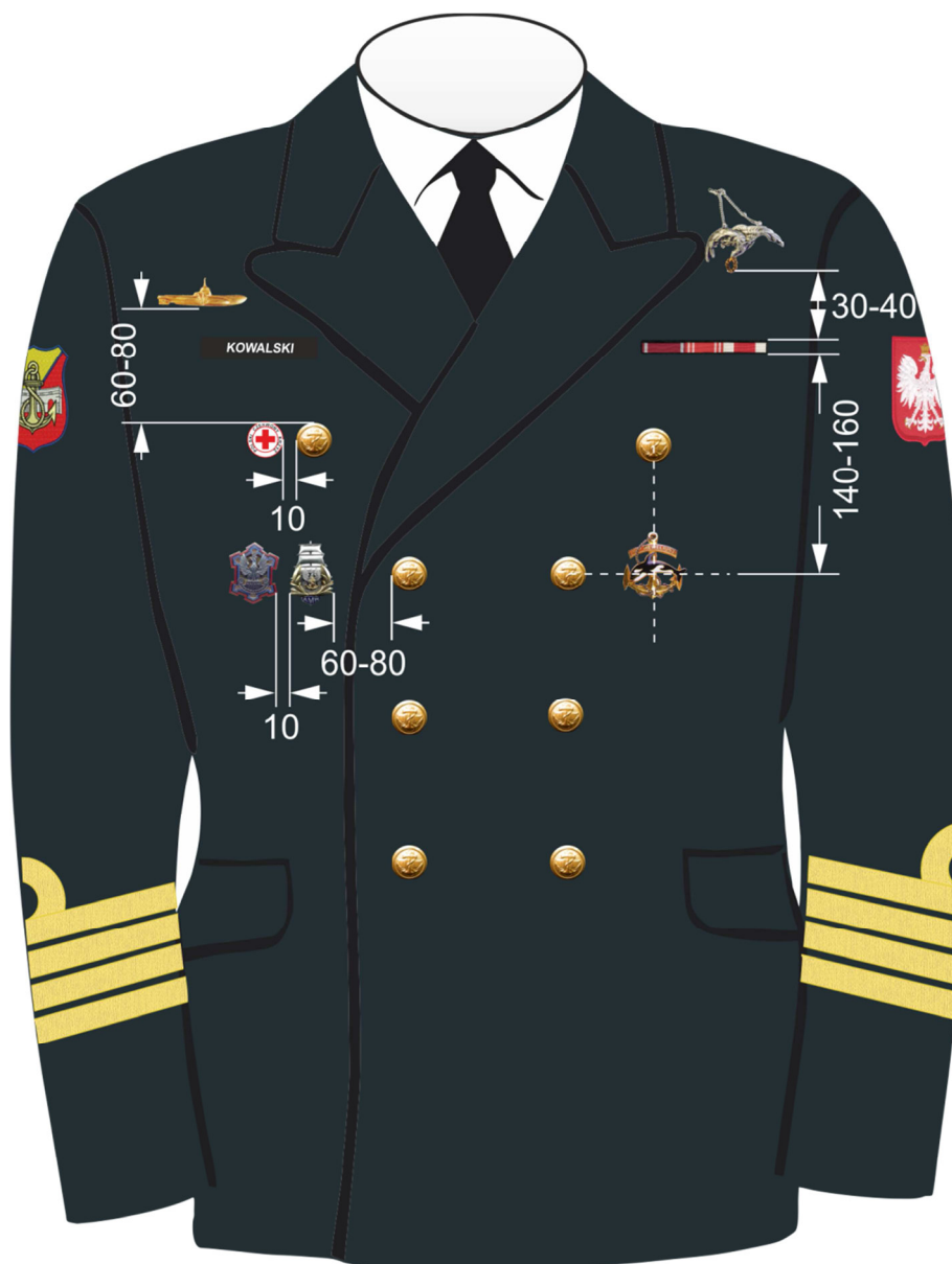
Rys. 7. Sposób noszenia baretek orderów, odznaczeń oraz odznak na kurtce munduru wyjściowego Marynarki Wojennej.