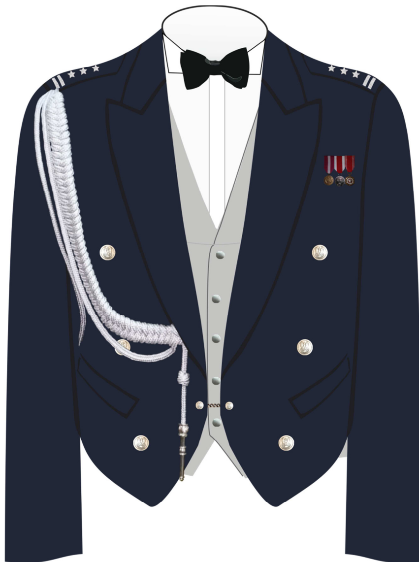
Rys. 1. Sposób noszenia miniaturki orderów i odznaczeń na półfraku munduru wieczorowego.

Załącznik do rozporządzenia Ministra Obrony Narodowej z dnia 4 sierpnia 2015 r. (poz. 1399)