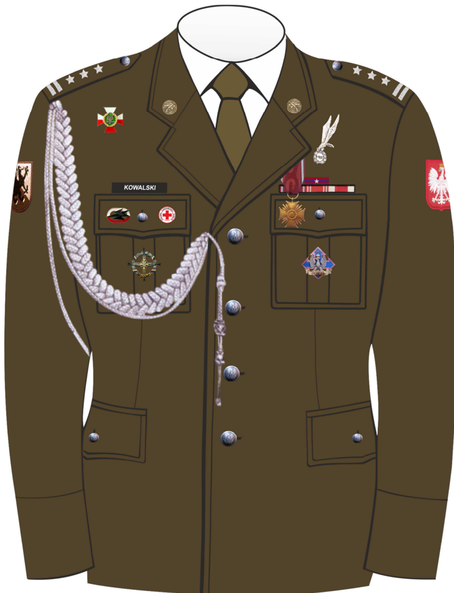
Rys. 2. Sposób noszenia odznak orderów, odznaczeń i odznak na kurtce munduru galowego Wojsk Lądowych.