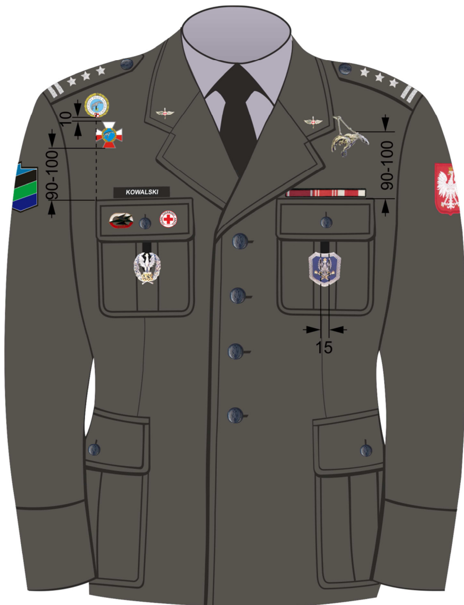
Rys. 6. Sposób noszenia baretek orderów, odznaczeń oraz odznak na kurtce munduru wyjściowego Sił Powietrznych.