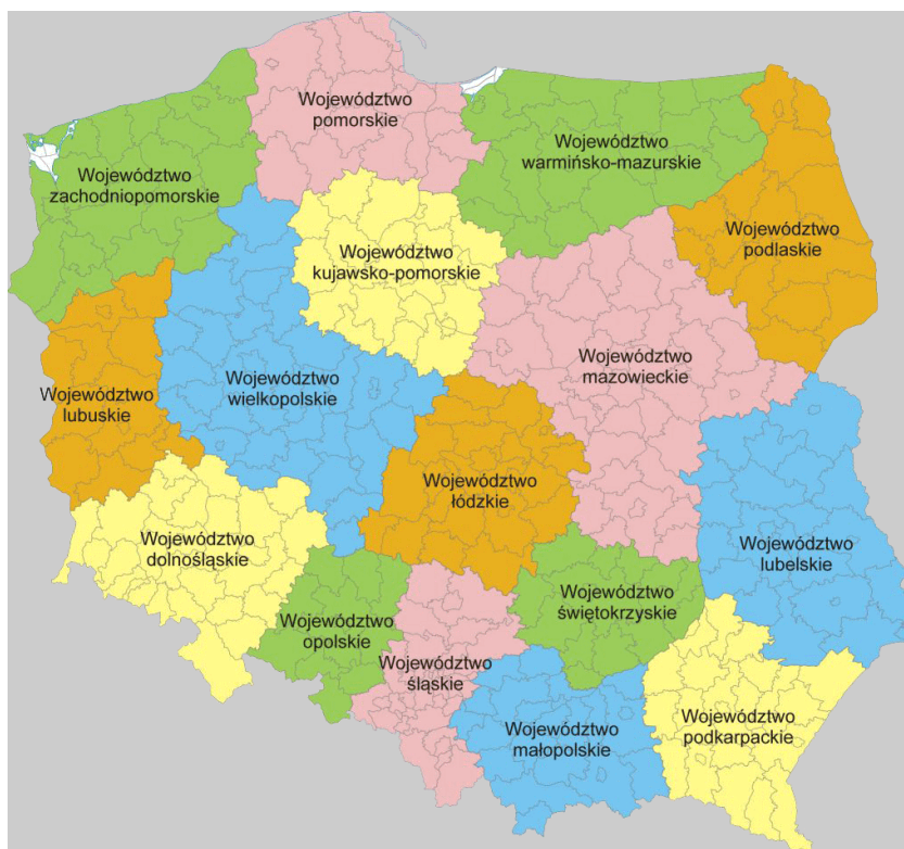
Rysunek 2. Podział administracyjny Rzeczypospolitej Polskiej

Program wprowadza się na terytorium Rzeczypospolitej Polskiej. Programem jest objęte 16 województw, w których skład wchodzi 314 powiatów oraz 66 miast na prawach powiatów.