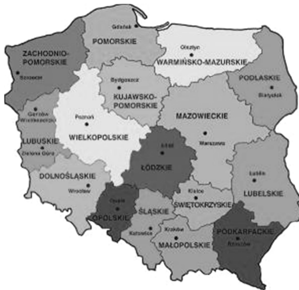
Rys. 3. Podział administracyjny Rzeczypospolitej Polskiej na województwa