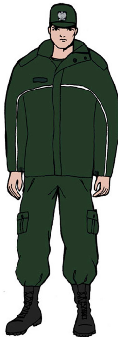
Ubiór uprawnionego w kurtce 3 / 4