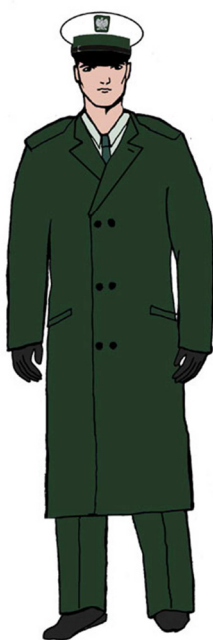
Ubiór Głównego Inspektora Transportu Drogowego (jego zastępcy) oraz wojewódzkiego inspektora transportu drogowego (jego zastępcy) w płaszczu