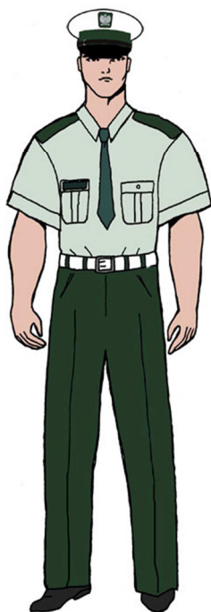
Ubiór uprawnionego w koszuli służbowej z krótkim rękawem – dla mężczyzny 4)