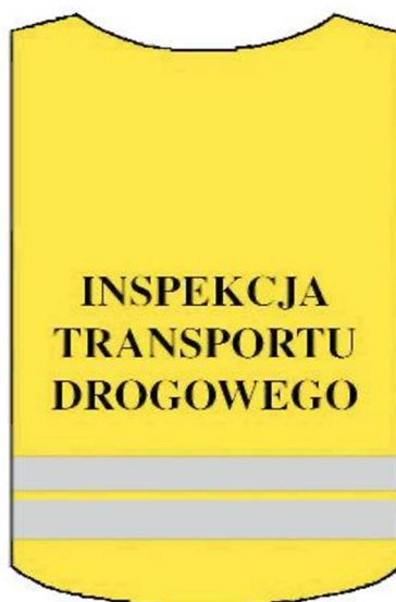
kamizelka ostrzegawcza – tył