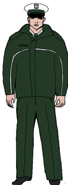
Ubiór uprawnionego w kurtce \frac{3}{4} – dla mężczyzny