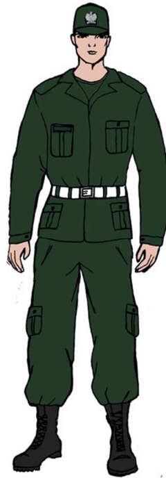
Ubiór uprawnionego w bluzy polowej 6)