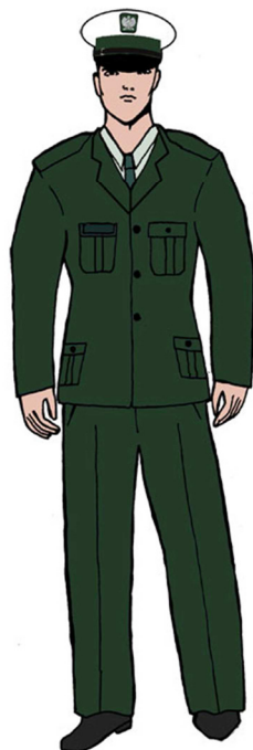
Ubiór uprawnionego w marynarce gabardynowej – dla mężczyzny