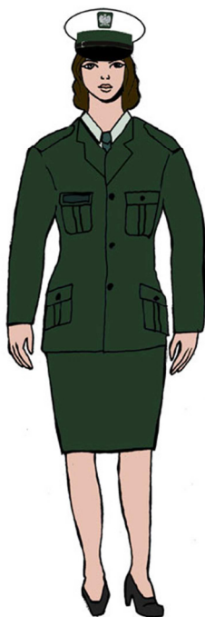
Ubiór uprawnionego w marynarce gabardynowej – dla kobiety 2)