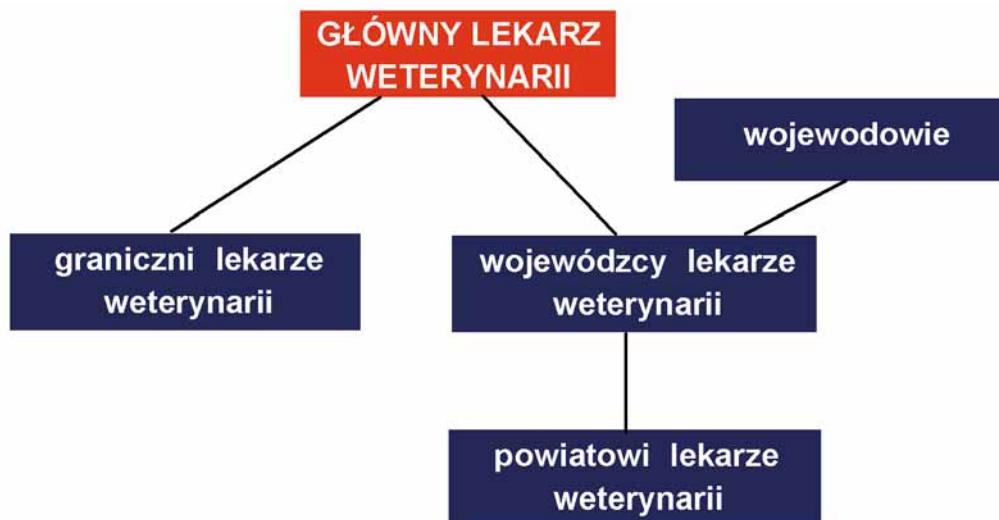
Rys. 1. Schemat organizacji Inspekcji Weterynaryjnej w Rzeczypospolitej Polskiej