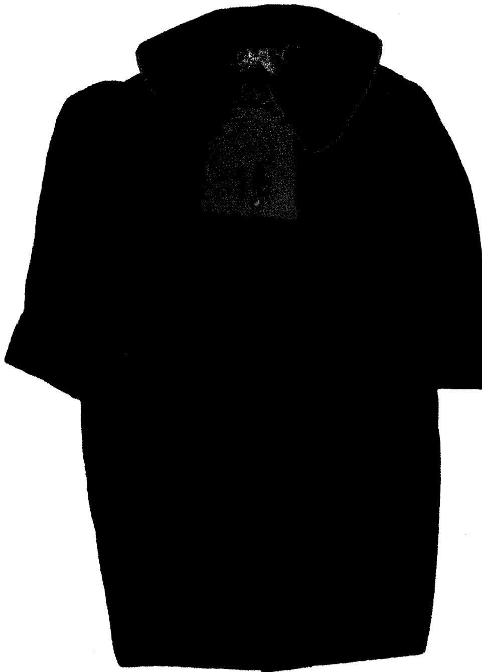
Rys. 1. Przód togi