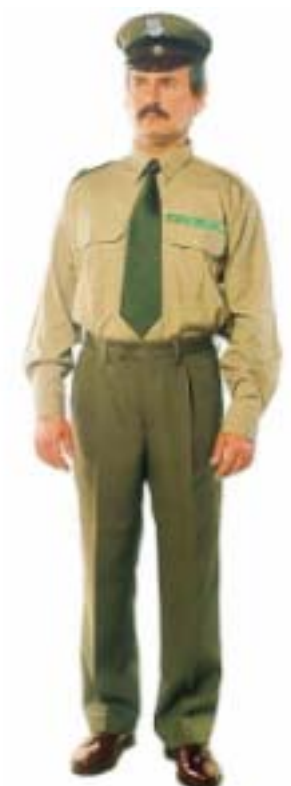
Mundur męski z koszulą z długim rękawem