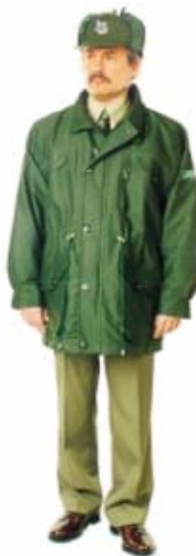
Kurtka do munduru