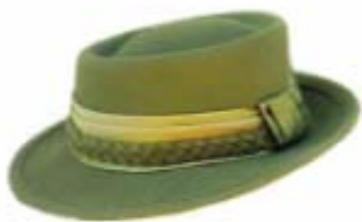
Kapelusz damski do munduru wyjściowego