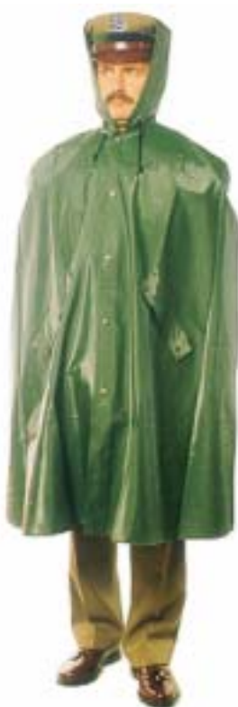
Peleryna do munduru