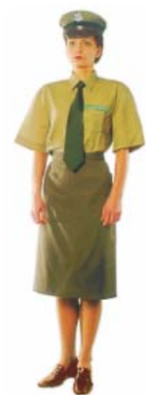
Mundur damski z koszulą z krótkim rękawem