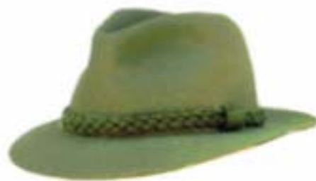
Kapelusz męski do munduru wyjściowego