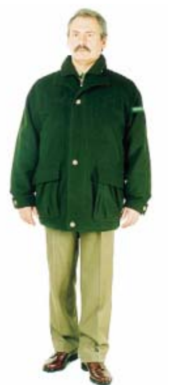
Kurtka zimowa męska