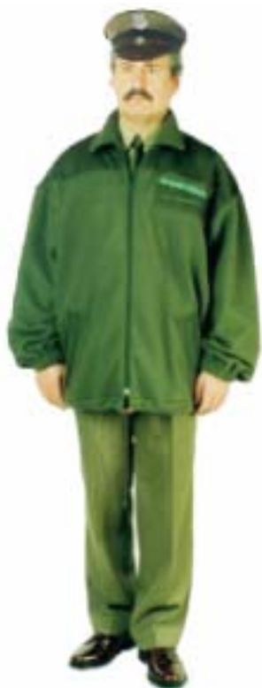
Bluza z polaru do munduru