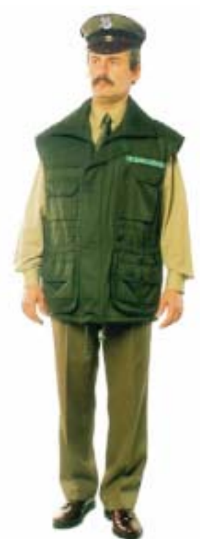
Kamizelka do munduru