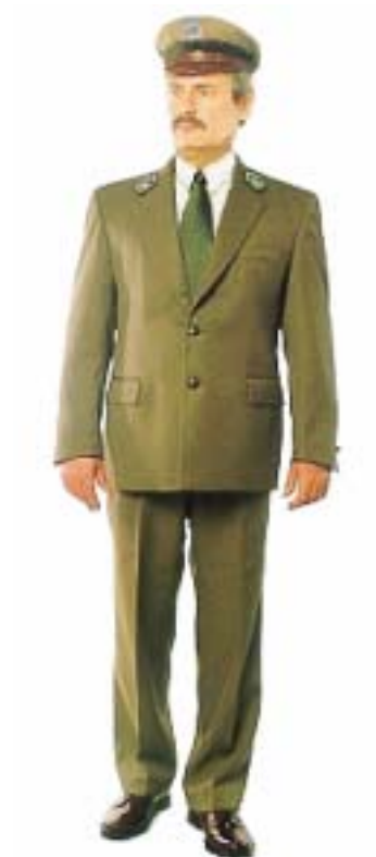
Mundur wyjściowy męski