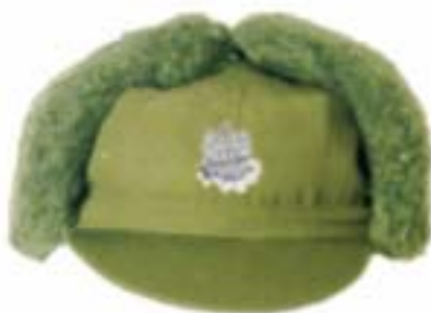
Czapka zimowa do munduru polowego