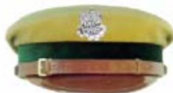
Czapka do munduru wyjściowego i polowego