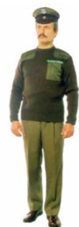
Sweter do munduru