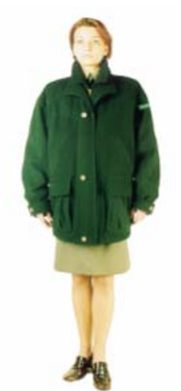
Kurtka zimowa damska