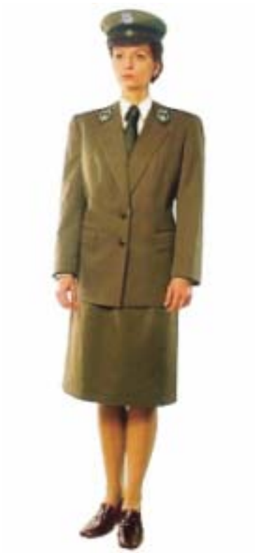
Mundur wyjściowy damski